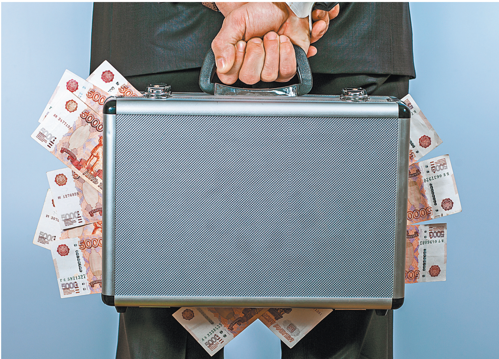
Если чиновник не сможет доказать, что заначка в чемодане накоплена законно, деньги у него заберут.

Новые инициативы исправляют ситуацию. Председатель Государственной думы Вячеслав Володин некоторое время назад