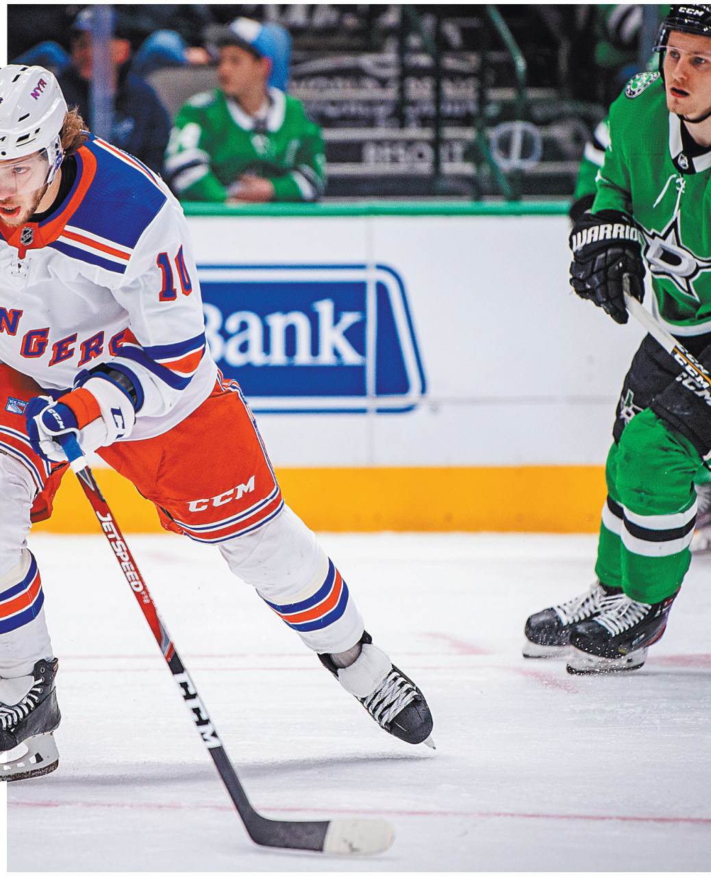
Артемий Панарин — один из тех, от кого ждут подвигів в стартовом плей-офф НХЛ.

американской прессе за свою закрытость и стерильность «пузырями», категорически запрещено. То есть игроки команд, которые дойдут до финала, могут пробыть в добровольном заточении до двух месяцев.