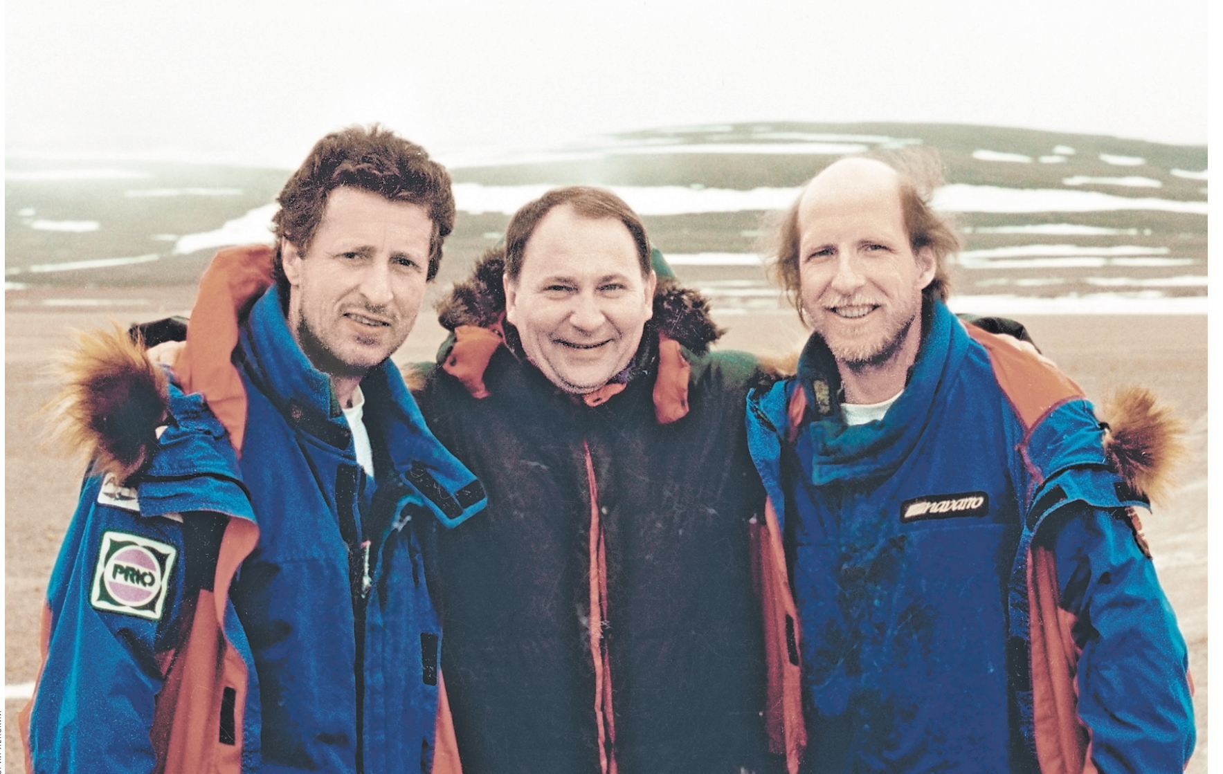
У меня есть фотографии, где я — рядом с выдающимися политиками, бизнесменами, деятелями искусств, замечательными профессионалами (любой журналист может потешить свое тщеславие подобными изображениями). Но этой карточкой я горжусь более всего: никогда я не стоял так близко с людьми, которым удалось совершить то, чего уже никто и никогда не сможет повторить.

Все, что сделали Малахов и Вебер, в сущности укладывается в одно простое понятие — на исходе века они вернули полярному путешествию формулу, присущую ему изначально: Земля-Полюс-Земля. Отказавшись от самолетов и поддержки, они сознательно поставили себя в один ряд с великими путешественниками Пири, Нансеном, Амундсенем и Куком. В этом отношении им удалось соединить цепь времен, связать концы веков — девятнадцатого и двадцатого, возродив не только формулу арктических путешествий, но и общественный идеал человека,