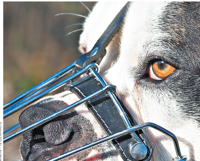
Собака считается опасной не по характеру, а по породе. Если уж довелось родиться опасной, суждено ей гулять в наморднике и на поводке.

Ленты новостей полны историями, когда встреча человека и чьей-то любимой собаки закончилась очень нехорошо. Несколько дней назад в городе Белово Кемеровской области собака отъезжала с привязи во дворе частного дома, вышла на улицу и укусила в лицо шестилетнюю девочку.