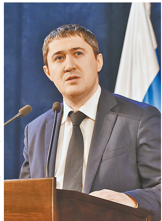
Дмитрий Махонин: Пермский край сегодня недооценен, а ведь он — соль земли русской.

Пандемия радикально изменила ситуацию в экономике. Какие меры принимаете для восстановления бизнеса и поддержки граждан, оказавшихся заложниками в это непростое время? ДМИТРИЙ МАХОНИН: Дополнительно к мерам, принимаемым на феде-