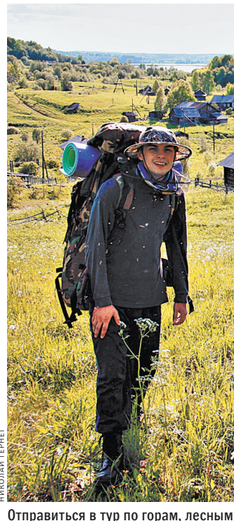
Отправиться в тур по горам, лесным тропам, маленьким поселкам можно будет на один день или на неделю.

Минприроды и Агентство стратегических инициатив (АСИ) совместно займется продвижением экотуризма. Как сообщили «РГ» в агентстве, 16 июня в стране стартует конкурс для выявления пилотных территорий по развитию экотуризма. Проводить его будет проектный офис АСИ до 16 октября. Планируется отобрать проекты для создания туристско-рекреационных кластеров на особо охраняемых природных территориях.