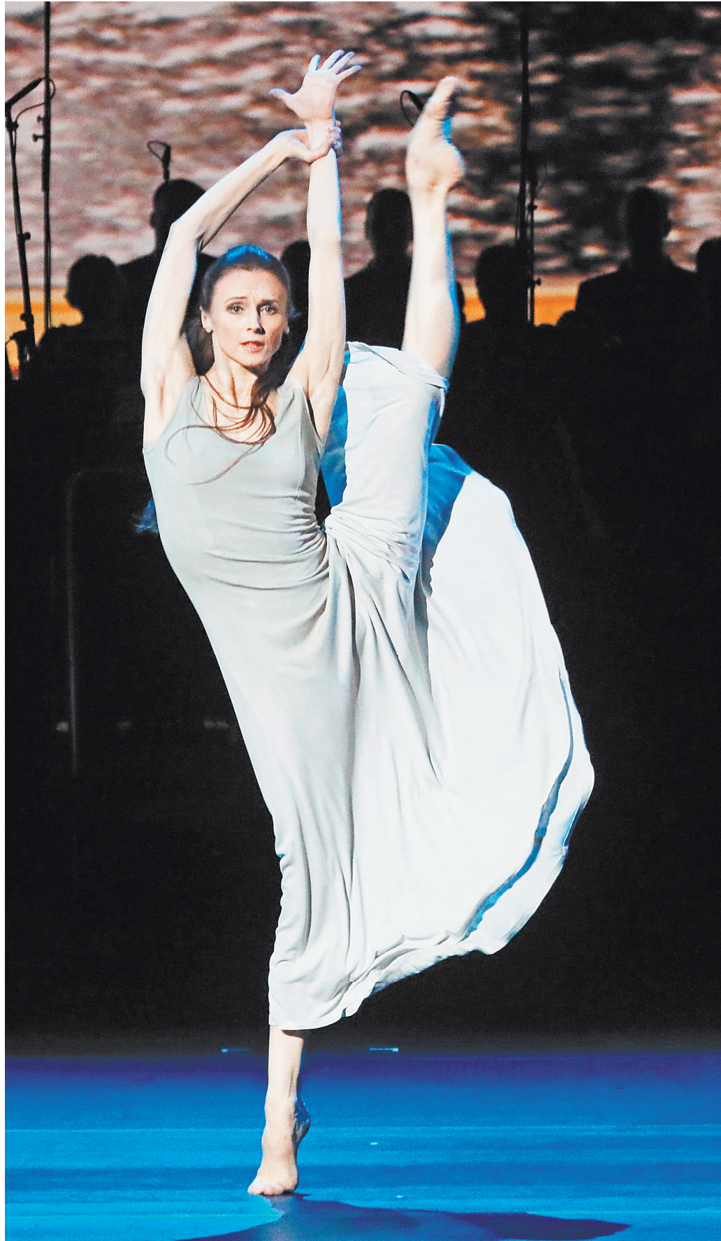
«Мы почти месяц держались в форме кто как мог... Приятнее было представлять себе, как в один прекрасный день наконец скажут, что пандемия закончилась, и все вернется на круги своя». Светлана Захарова — на церемонии вручения премии «Браво».

СВЕТЛАНА ЗАХАРОВА: Летом после сезона у меня еще много фестивалей, но когда мы всей семьей едем в отпуск, я дней 5 вообще ничего не делаю — ни гимнастики, ни растяжек, ни закачек. А потом все равно занимаюсь: договариваюсь с отелем, мне дают