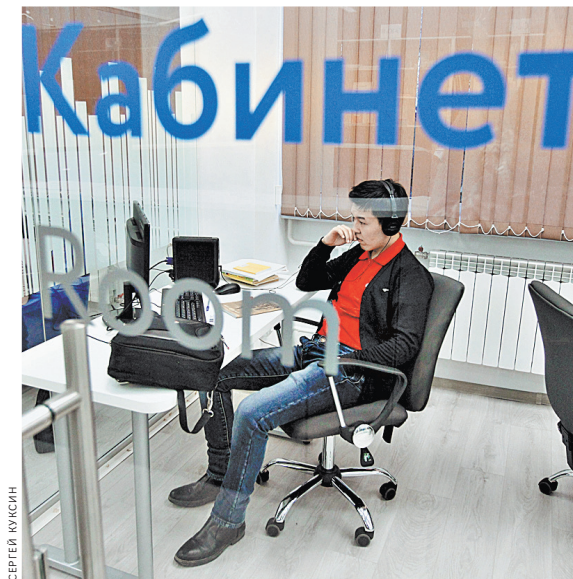
Закон не предполагает полного перехода на дистанционный режим. Он будет применяться только в крайних случаях.

Ранее сенаторы внесли в закон об образовании еще одну поправку — она разграничивает полномочия министерства просвещения и министерства науки и высшего образования по разработке порядка дистанционного обучения для школ и вузов соответственно.