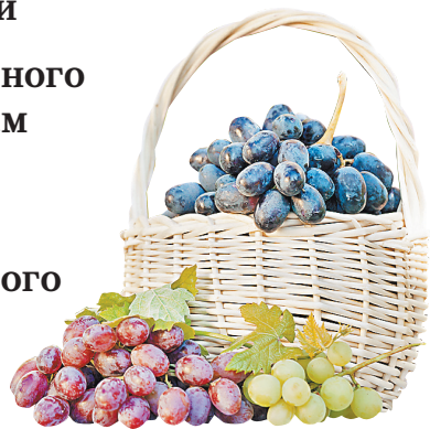
КАНАЛЫ / ISTOCK

Вино из импортного сырья станет винным напитком