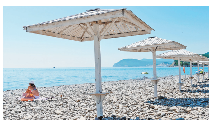
Черноморские пляжи пока пустыни. Сегодня они доступны лишь для отдыхающих открытых санаториев.