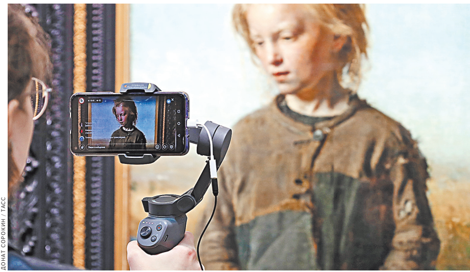
Цифровизация наступила стремительно — как многие не могли себе и представить ранее.

дипломатично поздравил министра с выздоровлением. «Это — единственная женщина, с которой безопасно вступать в контакт, потому что она уже переболела COVID-19. Иметь такого министра культуры уже счастье», — Ольга Любимова. Скорость, с которой все, даже самые академические организации, перешли в онлайн-форматы — поразительна. Но это было бы невозможно, если бы заранее не подготовились и не было бы уже нарабатанного опыта. Им было что предъявить в онлайн-формате. Цифры говорят сами за себя. 21 млн человек смотрели трансляции Мариинки. Спектакли Большого театра смотрели 134 страны. 20 марта мы стартовали с Денисом Мацуевым в Московской филармонии. Министр культуры Италии прислал письмо с благодарностью Эрмитажу за экскурсию на итальянском языке.