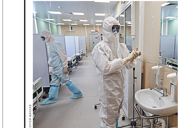
И даже полная защитная экипировка не исключает необходимости мыть руки.