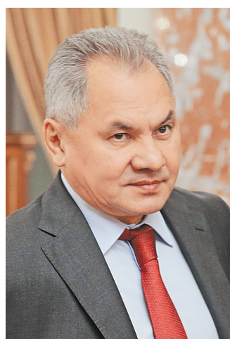
Владимир Путин наградил Сергея Шойгу орденом «За заслуги перед Отечеством» I степени с мечами. Об этом сообщает пресс-служба Кремля, напоминая, что 21 мая министр обороны исполнилось 65 лет.