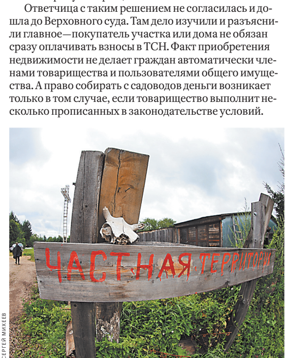
Один лишь факт обладания земельным участком не может сделать владельца членом садоводческого товарищества.

Ответчица с таким решением не согласилась и дошла до Верховного суда. Там дело изучили и разъяснили главное — покупатель участка или дома не обязан сразу оплачивать взносы в ТСН. Факт приобретения недвижимости не делает граждан автоматически членами товарищества и пользователей общего имущества. А право собирать с садоводов деньги возникает только в том случае, если товарищество выполнит несколько прописанных в законодательстве условий.