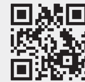
Последние новости о коронавирусе — на сайте «РГ».

За последние сутки в России зарегистрировано 8926 подтвержденных случаев коронавирусной инфекции COVID-19, из них в Москве — 3238 случаев. Всего в России зарегистрировано 290 678 случаев коронавирусной инфекции. С начала эпидемии выздоровели 70 209 человек. Скончались 2722 человека.