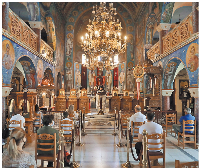
Обязательная дистанция между молящимися — полтора метра. На этом расстоянии теперь стоят стулья, которыми заменили привычные скамьи.

— Все новости по теме на сайте rg.ru/sujet/covid-19