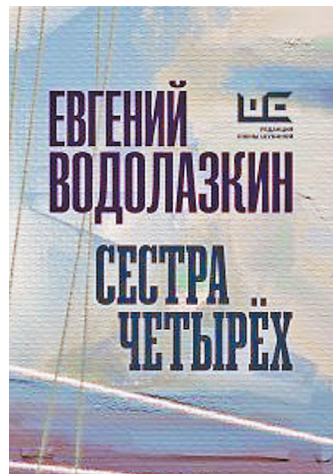
Евгений Водолазкин написал камерную пьесу, действие которой происходит в замкнутом помещении.

Пандемия и сопутствующий ей карантин чрезвычайно усложнили выход новых книг, потому что типографии — это достаточно крупные производства. Которые тоже, естественно, закрылись на карантин. Но при этом парадоксальным образом упростились выход новых произведений. Потому что ни известные авторы, ни престижные издательства не считают более ниже своего достоинства выпускать их сразу в безбумажном виде — было бы что выпустить. Но и с этим тоже проблем нет — жизнь даже самым правоверным реалистам подкидывает сюжеты фантастам на зависть.