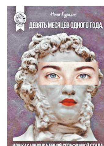
Речь не о важнейших в жизни женщины месяцах беременности, а об академическом учебном годе.