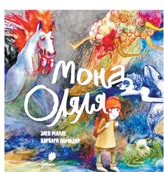
Историю девочки, которая живет в мире букв, передают и яркие, порою до галлюцинаций, рисунки.

История девочки, которая живет в мире букв, передают и яркие, порою до галлюцинаций, рисунки.