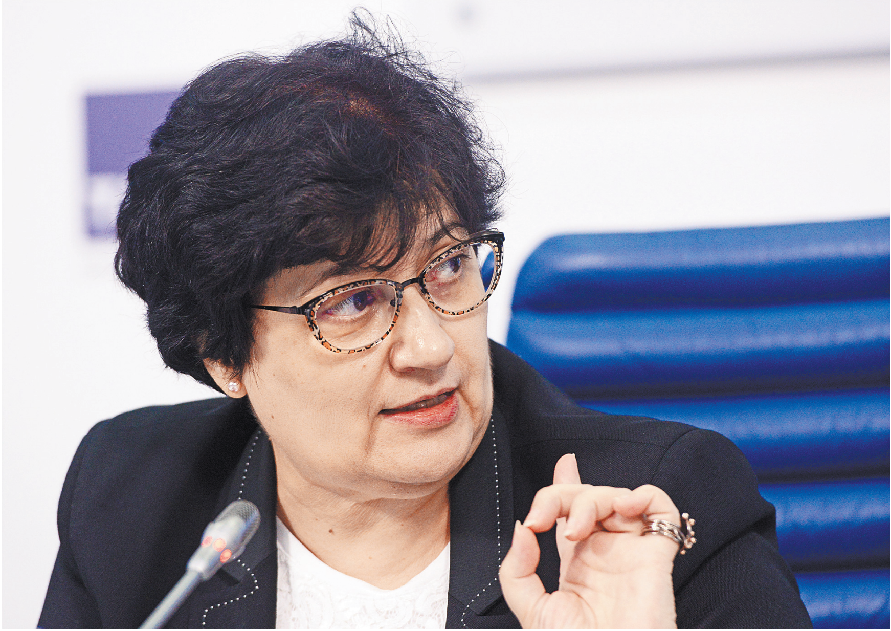
Мелита Вуйнович: Ваша страна имеет очень сильную эпидемиологическую службу.

МЕЛИТА ВУЙНОВИЧ: ВОЗ никого не оценивает, это не входит в наши функции. Просто некоторые ваши коллеги-журналисты так комментируют наши действия. Могу сказать, что Россия предприняла весь комплекс мер по сдерживанию эпидемии внутри страны. Мы ничего не рекомендовали вашей стране. Но ваша страна имеет очень сильную эпидемиологию/эпидемиологическую службу и сразу начала заниматься сдерживанием вируса. Это помогло