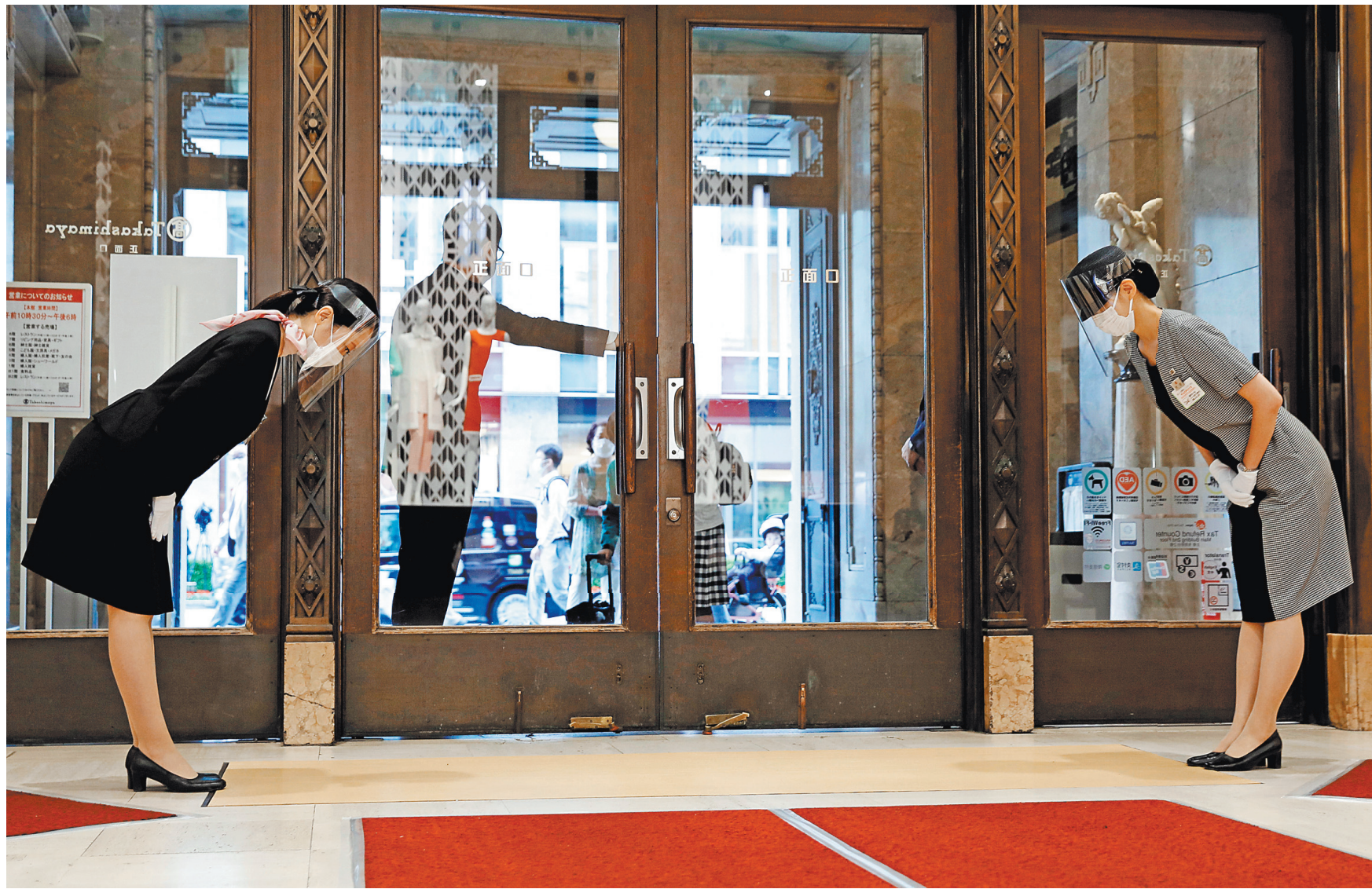
Этот торговый центр в Токио готов открыть двери и принять первых посетителей после режима ЧС, но со всеми предосторожностями: персонал в масках, двери открывает отдельный сотрудник.

Наметившаяся тенденция позволила премьер-министру Синдзо Абэ 14 мая объявить о досрочном прекращении режима ЧС почти на всей территории островного государства — в 39 из 47 префектур. Особые меры остались в силе только в восьми регионах — Токио, Осаке, Киото, северном губернаторстве Хоккайдо, префектурах Канагава, Сайтама, Тиба и Хёго, которым в ближайшие недели предстоит бросить все силы на борьбу с COVID-19. Впрочем, местные специалисты не исключают возникновения впоследствии новых волн коронавирусной инфекции и просят не спешить с отказом от мер предосторожности. Как пишут СМИ, кое-где в Японии уже открылись места развлечений и отдыха. К примеру, в префектуре Тотиги на острове Хонсю 15 мая возобновил деятельность парк с каруселями и другими аттракционами. В первый день работы посетителей было немного, вероятно, из-за дождливой погоды, а может, семьи с детьми просто решили поостеречься. На входе у пришедших измеряли температуру и просили оставить контактные данные, чтобы можно было связаться при необходимости.