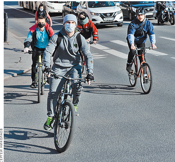
Спрос на велосипеды увеличился более чем на треть, а в некоторых городах — в два раза.

«Авито» отмечает ажиотажный спрос россиян на велосипеды в апреле и мае. По сравнению с тем же периодом в 2019 году спрос вырос на 36% по всей России, а в некоторых городах — например, в Красноярске — в два раза.