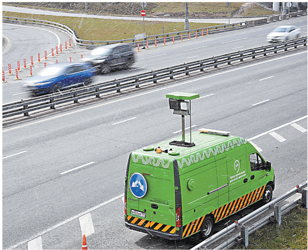
0 присутствию на дороге такой камеры должен предупреждать знак.

Напомним также, что на заседании правительства высказывалось предложение создать механизм, при котором вынесение штрафов с камер, не обозначенных в информационных системах, будет невозможно. Сейчас ознакомьтесь с местами установки комплексов можно на сайте Госавтоинспекции гбдд.рф. Однако не все водители знают, что ждет их за поворотом. И если камеры устанавливаются для обеспечения безопасности, для устранения очагов аварийности, а не для пополнения региональных бюджетов, то они должны быть видны, а водители следуют предупреждать о них заранее. Отсутствие предупреждающего знака должно быть основанием для отмены штрафа. ●