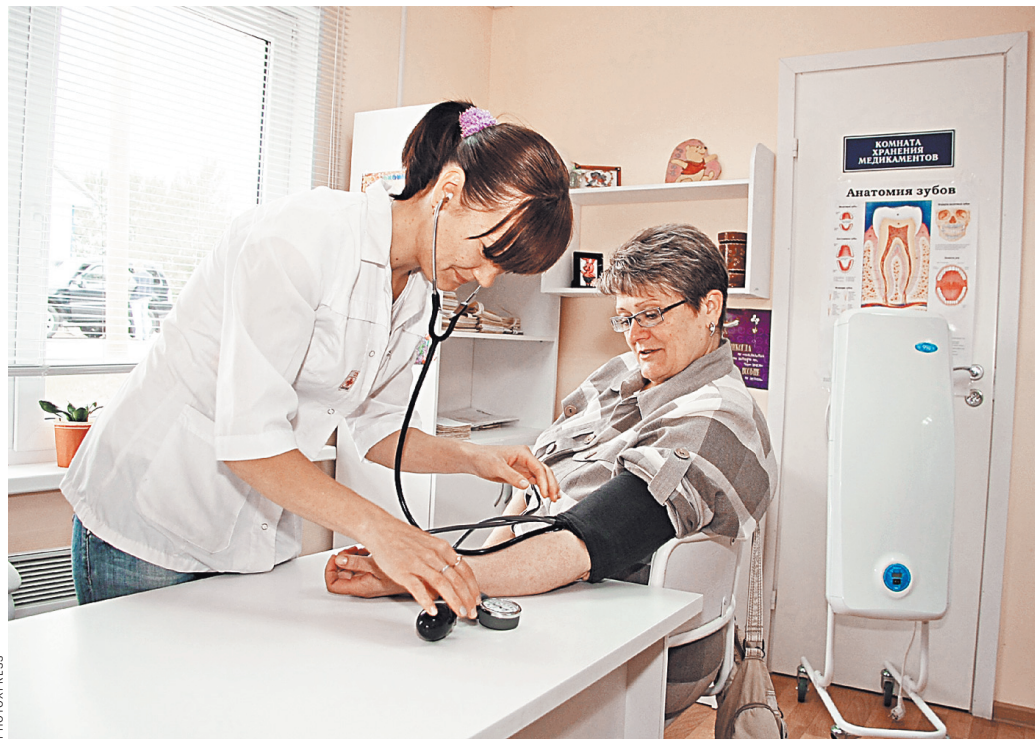
Увеличение числа бюджетных мест в региональных медвузах поможет решить проблему врачей на селе.

Будет — и это чрезвычайно важно — увеличено количество