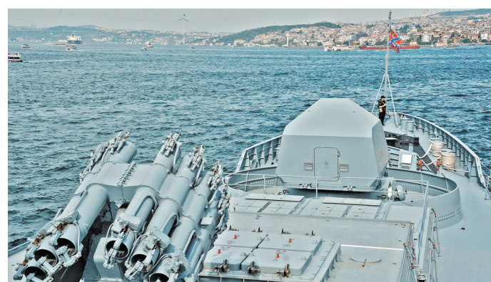
Звездой салона стал российский фрегат «Адмирал Эссен», прибывший в Стамбул из Севастополя.