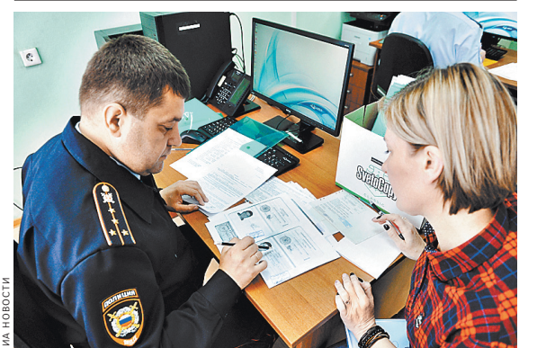
Массово подавая документы на получение гражданства РФ жители ДНР смогут начиная с 7 мая. По планам местных чиновников, в неделю станут обслуживать по 4 тыс. человек.

В МВД пояснили, что возможность приобрести российское гражданство в упрощенном порядке благодаря подписанному президентом России указом появится у более широкого круга лиц, нежели только жителей ДНР и ЛНР. При этом лица вышеречисленных категорий могут обратиться с заявлениями о приобретении гражданства России, не отказываясь от имеющегося гражданства.