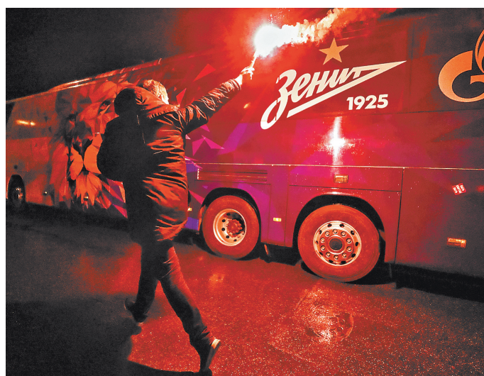
Около пяти тысяч болельщиков встречали футболистов и тренеров «Зенита» у аэропорта Пулково-2.