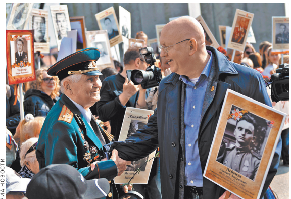
Постпред России при ООН Василий Небензя прошел с фотографией своего отца.

Колонна «Бессмертного полка» прошла и по центральному району австралийского Сиднея. Ее участники возложили цветы к Могиле Неизвестного Солдата и почтила минутой молчания память павших. ●