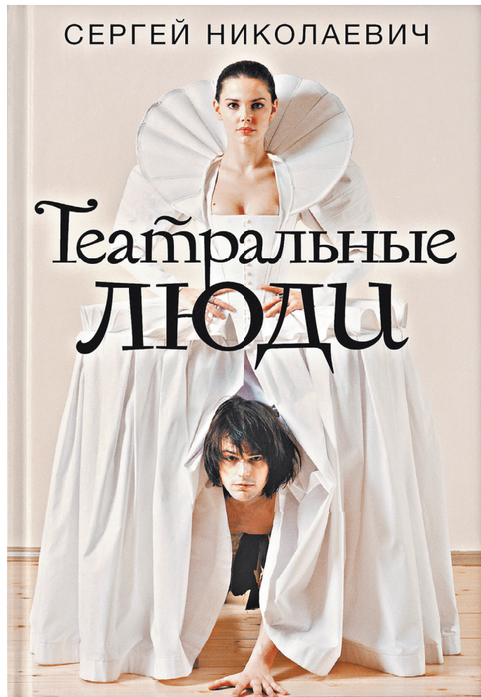
На обложке книги — Данила Козловский и Елизаветой Боярской.

ДАНИЛА КОЗЛОВСКИЙ: С каждым годом, с каждым новым качеством, новой идеей, проектом, спектаклем я все острее ощущаю, как приходится преодолевать себя, свои комплексы, страхи, свое отношение к информационному и общественному полю. Борьба с самим собой, как это ни банально, самая изнурительная.