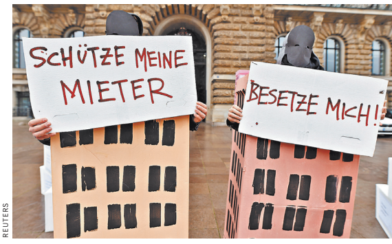
Протестующие в Гамбурге притворились домами с вывесками «Защитите моих арендаторов» и «Арендуйте меня».