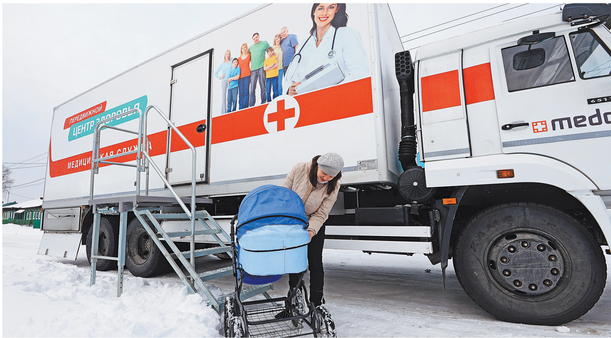
Поликлиники на колесах доедут даже в самые отдаленные населенные пункты.