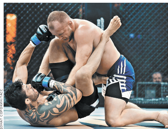
Александр Шлеменко (справа) на турнире в Челябинске одержал 58-ю победу в карьере.