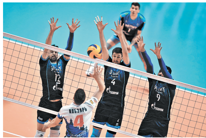
Обычно крепкий блок казанского «Зенита» в этой финальной серии пока не справляется с нападением «Кузбасса».

Интересно, что «Кузбасс», дебютировав в Суперлиге в сезоне 2010/11, еще ни разу не становился призером чемпионата страны. В прошлом году команда была четвертой.