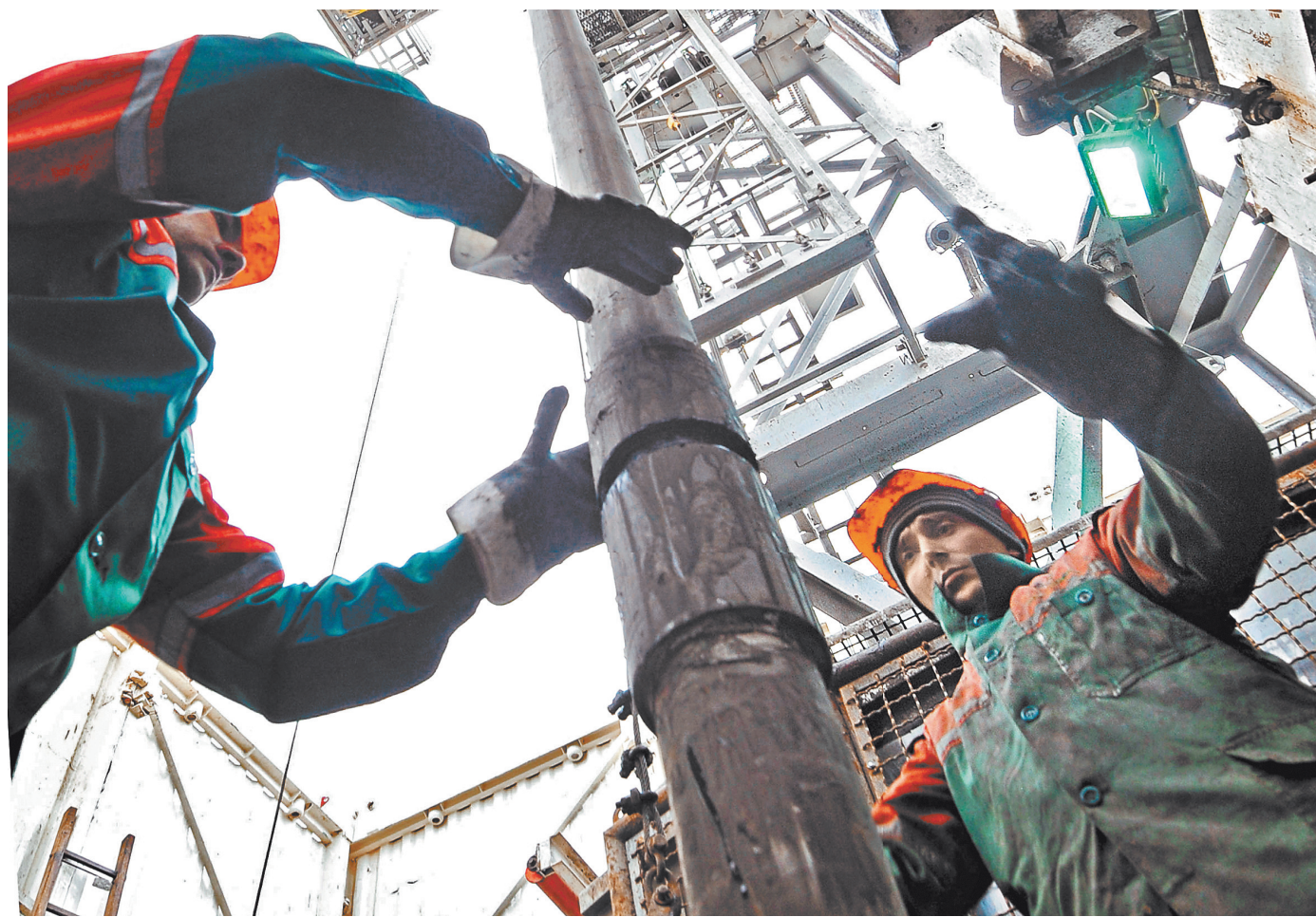
4 мая партия российской нефти уже без примесей дошла до узла учета на территории Белоруссии.

тонн могут составлять объемы российской нефти, которые необходимо очистить от примеси дихлорэтана