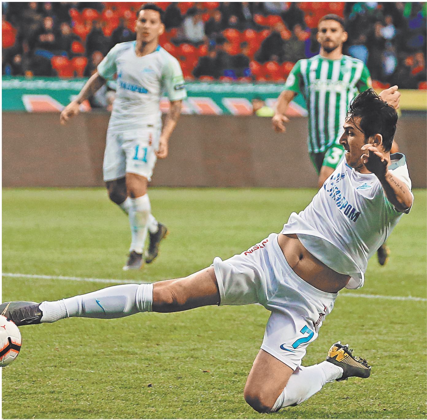
Сердар Азмун перешел в «Зенит» этой зимой и помог питерцам завоевать чемпионство.

В какой-то мере символично, что именно матч с «Ахматом» стал чемпионским для «Зенита». Два года назад гроз-