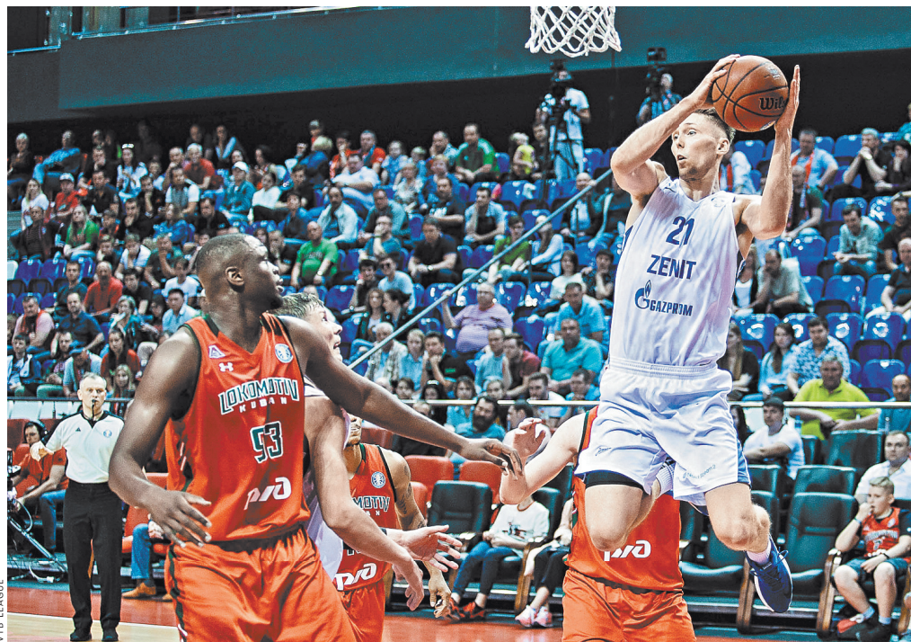
Игроки питерского «Зенита» (в белой форме) по итогам регулярного чемпионата оказались ниже «Локомотива-Кубани». Но первый матч плей-офф завершился именно в их пользу.

Надо отдать должное организаторам: делают все, чтобы сделать посещение баскетбольных матчей «Локо» максимально