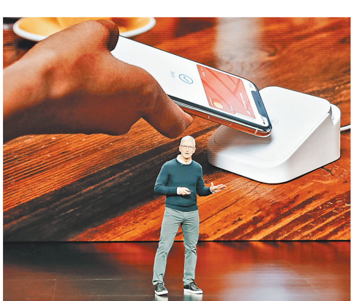
Apple раздает кредитки. Прямо в смартфоне можно будет открыть карту Apple Card и платить ей в магазинах и в Сети.