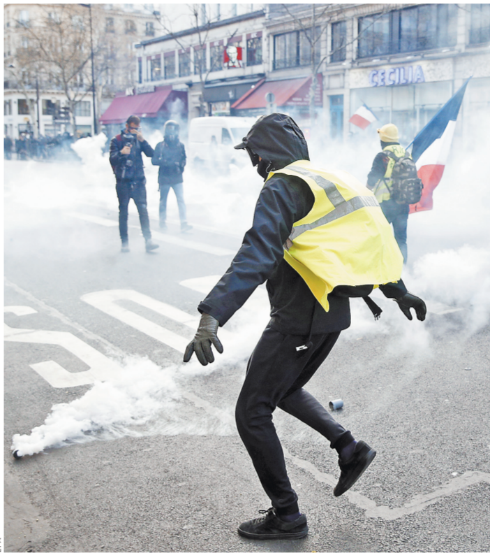
Возникнул вопрос — отразится ли ситуация в городе на выступлениях Большого театра? Сможет ли публика добраться в 19-й округ на концерт? К удивлению, филармонический зал оказался переполнен: аншлаги.