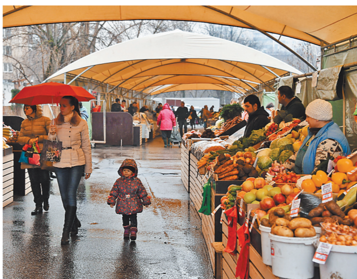
Ярмарки давно стали визитной карточкой каждого района — с утра в пятницу горожане спешат к фермерам за свежими продуктами.

Где могут появиться ярмарки выходного дня? В Орехове-Борисове Северном — на ул. Домодедовская, вл. 12. В Отрадном — на Алтуфьевском шоссе, вл. 30г и ул. Отрадная, вл. 16. В Перове — на Зеленом проспекте, вл. 2. В Филиях-Давыдовке — на ул. Ватутина, вл. 18, корпус 2. В Южном Медведкове — на ул. Полярная, вл. 10. В Бескудниковском районе — на Бескудниковском бульваре, вл. 40, корпус 2. ●