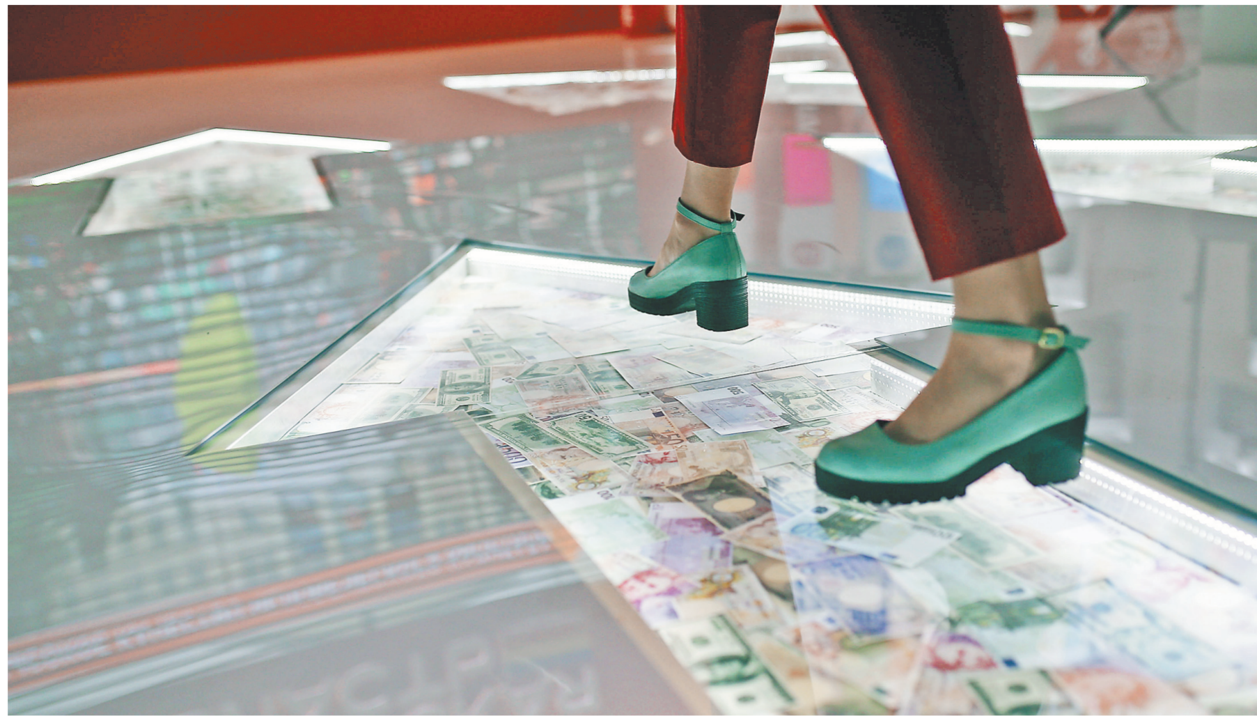
Объем сбережений населения на депозитах выросли после двух подряд повышений ключевой ставки Банка России.

Однако эксперты не видят в этом ничего удивительного.