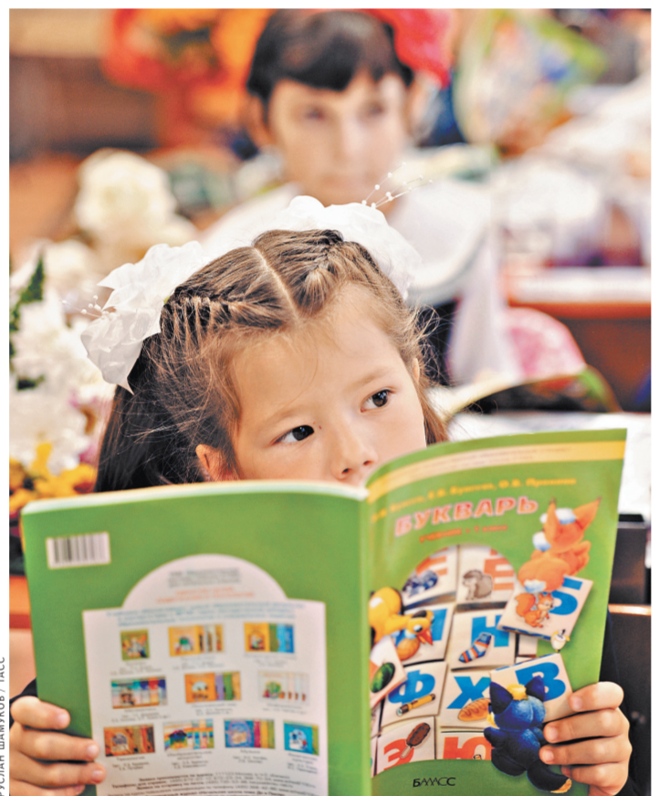
Главная претензия родителей: учебники написаны сложным и скучным языком. А задания зачастую рассчитаны на мам и пап, а не на ребенка.

выстроить все это в связную «цепочку», понадобится несколько лет. Сейчас разрабатываются обновленные стандарты, где будет прописано, что и в каком классе должен знать ребенок. На их основе для всех школ будут написаны примерные образовательные программы. И им же должны будут соответствовать абсолютно все учебники, которые останутся в федеральном перечне. В ближайшие годы, скорее всего, он снова обновится. А может, и не раз. ●