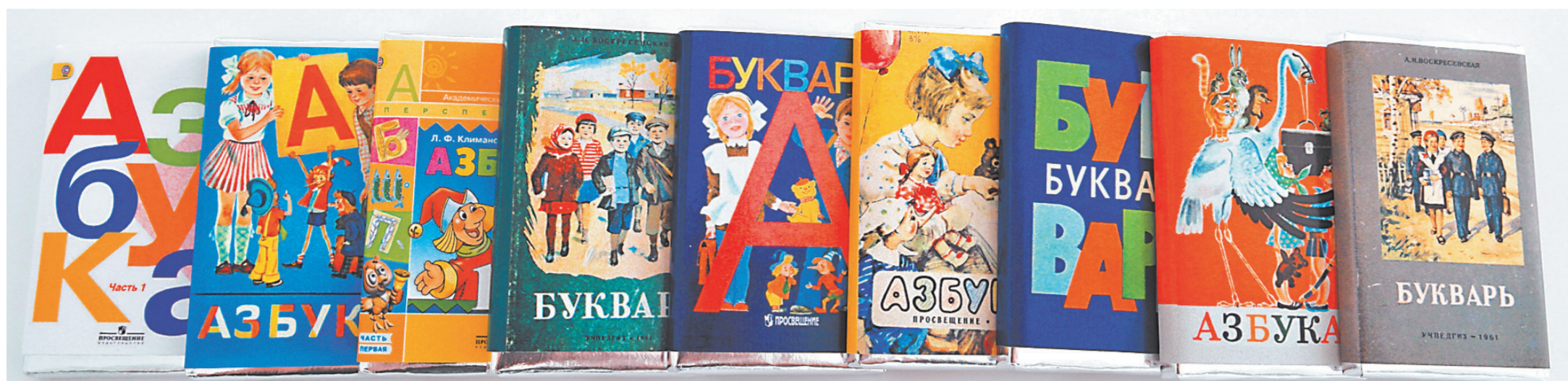
«Нынче в школе первый класс — вроде института»: читать и писать надо научиться за полгода. В помощь — азбука, букварь. Ну и, конечно, мама с папой. Чтобы сделать уроки вместе с детьми, большинство семей тратит около двух часов в день.

1 ← Перечень сократился больше чем на треть. Сейчас на дополнительную экспертизу снова ушли почти 500 изданий. Но делать двойную работу, проводить экспертизу за экспертизой тоже не выход. Это очевидно всем: системе нужны прозрачные и понятные механизмы. К примеру, по новому порядку все эксперты будут проходить строгий отбор. Среди критериев — опыт научно-исследовательской деятельности, опыт работы в школе. Плюс наличие у кандидата профессиональных достижений. Кроме того, фамилия и имя эксперта будут публиковаться на самом учебнике.