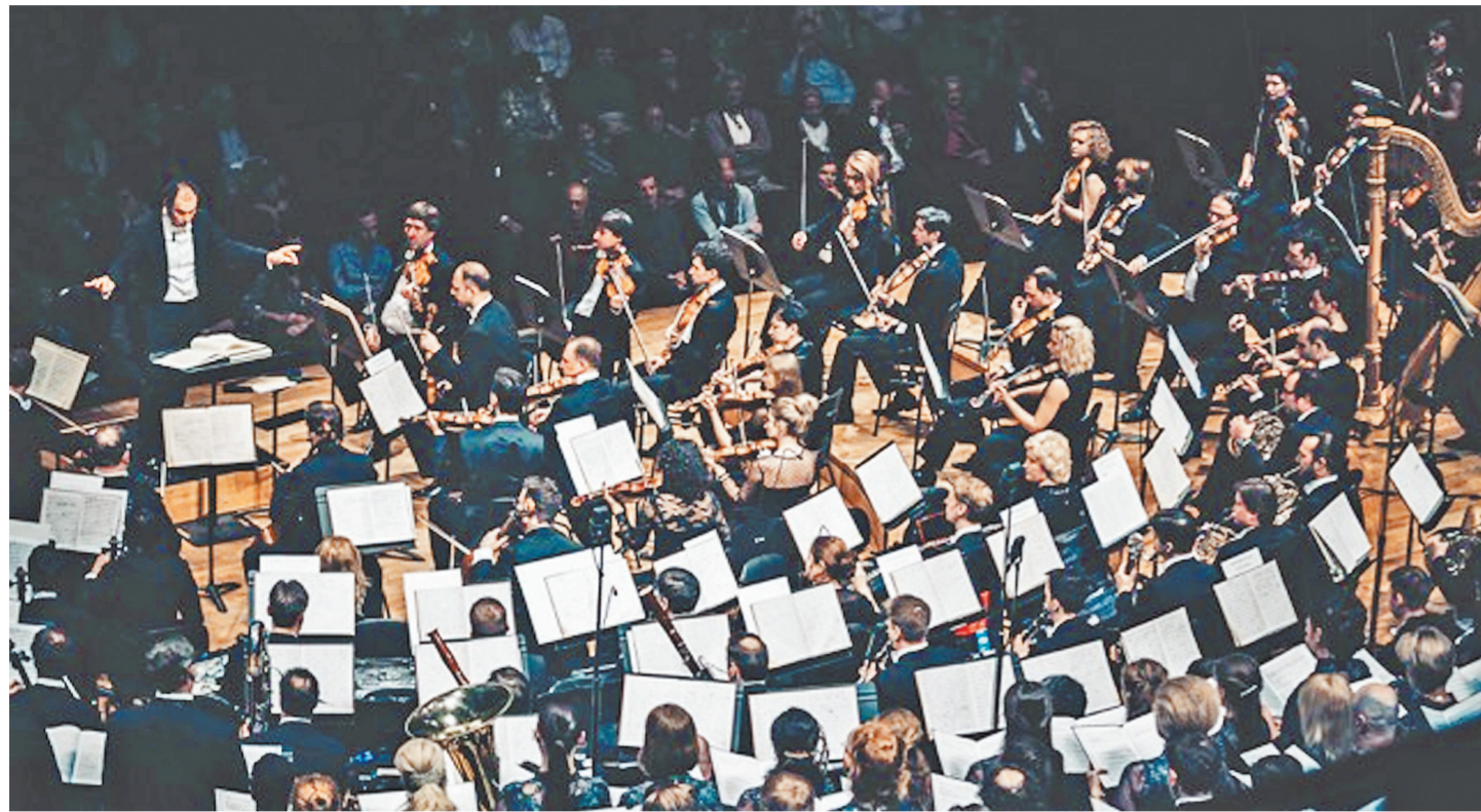
Возникнул вопрос — отразится ли ситуация в городе на выступлениях Большого театра? Сможет ли публика добраться в 19-й округ на концерт? К удивлению, филармонический зал оказался переполнен: аншлаги.