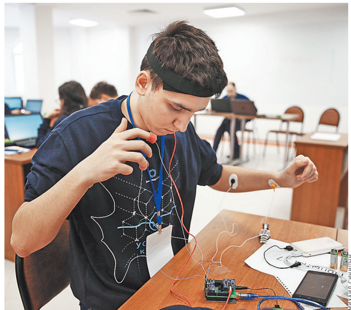
Школьники-нейротехнологи буквально обвешаны датчиками и проводами.