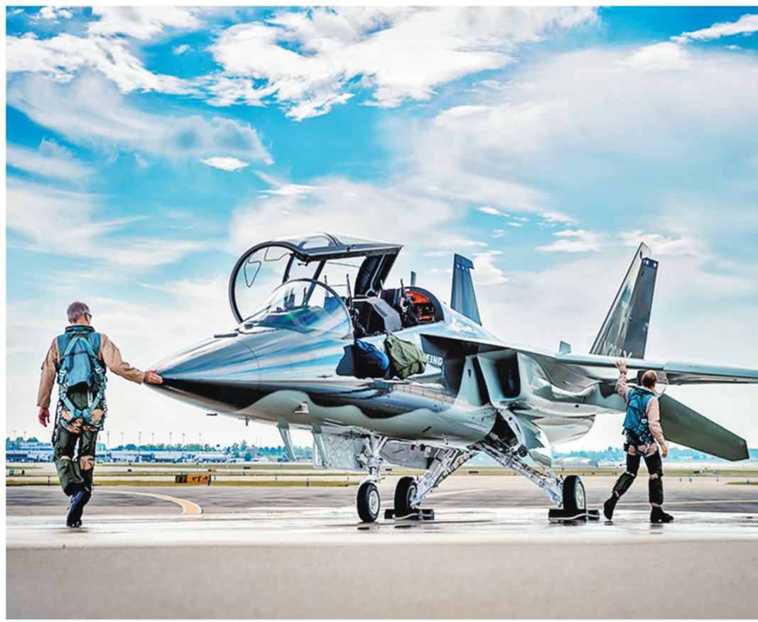
Такой учебный сверхзвуковой самолет американцы смогли сделать лишь со шведами и им очень гордятся.