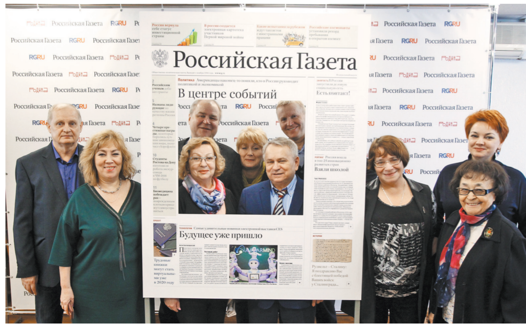
Короли и королевы региональной прессы в гостях у «Российской газеты».

турных инициативах «Российской газеты», таких как «Читаем ONLINE», «Басни Крылова. Прочитай вместе!». «Год литературы», книжный фестиваль «Красная площадь». Особое внимание уделяется онлайн-кинотеатру «Дубль Дв@», который в этом году празднует свое десятилетие.