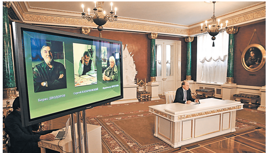
Имена лауреатов Владимир Толстой объявил по традиции в День работника культуры.