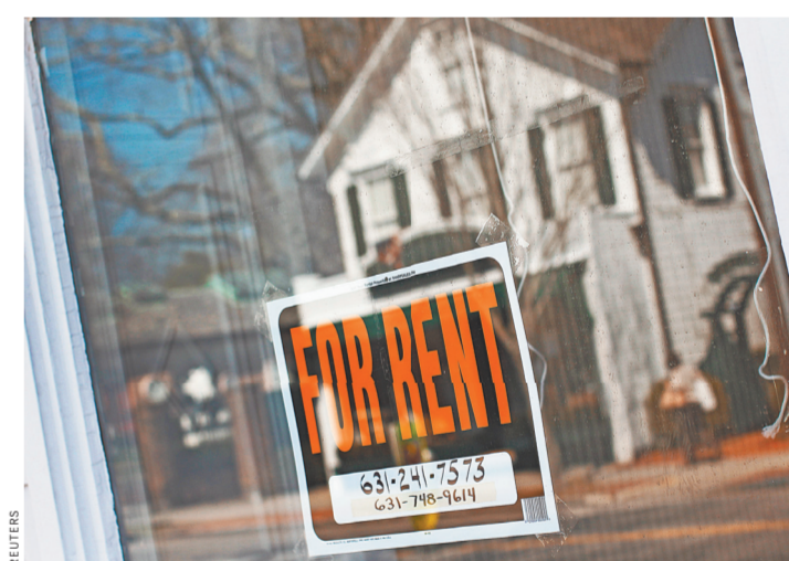
Вячеслав Прокофьев, «Российская газета», Париж

Нет ничего проще для приезжих, чем снять частное жилье в Париже на день, два, неделю. Для этого достаточно выйти на интернет-платформу типа Airbnb, специализирующуюся на посредничестве при аренде квартир на короткий срок, и выбрать подходящий вариант. По такой схеме в Париже сдается до 100 тысяч квартир, а по стране — еще 400 тысяч. В этом деле есть те, кто выигрывает, а есть и те, кто проигрывает.