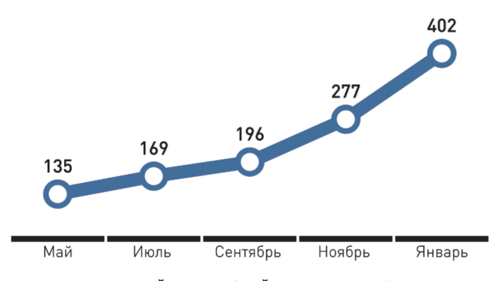
РОСТ АУДИТОРИИ САЙТА RG.RU (МАЙ 2018 – ЯНВ. 2019). МЛН. ПОЛЬЗОВАТЕЛЕЙ