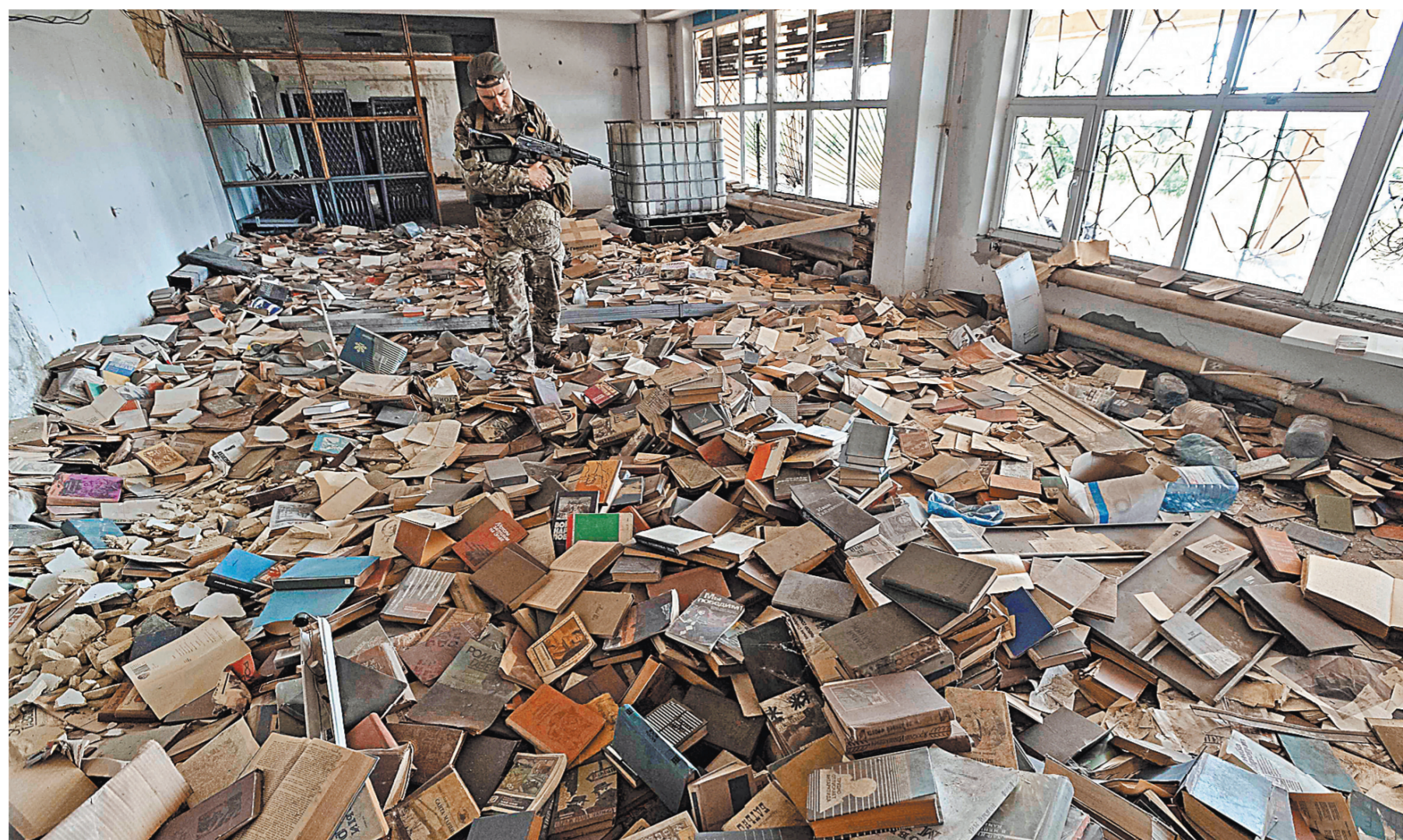
Раньше украинские запреты на ввоз книг из России носили «точечный» характер. Теперь под самостийные «санкции» попадают целые издательства, в том числе, крупнейшие в России.

Общезвестно, что 60% украинцев предпочитают читать книги на русском языке и введенные запреты ударят в первую очередь по жителям Украины, нарушат их права на доступ к информации, к книгам российских писателей, ведущих зарубежных авторов, чьи произведения традиционно качественно переводятся на русский язык».