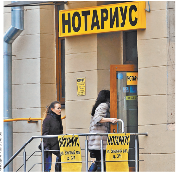
Все нотариусы по закону несут материальную ответственность за ошибки, допущенные по их вине.

Из всего сказанного Верховный суд сделал следующий вывод: нотариус несет ответственность за вред, причиненный по его вине из-за «ненадлежащего осуществления нотариальных действий». При этом, по Гражданскому кодексу, доказывать, что его вины нет, должен сам нотариус.