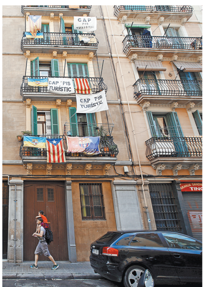
В европейских городах, таких как Барселона, не всегда рады туристам.