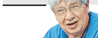
Кирилл Разлогов, культуролог

Чиновников обжуют быстрее отвечать на письма граждан: если раньше у государственных служащих на ответ было 30 дней, то сейчас его срок сократили до 20.