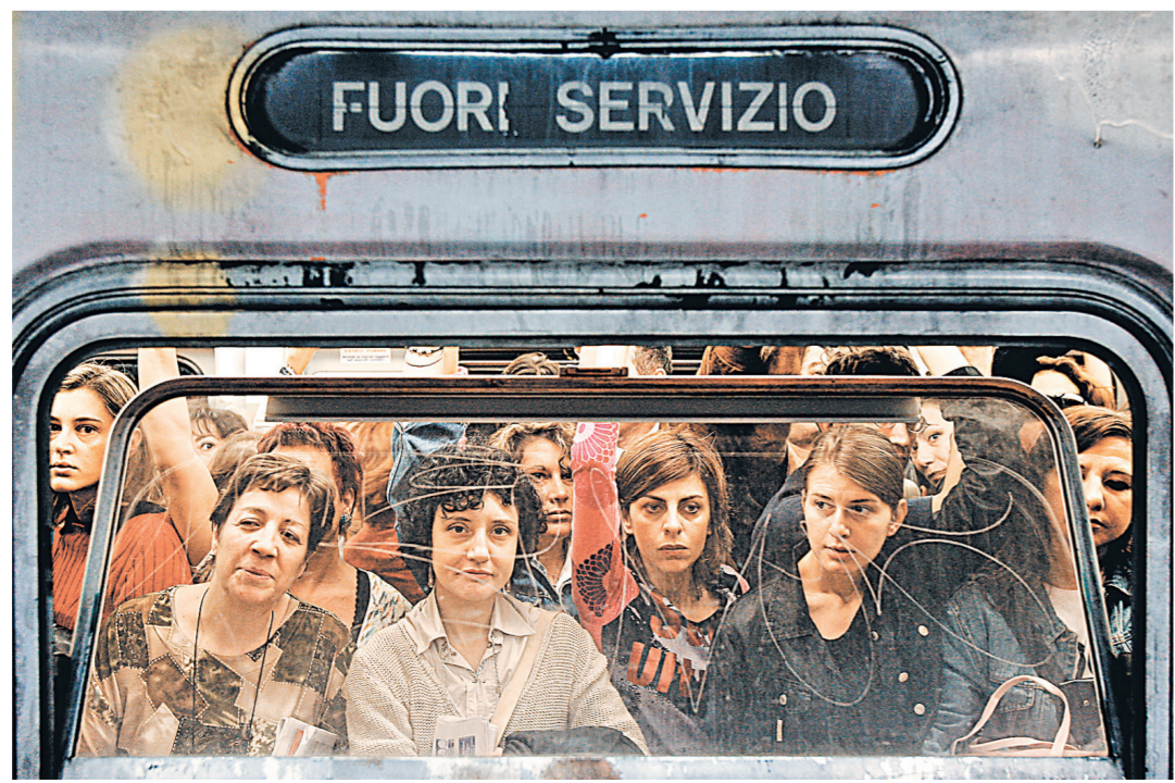
Закрытие трех станций метро стало неприятным сюрпризом даже для привычных к таким проблемам римлян.