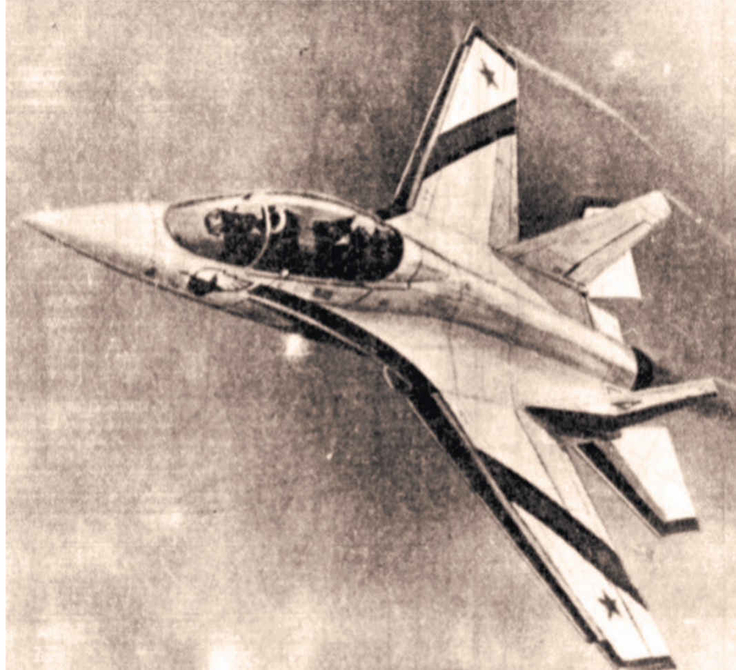
Сверхзвуковой учебный С-54 мог появиться у нас на тридцать лет раньше, чем в США. И он был лучшим.