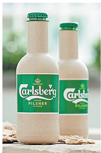
На первых порах производство бумажных бутылок для пива вряд ли станет массовым.