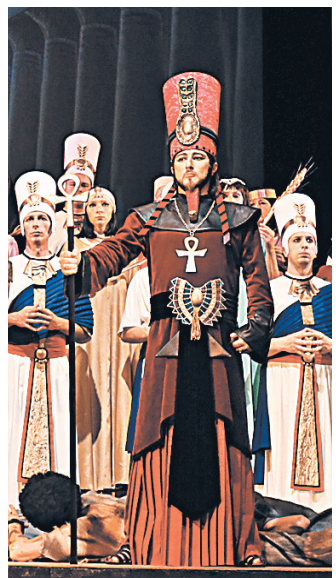
На фестивале Музыкальный театр Владикавказа показал премьеру оперы «Аида».

В программе форума было и выступление Симфонического оркестра Мариинского театра под руководством Валерия Гергиева, и лауреатов XVI Международного конкурса им. П.И. Чайковского, а также гастроль Театра балета им. Леонида Якобсона со спектаклем «Жизель», концертное исполнение опер, что никогда еще не звучало на этой сцене, «Богема» Пуччини и «Пеллеас и Мелизанда» Дебюсси, полномасштабная премьера которой будет в Петербурге в конце октября. И самое ответственное название для Владикавказской труппы — опера Верди «Аида» — премьера, сделанная силами театра для репертуарного показа.