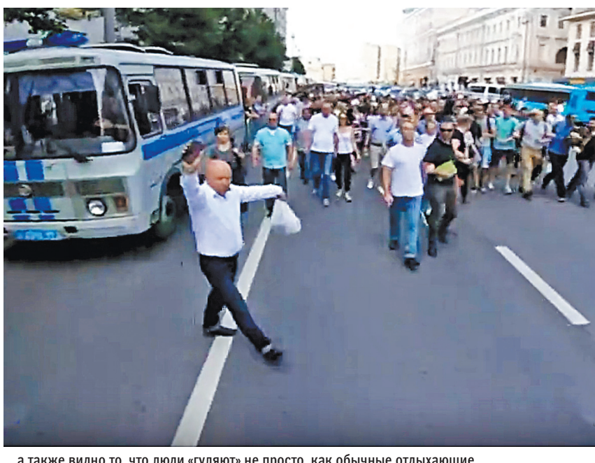
...а также видно то, что люди «гуляют» не просто, как обычные отдыхающие.

Открытые реестры нотариата позволяют гражданам бесплатно по Сети проверить доверенность