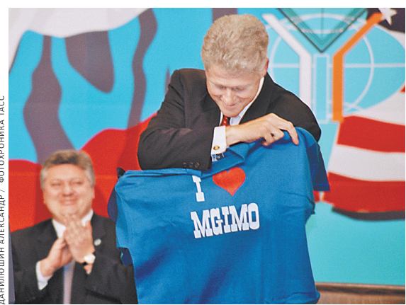
Многие мировые лидеры побывали в стенах МГИМО. На фото — Билл Клинтон во время встречи со студентами вуза, 1998 год.