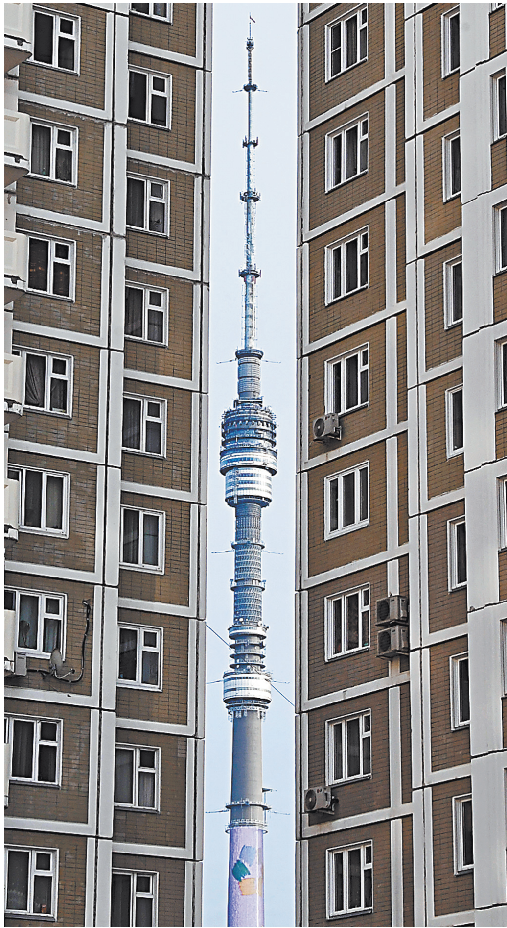
Если нет денег на цифровую приставку, чтобы смотреть качественное ТВ, региональные власти помогут ее купить.

— Переход на цифровое телевидение: все новости на сайте rg.ru/sujet/6102