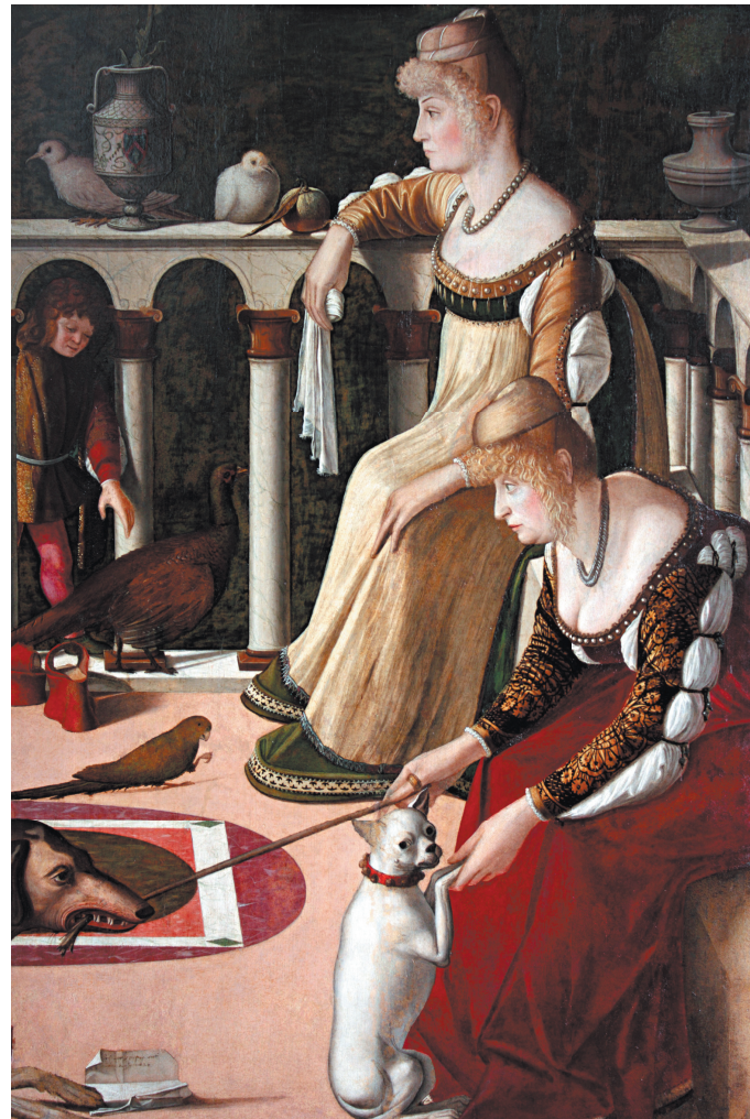
«Две венецианские дамы» Витторе Карпаччо гостят в Петербурге.

На отпленной верхней части — сцена охоты на водную дичь, мужчины в лодках с луками наперевес, подстрелянные утки, косой птвичий клин, уходящий вдаль... И продолжение деталей первого полотна (цветок лилии в вазе, миртового деревца), и химический, а также дендрологический анализ обеих дощечек убедительно свидетельствуют: