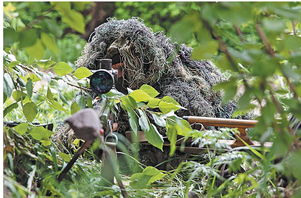
Для успешной борьбы с террористами одной лишь снайперской винтовки мало. В борьбе с террором используется не только самое современное оружие, но и высокие технологии.

Проходящие на форумах дискуссии несут открытый характер. Это наглядно демонстрирует понимание необходимости укреплять доверие между государствами для эффективной борьбы с терроризмом, способствует сближению позиций национальных компетентных органов и выработке согласованных подходов к оценке сложных явлений, связанных с терроризмом в разных странах мира. ●