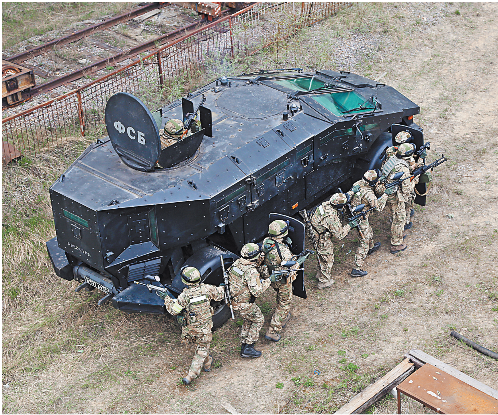
У российских спецслужб богатый опыт проведения антитеррористических операций.

террористических акций: в Голландии, Германии, Норвегии, Испании и Франции. Что подтверждает серьезность сделанных ранее главарями международных террористических организаций заявлений о своей нацеленности на совершение терактов в Европе. В свою очередь перенос вектора террористической активности на страны Запада провоцирует ответную реакцию со стороны ультраправых радикалов. Примером является нападения на комплексы мечетей в Новой Зеландии, США, Великобритании и Германии. В связи с этим нельзя сбрасывать со счетов и угрозы, исходящие от экстремистов различных мастей. Волна экстремизма и терроризма не должна захлестнуть цивилизованное сообщество.