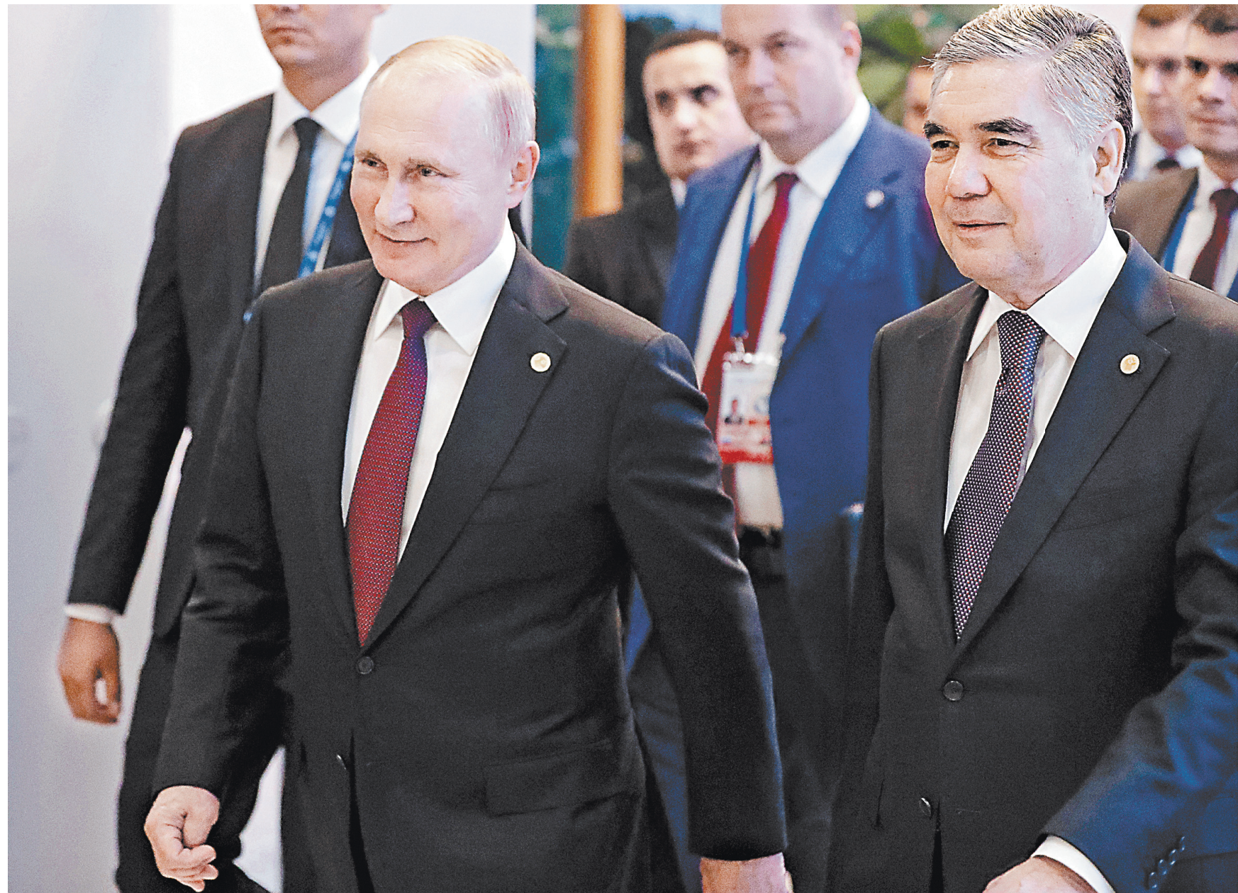
МОХАММЕДОВ / ТАСС