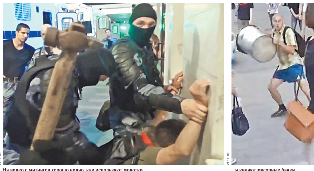
На видео с митингов хорошо видно, как используют молотки.

Читайте документ на сайте rg.ru/art/1713935