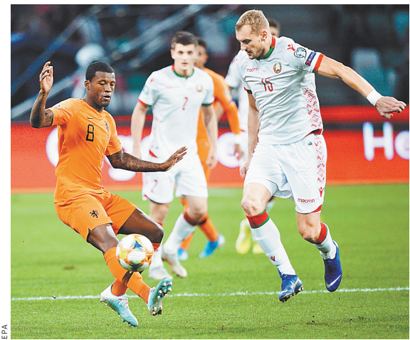
Полузащитник сборной Нидерландов Жоржиньо Вейналдум стал героем встречи с Беларусью. На его счету дубль.

Ряд интересных матчей отборочного цикла состоится сегодня. Самая громкая афиша — противостояние действующих чемпионов мира французов и турок. Эти команды являются лидерами группы «Н», в которой конкуренцию им может составить разве что Ирландия, отстающая от них на шесть очков.