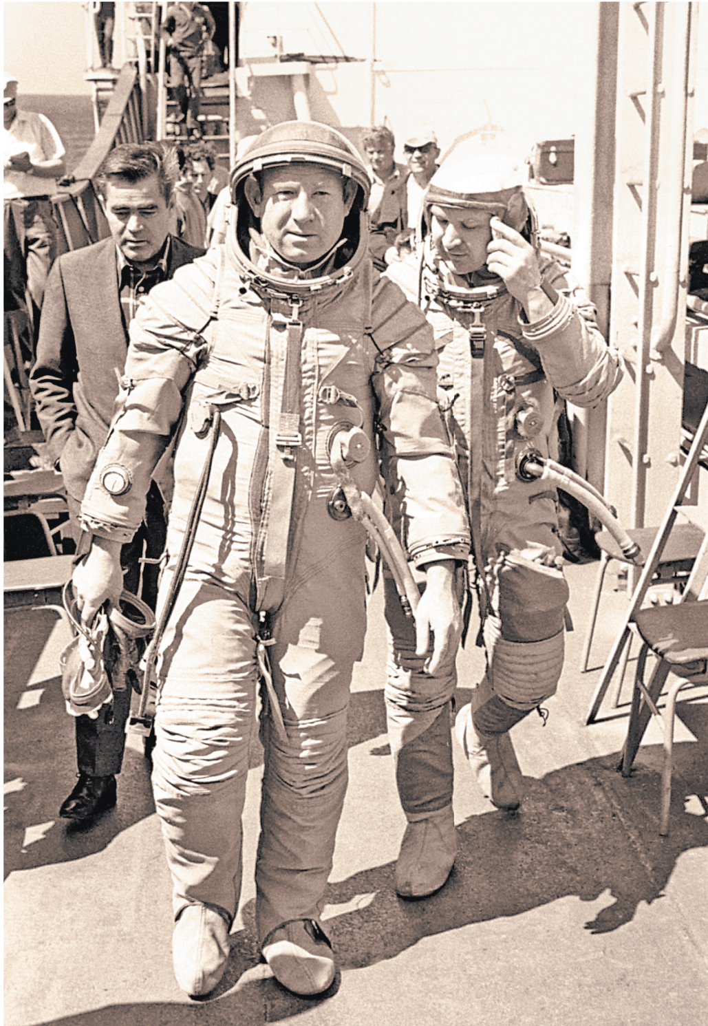
АЛЕКСЕЙ ЛЕОНОВ.

— Но из практики полетов авиации и мне, и Тому Стаффордлу, командиру «Аполлона», было ясно: такое расстояние неприемлемо из-за повышенного расхода топлива, — делился с корреспондентом «РГ» Алексей