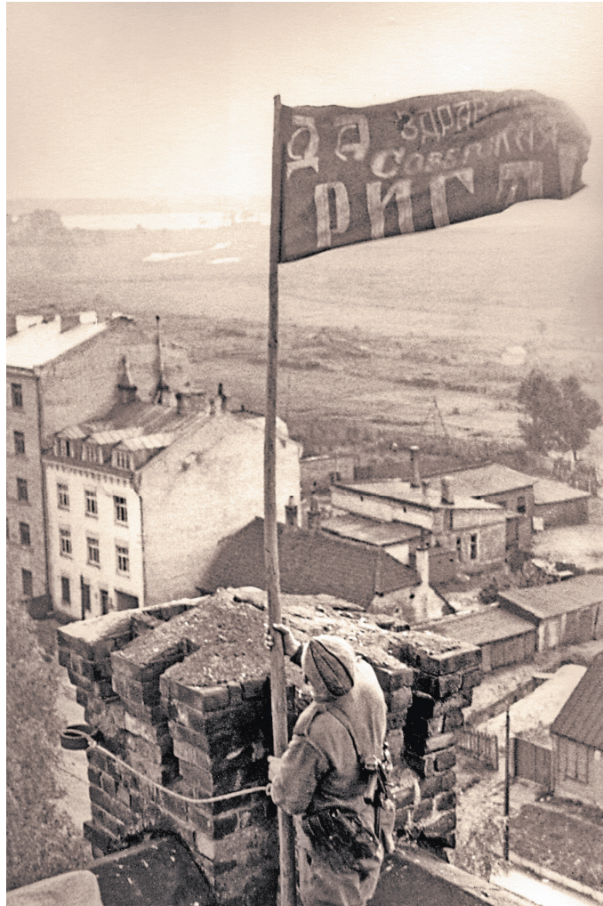
МОЛНИЯ ВЕТРОВ / ФОТОГРАФИКА.ТАС

На фотосхеме аэродрома латвийской столицы, датированной 1 августа 1944 года, изображены более ста боевых самолетов люфтваффе. Этот мощный оборонительный кулак не помог немцам удержать город. Уже после взятия его начальнику Главного политуправления Красной армии докладывали, что первыми в