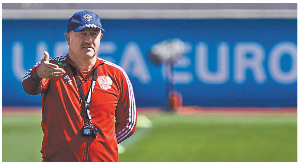
С приходом в сборную России Станислава Черчесова у нашей команды появился свой неповторимый стиль.

16 ноября: Кипр — Шотландия, Россия — Бельгия, Сан-Марино — Казахстан. 19 ноября: Бельгия — Кипр, Сан-Марино — Россия, Шотландия — Казахстан.