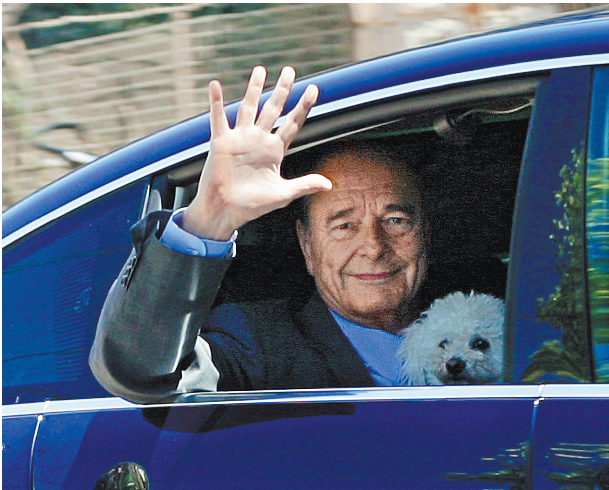
Вячеслав Прокофьев, «Российская газета», Париж

В полдень Агентство Франс Пресс принесло трагическую весть: на 87-ю годовщину жизни скончался экс-президент Франции Жак Ширак. «Он у нас сегодня утром в окружении близких. Спокойно», — такие слова Фредерика Сала-Бару, зятя Ширака, мужа его дочери Клод, привело агентство.