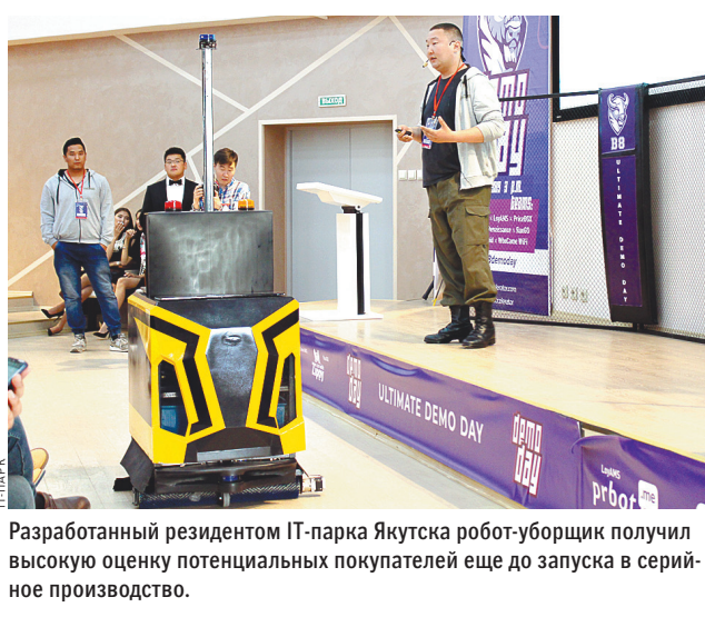
Разработанный резидентом IT-парка Якутка робот-уборщик получил высокую оценку потенциальных покупателей еще до запуска в серийное производство.