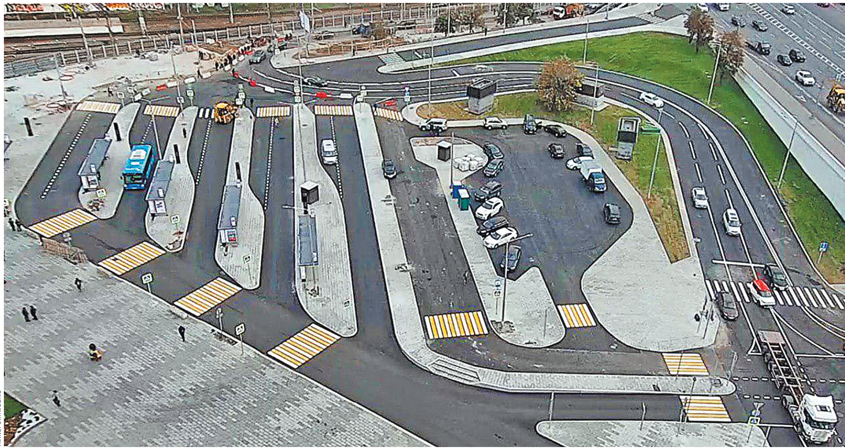
В ЦОДД убеждены: именно такая конфигурация движения у вокзала позволит обеспечить нормальное движение автобусов и личного транспорта.