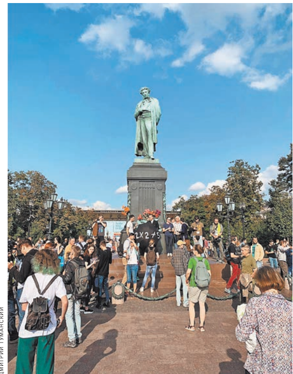
На Пушкинской площади немногочисленные участники шествия откровенно маялись без дела.

У власти имеется не только законное, но и моральное право не поддаваться на давление улицы, на шантаж