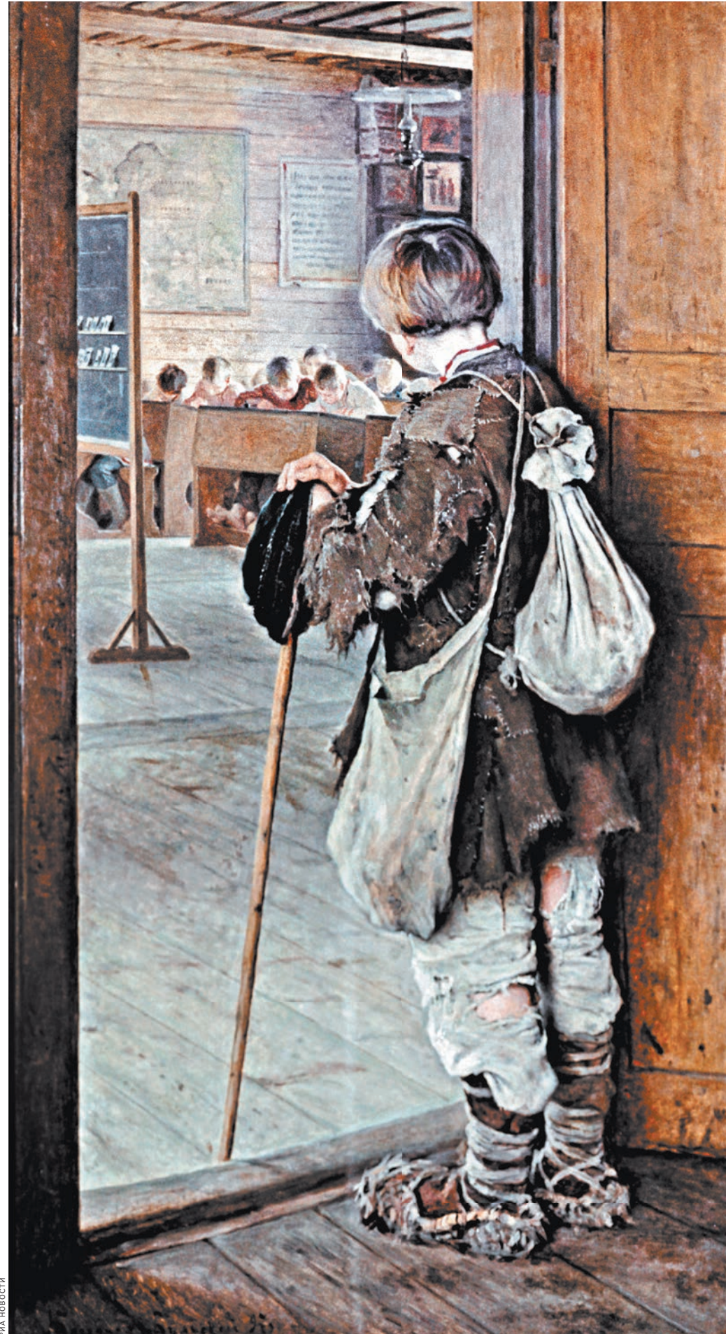
Н. Богданов-Бельский. У дверей школы. 1897 год.

грацией, ароматом хорошей крепкой старой семьи, съютившейся в помещичьем доме, осененном старыми липами. Чем-то Тургеневским вест от самого звука ее голоса. Мила до трогательности.