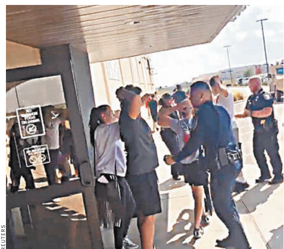
Полицейские американского города Одесса эвакуируют и проверяют посетителей местного киноцентра после стрельбы.

Техас известен почти полным отсутствием ограничений на продажу оружия и является олицетворением американской «культуры Кольта». В этом штате даже не нужна лицензия, чтобы открыто носить винтовку. Неудивительно, что местный губернатор Грег Эббот, являющийся открытым сторонником оружейного лобби, лишь выразил соболезнования жертвам трагедии. Напротив, с 1 сентября в Техасе вступили в силу несколько новых законов, смягчающих ограничения на оборот оружия. Например, один из документов запрещает собственникам жилья включать в договор аренды положения, которые ограничивали бы съемщика или его гостей в праве хранить огнестрел. Другой закон запрещает школам устанавливать правила касательно того, в каком виде можно оставлять оружие в машине на парковке учебного заведения.