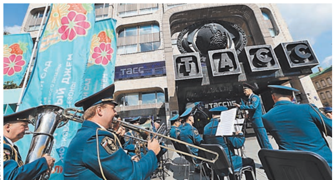
У входа в ТАСС играл духовой оркестр.

Гости смогли пройтись по этажам знаменитого дома с окнами-телеэкранами, осмотреть оборудование, на котором тасовцы работали в прошлом веке. Многие аппараты до сих пор исправны, по случаю юбилея их показали в действии.