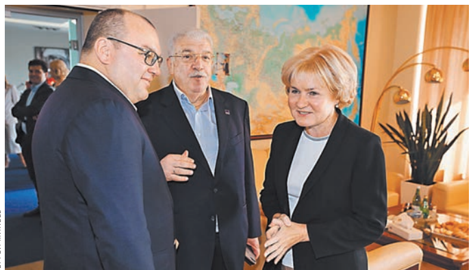
Поздравить коллектив агентства приехала вице-премьер Ольга Голодец.