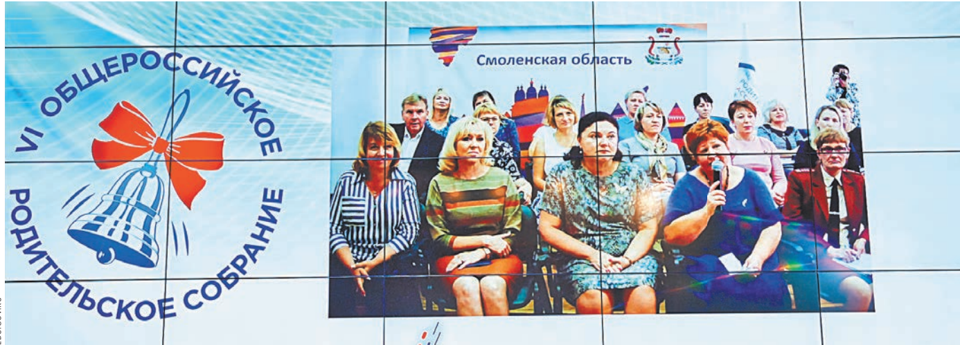
Прямую трансляцию с Общероссийского родительского собрания смотрели 370 тысяч человек.

Что касается учебников, то министерство просвещения ведет активную работу по их сокращению. По сути, это борьба с наследием девяностых, когда учебники издавались практически бесконтрольно. Теперь, говорит министр просвещения, эта «вакханалия» прекратится. — У нас сегодня только по физике 22 линейки учебников, по биологии — двенадцать! Зачем, никто не знает, — прокомментиро-