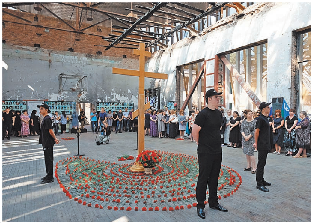
Родственники погибших детей и спецназовцев собрались в спортивном зале школы, чтобы почтить память своих родных.

Анна Юркова, «Российская газета», Беслан