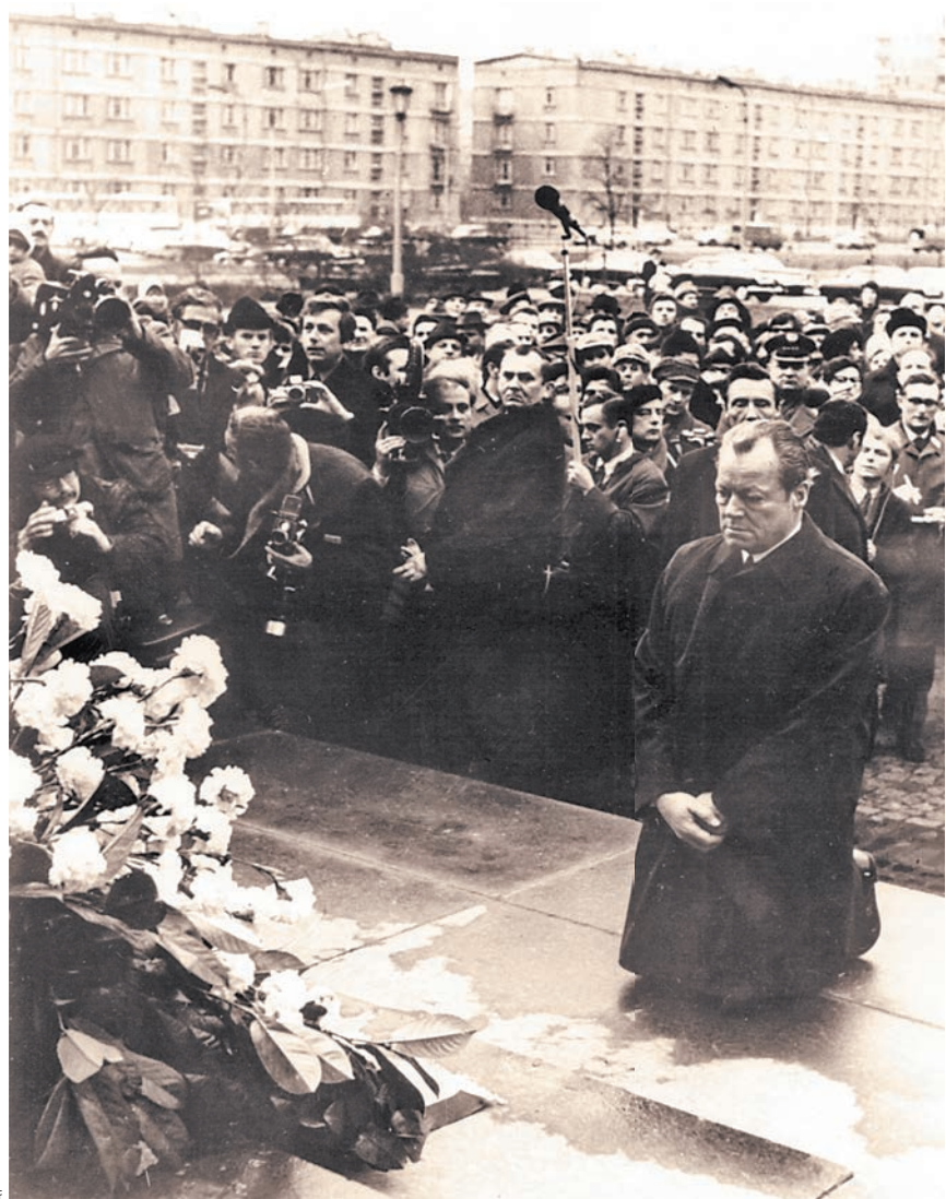
В 1970 году канцлер ФРГ Вилли Брандт встал на колени перед памятником героям Варшавского гетто. Первого сентября 2019 года президент Германии Франк-Вальтер Штайнмайер вслед за Брандтом, может не так внешне прочувственно, тем не менее, заявил, что «кланяется жертвам нападения на польский город Вельонь».

Первого сентября в польском городе Вельонь начались мероприятия по случаю официального начала Второй мировой войны. Хотя Польша была не первой и не последней жертвой нацистского режима, а страну впоследствии освободила Красная армия, траурная церемония превратилась в отвратительное пиар-шоу, устроенное правящей партией «Право и справедливость» ради повышения рейтинга на предстоящих выборах.