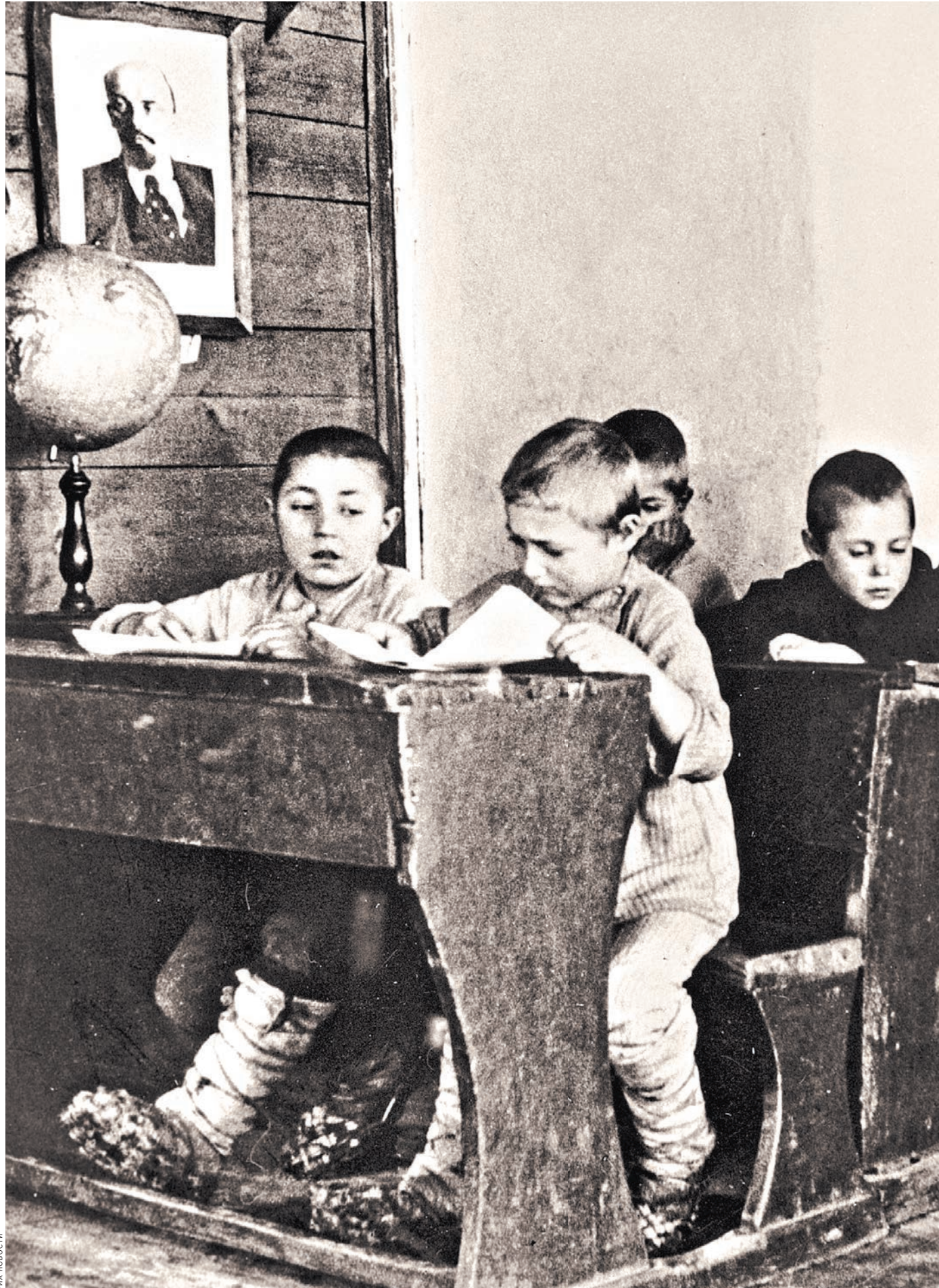
Ну дай списать! 1940.