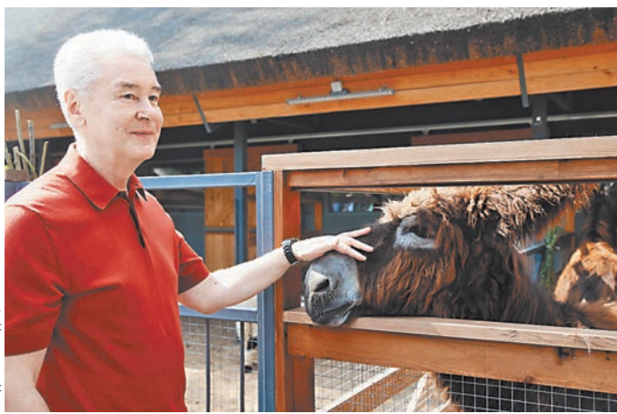
Сергей Собянин стал одним из первых гостей обновленного зоосада.

После обновления коллекция зоопарка насчитывает более 200 экземпляров животных. Помимо распространенных домашних кур, петухов, коров, кроликов и других, теперь здесь можно увидеть ред-