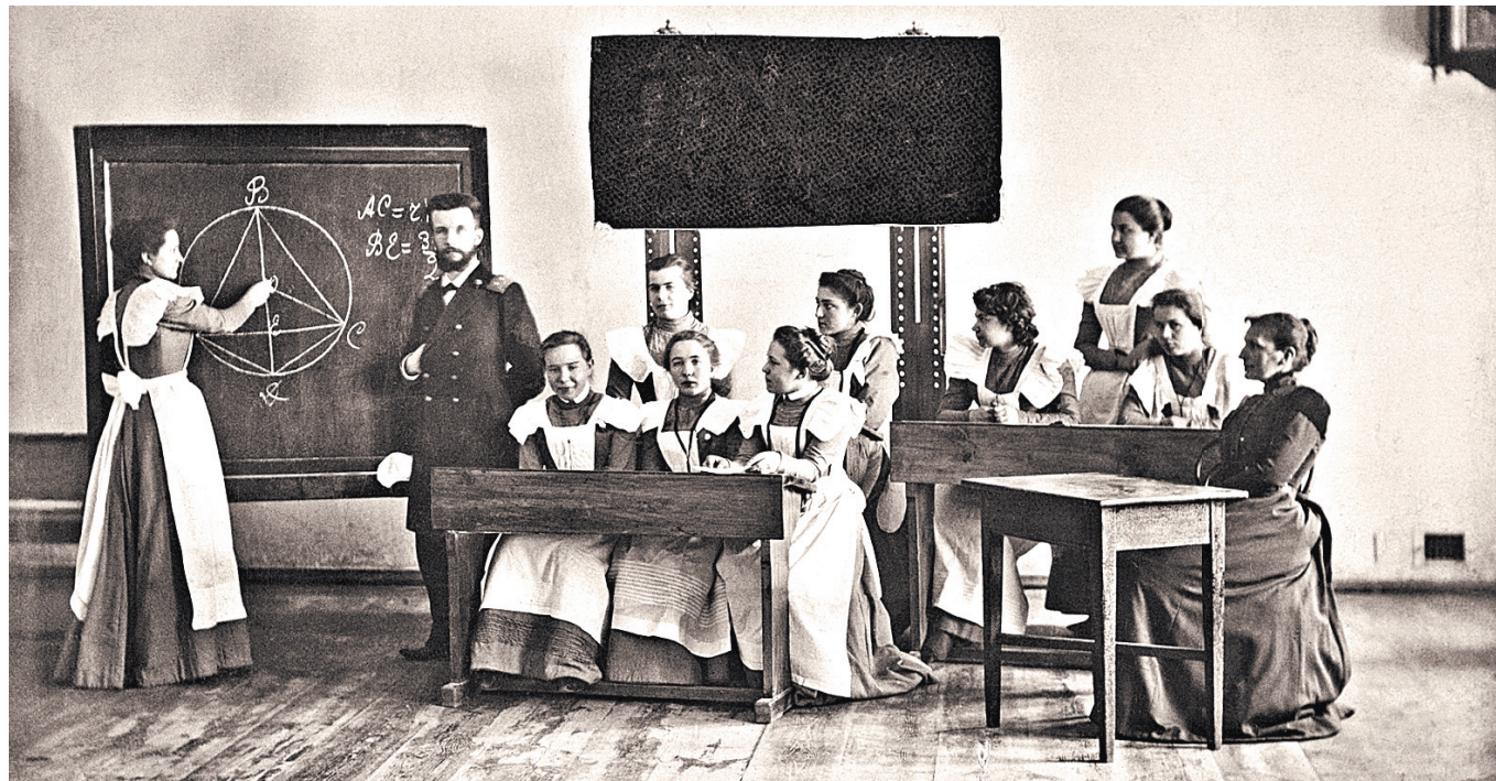
Учительские курсы в дореволюционной России.

— Значит, теперь уроки истории будут в саду! Ура! Ура! — кричат мальчики. ●