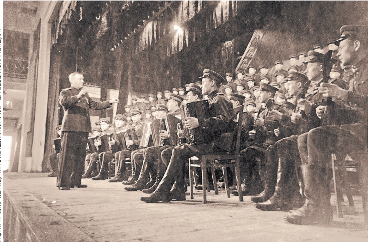
Одна из первых репетиций гимна Ансамблем Советской армии под руководством А. В. Александрова. В составе хора почти 120 артистов. Москва.

— Фото и видео смотрите на сайте rg.ru/sujet/1560