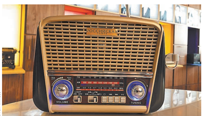
Подарок «Российской газеты». Из радиоприемника голос легендарного диктора Юрия Левитана: «Передаем сообщение ТАСС...»