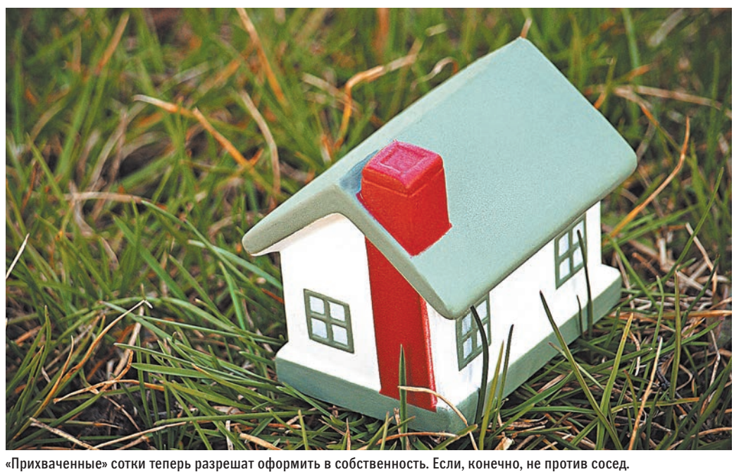
«Прихваченные» сотки теперь разрешат оформить в собственность. Если, конечно, не против сосед.

Также определяются особенности проведения комплексных кадастровых работ для земельных участков, занятых объектами (территориями) общего пользования, расположенных в границах садовых участков, огороднических и лесных участков. Интересно, что теперь кадастрового инженера можно будет оформить в штат, но только если компания необходимо проведет кадастровые работы для собственных нужд. ●