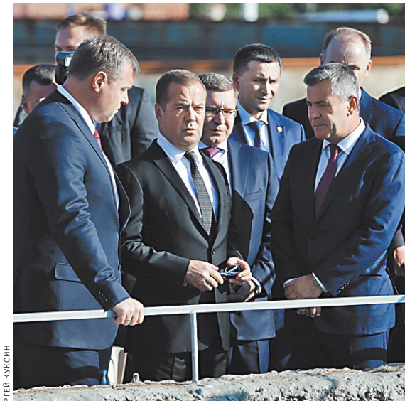
Чистые сооружения в городах вдоль всего течения Волги нуждаются в модернизации, согласен Дмитрий Медведев.

Выслушав губернаторов, Дмитрий Медведев пообещал войти в положение руководителей регионов, но только в текущем году. Глава кабинета предупредил, что