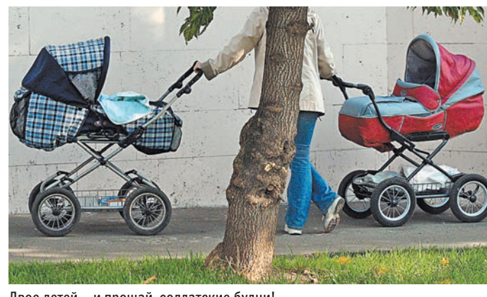
Двое детей — и прощай, солдатские будни!

Всего в федеральном законе перечислено шесть оснований, по которым солдата срочной службы могут досрочно уволить.