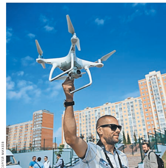
Купил беспилотник? Будь добр, поставь его на учет и сообщи Росавиации сведения о себе.

При этом вместе с ужесточением правил учета беспилотников упростили порядок их использования. «Скорее вступят в силу изменения в федеральные правила использования воздушного пространства. Можно будет летать без получения разрешения на высоте до 150 метров в пределах видимости, кроме зон ограничения», — говорит эксперт. ●