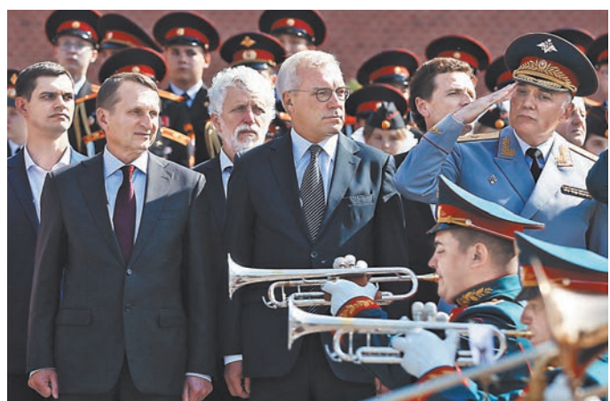
Директор Службы внешней разведки РФ Сергей Нарышкин и замминистра иностранных дел России Александр Грушко (в центре) на церемонии в столице Словении.

Вечный огонь зажегся в столице Словении, у памятника Сынам России и Советского Союза, погибшим во время Первой и Второй мировых войн. Частицу пламени, взятого у огня, горящего на Могилах Неизвестного Солдата у кремлевской стены, привезли спецборт министрства обороны из Москвы в специальной лампаде. Как отметил глава российской делегации, заместитель предсе-