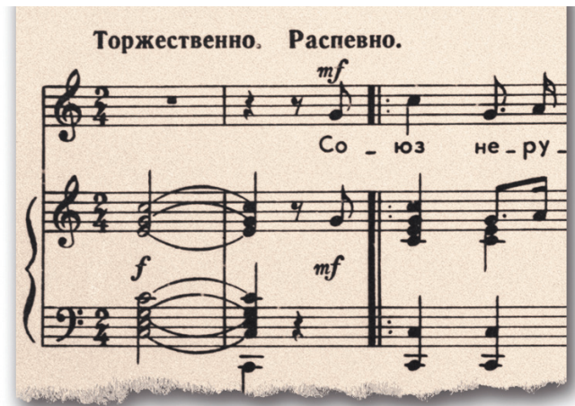
Это первая страница нот гимна. Автор музыки — А. В. Александров.

В нашем архиве, например, хранится семь вариантов текста гимна Михалкова и Эль-Регистана с правками красным карандашом, которые внесены Сталиным, синим карандашом написана окончательная редакция, принятая Сталиным, Молотовым и Ворошиловым.