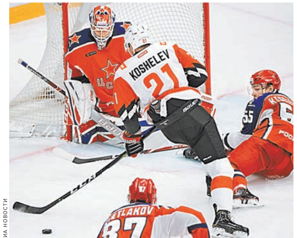
Столичным армейцам не стоит особо переживать по поводу поражения — впереди еще очень длинный регулярный сезон.

ЦСКА стараясь отыграться, но смята голову вперед не побежал. А в позиционной игре «ястребы» спокойно убивали время. В концовке «красно-синие» заменили голкипера на шестого полевого, но в итоге пропустили еще и в пустые ворота. Коди Франсон оформил дубль и принес «Авангарду» победу — 3:1. Помимо двух очков в таблицу, «ястребы» получили еще и Кубок Открытия. По традиции прикасаются к трофею его новые обладатели не стали — считается, что трогать нужно только главный приз, а до него дорога еще длинная и у «Авангарда», и у всех остальных. ●