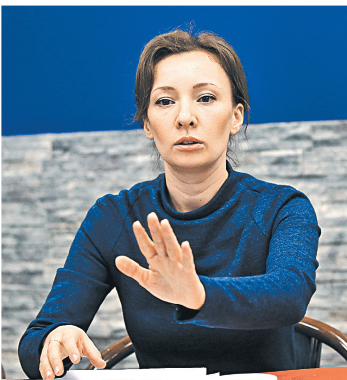
Анна Кузнецова: Мы научились оценивать знания детей, пора обратить внимание на их воспитание.

детей. Одними запретами и блокировками проблему не решить, нам остро необходимо позитивное интернет-пространство для детей, — заключила она. Напомнила Анна Кузнецова о проблеме кадров — в школах не хватает профессиональных психологов и воспитателей (по статистике, сегодня на одного психолога приходится в среднем 2000 детей). Большие вопросы и к профессионализму се-