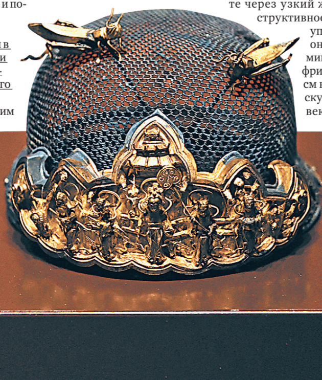
Уникальные вещи одной из самых ярких эпох в истории Китая можно увидеть в выставочных залах Успенской звонницы и Патриаршего двора.