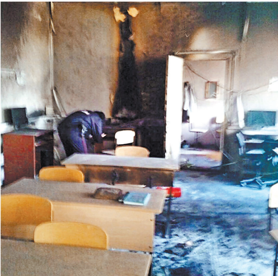
В соцсетях школьник писал, что ненавидит общество и ждет не дожидается того дня, когда начнет стрельбу.

Фото и видео с места ЧП смотрите на сайте rg.ru/art/1533800