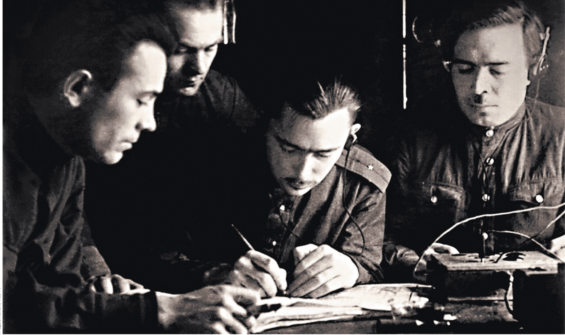
И. С. АБАКУМОВ / ФЕДОРОВ

Захваченные у вражеских агентов радиостанции использовались в радиотравах, с помощью которых военным чекистам удалось перехватить каналы связи абвера с агентурой, вывести на советскую территорию ряд немецких шпионов и диверсантов, внедрить своих агентов в разведпарлат противника, организовать систематическую поставку дезинформа-