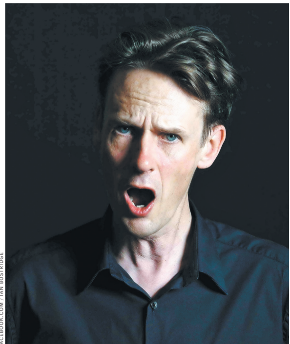
Иэн Бостридж неоднократно бывал в Москве и Петербурге, и каждый его визит становится художественным событием.