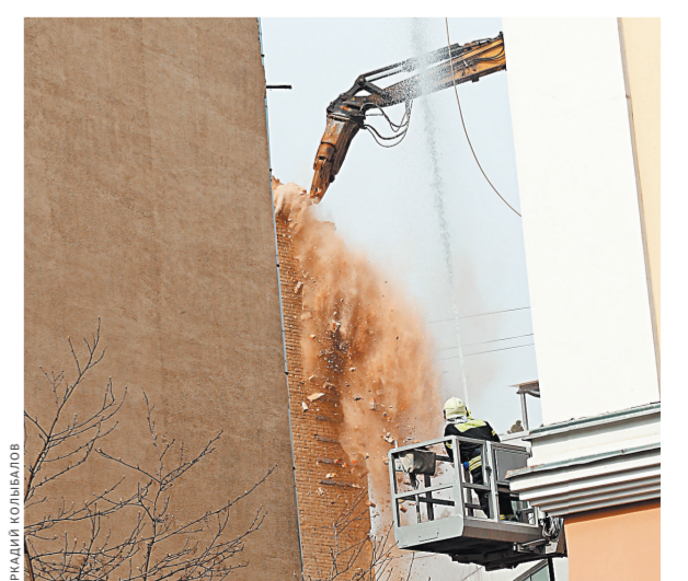
Демонтирована уже примерно треть аварийного дома, а полностью снос может занять 10 дней.

Почему дом начал рушиться, специалисты поняли быстро. По словам Бирюкова, при реконструкции были грубо нарушены требования к строительным работам. Подрачники вывели значительный объем грунта, и старые несущие стены не выдержали. В первую же ночь после обрушения коммунальщики влили в фундамент 850 кубометров бетона. Но это спасло только от мгновенного разрушения: эксперты прогнозируют, что долго здание не простоит. Поэтому решено снести все шесть этажей, заявил Бирюков. Дом в Пушкинском переулке — это гостиница, возведенная в 1913 году по проекту известного архитектора Ольгерада Пиотровича. Дом хоть и старинный, но статуса памятника не носит, расказала «РГ» в департаменте культурного наследия столицы.