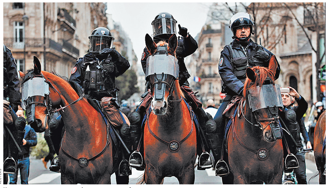
К разгону демонстрантов во Франции помимо бронетранспортеров власти привлекли и конную полицию.

Единственным лидером, обратившим внимание на беспрецедентную жестокость французской полиции в отношении людей, недолговым режимом Макрона, стал турецкий президент Реджеп Тайип Эрдоган. «Некоторые обвинения нашу полицию в применении чрезмерной силы. Но посмотрите, как обращаются с людьми их (французская. — Ред.) полиция. Наша полиция действует гуманно», — прокомментировал он события в Пятой республике. А что думает о возвращении на французские улицы «цветной революции» американский президент Дональд Трамп?