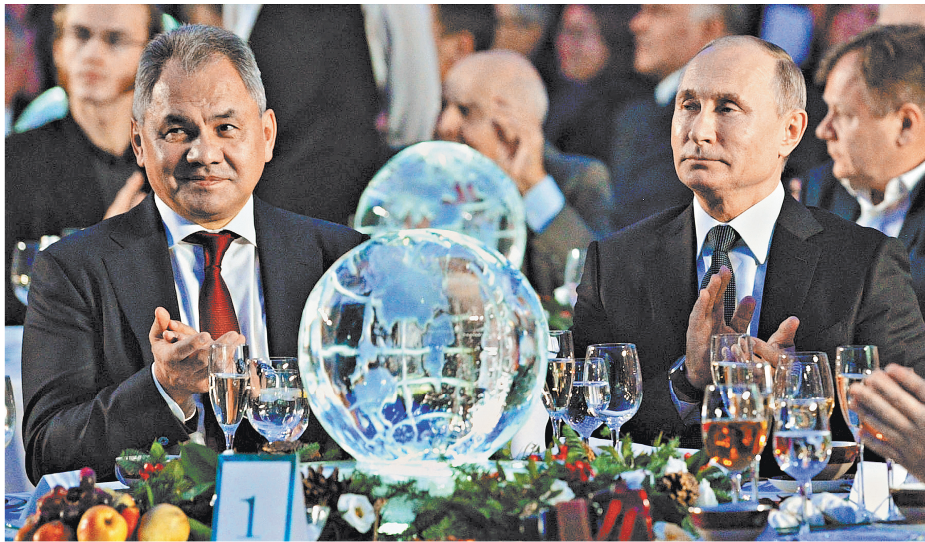
Владимир Путин и Сергей Шойгу во время церемонии награждения Премией Русского географического общества.