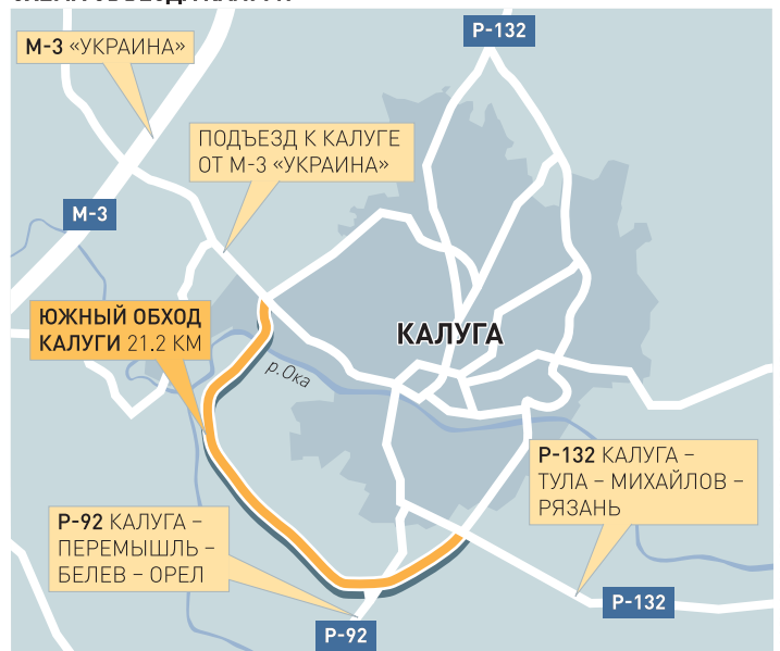
СХЕМА ОБЪЕЗДА КАЛУГИ

Росавтодор последовательно реализует политику господдержки дорожного хозяйства регионов. Так, в прошлом году размер федеральной помощи субъектам превысил объемы финансирования строительства федеральных трасс. В этом году, учитывая все целевые программы, общий объем трансфертов регионам составляет почти 136 миллиардов рублей.