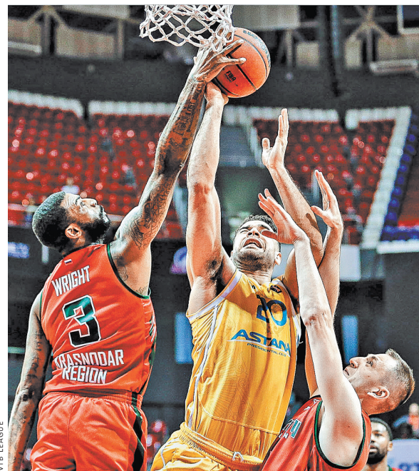
«Астана» нокаутировала кубанцев в заключительной четверти.

К этому туру без поражений в восьми проведенных матчах подошли «Химки» и ЦСКА. Результат вчерашнего вечернего матча в Польше между БК «Зелена-Гура» и подмосковной командой стал известен уже после подписания этого номера «РГ». Армейцы сегодня принимают красноярский «Енисей». За двумя лидерами в таблице очень плотное и запутанное положение у клубов, пока занимающих места с третьего по седьмое: УНИКС — 7 побед — 1 поражение, «Астана», «Зенит» — по 5-3, «Локомотив-Кубань» — 5-4, «Калев» — 4-5. ●