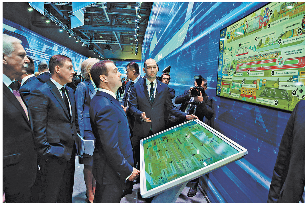
Лидер партии Дмитрий Медведев в кулуарах съезда.

В каждом отдельном случае разбирается комиссия специально сформированная комиссия по этике. В нее — по образцу суда присяжных — включили 12 человек,