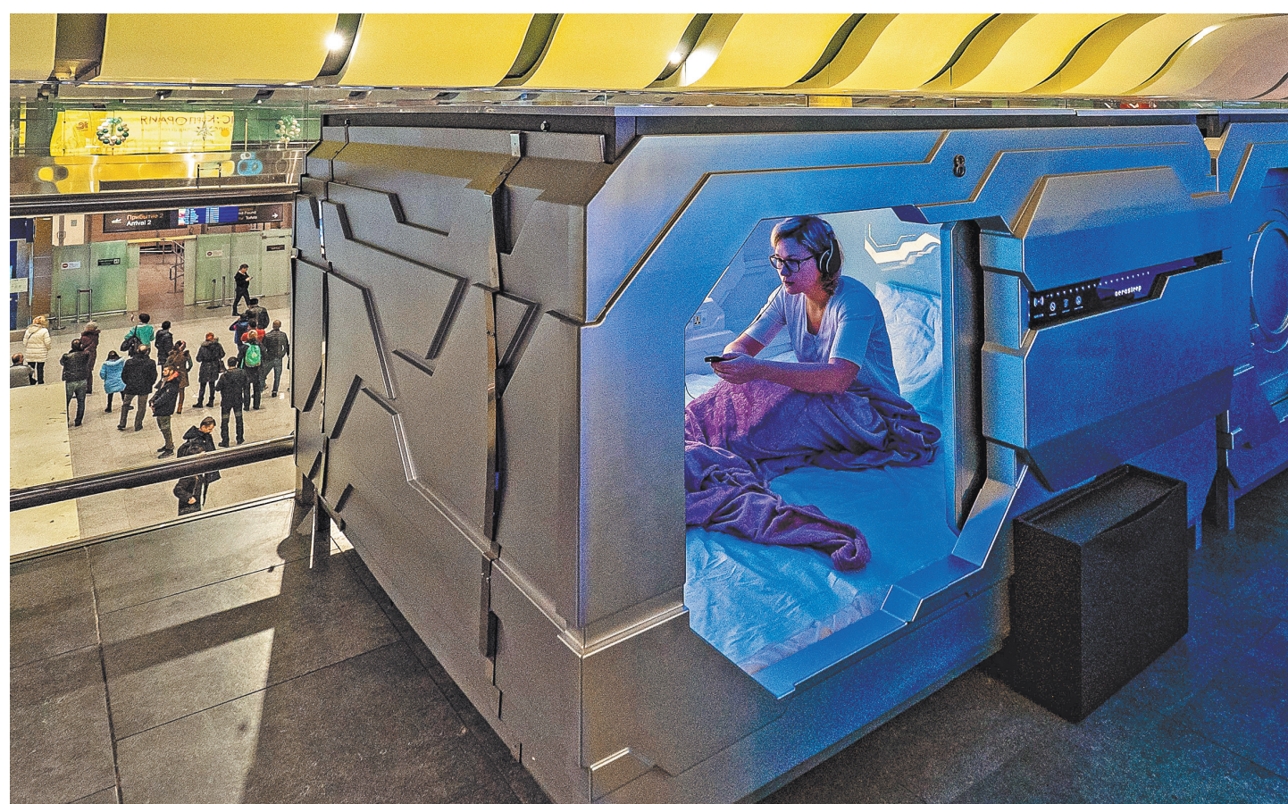
Долгое ожидание между стыковочными рейсами в аэропорту Пулково теперь станет комфортнее. В общей зоне пассажирского терминала открылся капсульный отель Aeroleep. Выглядит он, мягко говоря, непривычно — два ряда невысоких кабинок с дизайном, вызывающим ассоциации с космическими кораблями из фантастических фильмов. Площадь каждой капсулы — всего четыре квадратных метра. Есть откидной столик, большое зеркало, телевизор, беспроводный Wi-Fi, USB-порт, розетка для зарядки гаджетов и часы-будильник. Но главное — комфортное спальное место с одеялом, подушками и одноразовым постельным бельем. То есть то, чего так не хватает пассажирам, которые вынуждены провести в аэропорту несколько часов из-за длительной стыковки или задержки рейса.

м) абзац девятнадцатый дополнить словами «места для стоянки транспортных средств (парковки) и велосипедные полосы»;