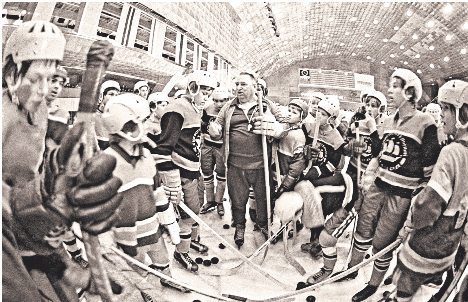
Тарасов привил нескольким поколениям наших хоккеистов, что нет никакого другого места, кроме первого.