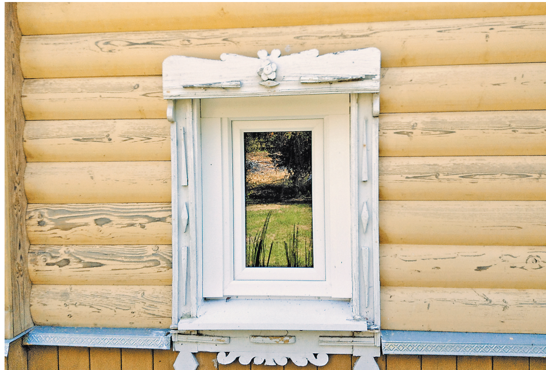
Крестьянский дом, построенный до Первой мировой войны, ей пришлось обновлять на Солженицынскую премию.