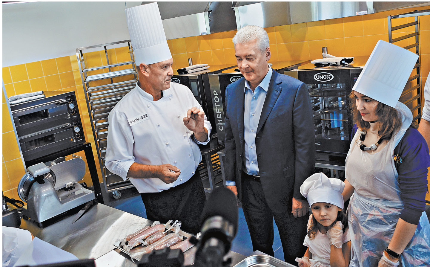
Павильоны «Технограда», как убедился Сергей Собянин, оснащены всем необходимым для получения новых и нужных городу профессий.

Вчера за парты сели более 105 тысяч московских первоклашек. Всего же в школы, детсады и колледжи столицы пошли около полтора миллиона учащихся.