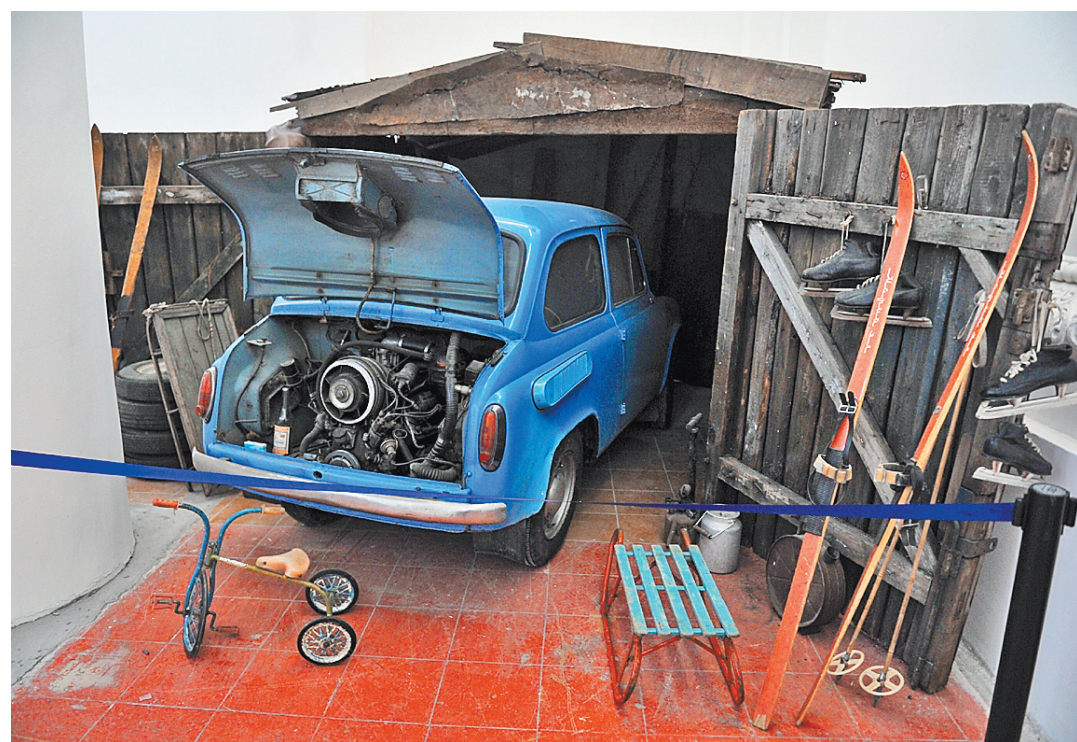
Договор о передаче на хранение любого транспортного средства можно скрепить простым рукопожатием.