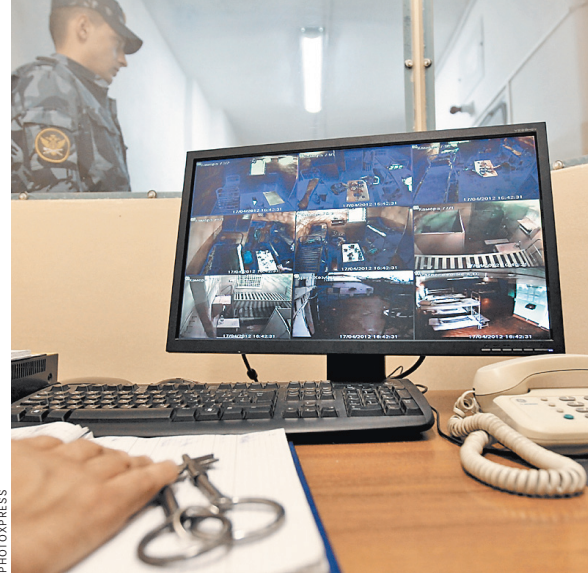
PHOTOGRAPHS Записи о применении силы и специальных средств в учреждениях ФСИН будут храниться вечно.

Все еще будет досконально проверяться. По словам заместителя главы ведомства, в распоряжении директора ФСИН, изданном после этой громкой истории, содержится целый комплекс мер, направленных на то, чтобы искоренить факты превышения полномочий сотрудниками в работе с наиболее сложными осужденными, которые за нарушения режима попадают в ШИЗО (штрафные изоляторы), помещения камерного типа и т.д.