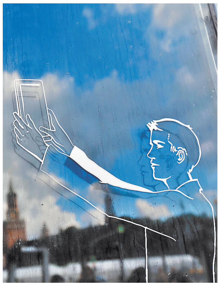
У людей, которые не контролируют экранное время, появится помощник.