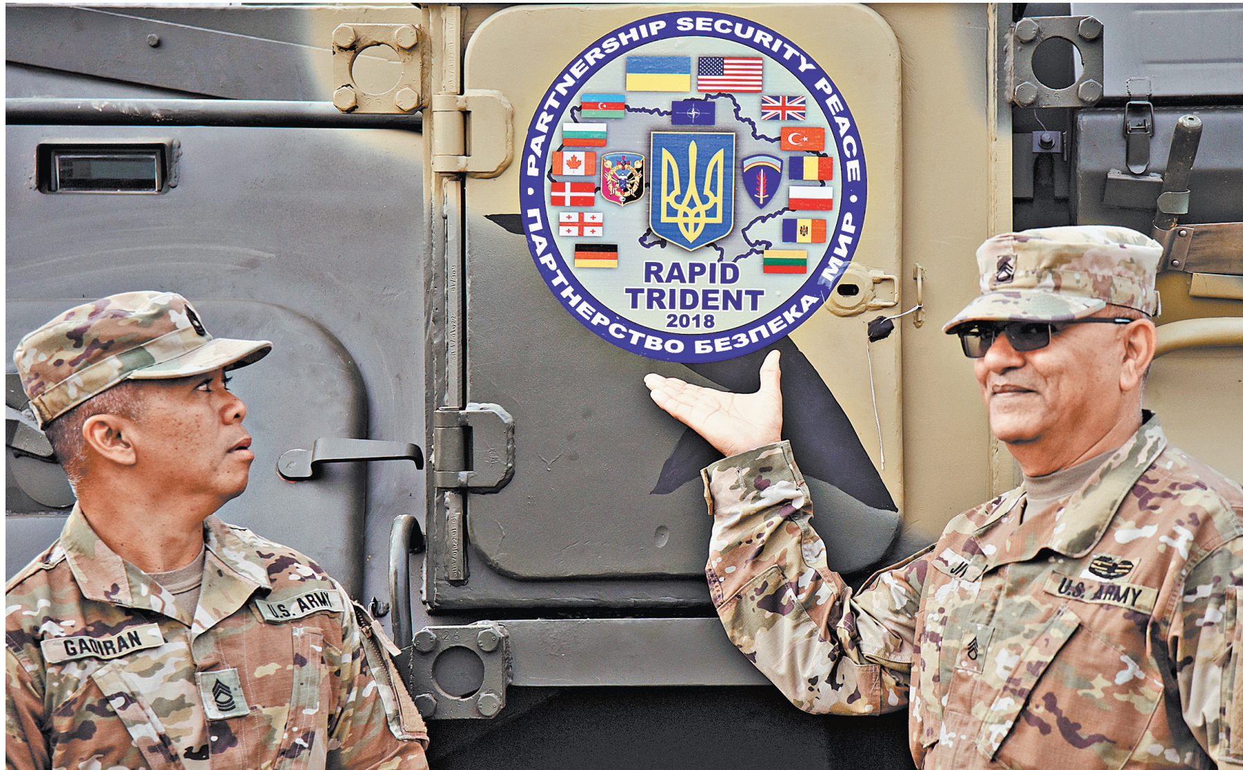
Военные США демонстрируют эмблему учений Rapid Trident на полигоне в Львовской области.

По сведениям пресс-службы Вооруженных сил Донецкой республики, после гибели от рук украинских террористов руководителя ДНР Александра За-