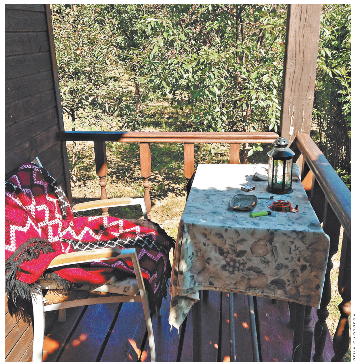
Стол на крыльце «Папского» домика, построенного на Ватиканскую пре- мию «Христианские корни Европы», лауреатом которой стала Ольга Седакова. За ним написаны практически все стихи поэта.