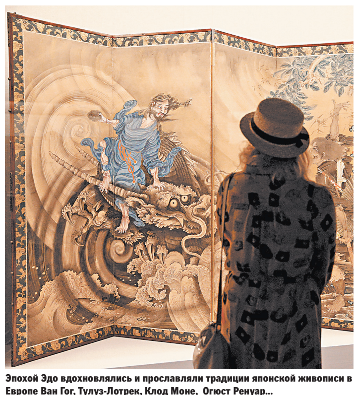
Эпохой Эдо вдохновлялись и прославляли традиции японской живописи в Европе Ван Гог, Тулуз-Лотрек, Клод Моне, Огюст Ренуар...