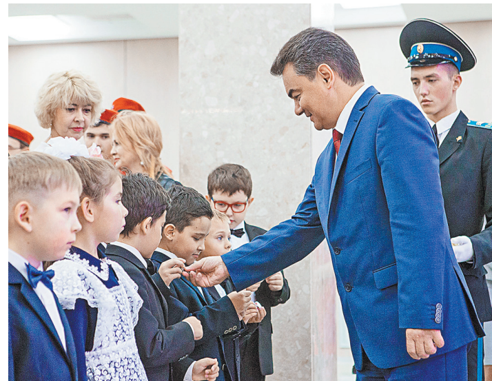
Мэр никогда не экономил на строительстве новых школ и развитии социальной сферы.

И третье — концепция «умного города». Хочу напомнить, что у нас создан и успешно работает