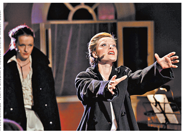
Театр музыки и поэзии сыграет «Капли Датского короля» на Новой сцене Академического театра им. Вахтангова.