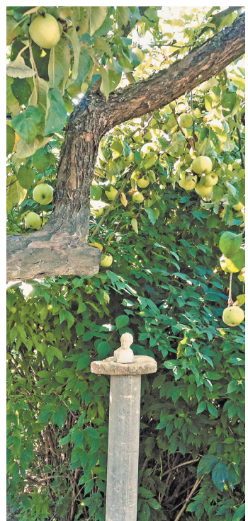
«Уголок Гете» в саду: его бюст весной — под яблоней, летом — под яблоней.

В полученной мной в подарок любимой книге о Рембранде «Путешествие с закрытыми гла- зами» есть удивительное рассу- ждение о том, что мы видим мир зрением, уже повенчанным со словами, а важно видеть мир пер- выми, до-словным взглядом... Азаровка возвращает такое зре- ние: «Я же молчу, исчезаю в уме из любимого взгляда...»