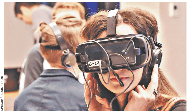
Особенно часто VR используется для демонстрации отделки квартиры.