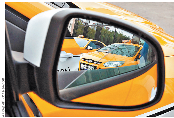
На подачу такси в центре города сегодня требуется три минуты, за пределами Садового кольца — не больше пяти.