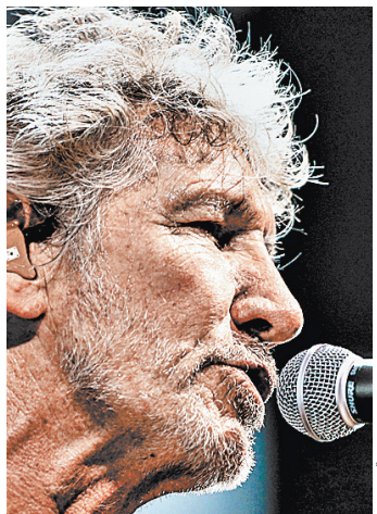
Роджер Уотерс на своих концертах — не только музыкант, но и актер.

Также, как и те 25 тысяч зрителей, которые собрались в этот вечер в «Олимпийском». Лишь билетеры начинали спрашивать еще у выхода из метро «Проспект Мира». Особым спросом пользовались и флаги. Знаменитый музыкант вышел на сцену как всегда в черных одеждах, с бас-гитарой. Пел, общался со зрителями. А чтобы больше сконцентрироваться на вокале, даже пригласил в тур и дополнительного, второго басиста.