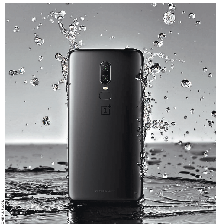
Камера, дисплей и аккумулятор — основные критерии выбора аппарата.