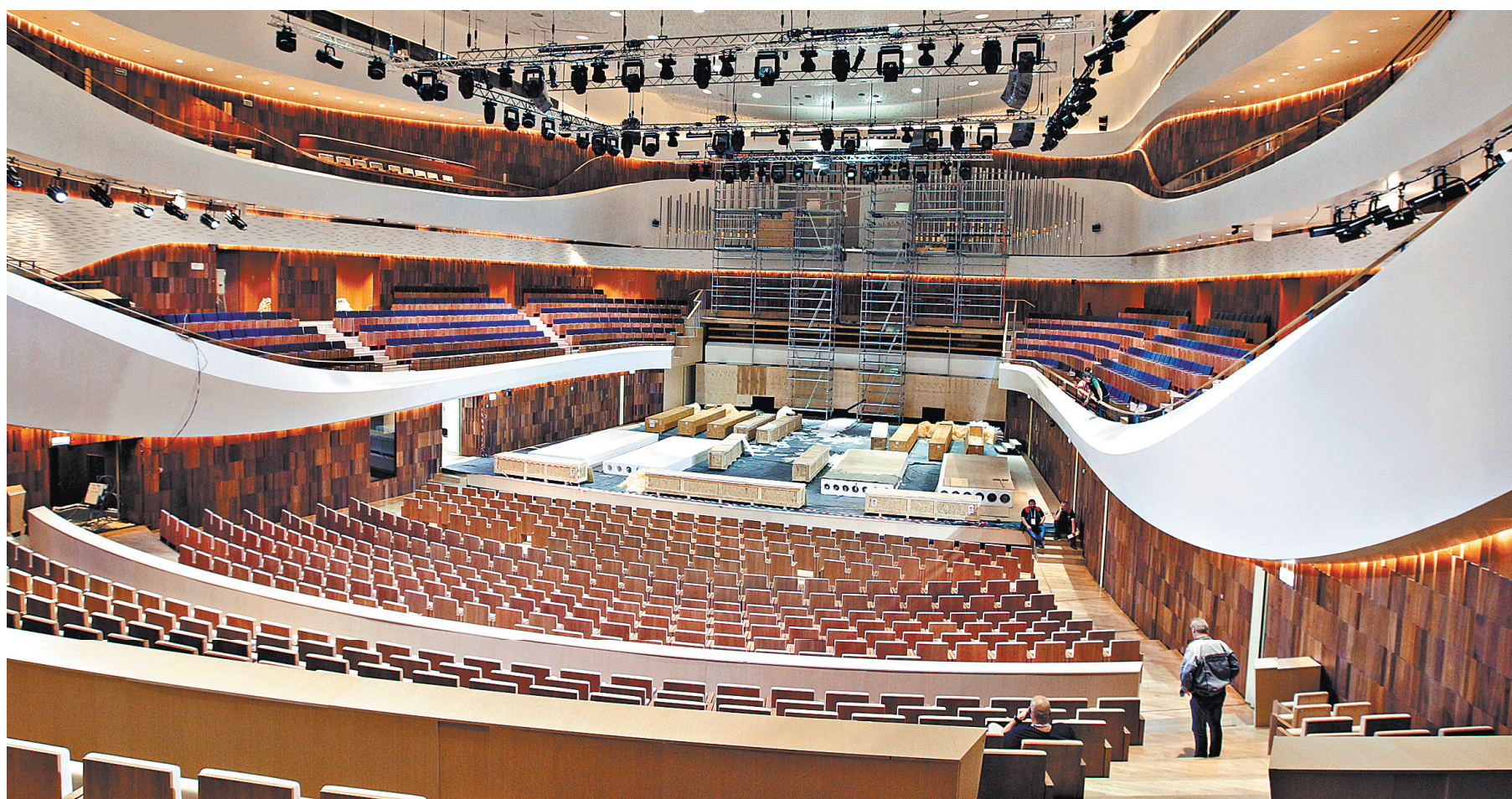
Благодаря уникальной системе трансформации «Зарядье» сможет принимать события разнообразных форматов: от концертов до балов.