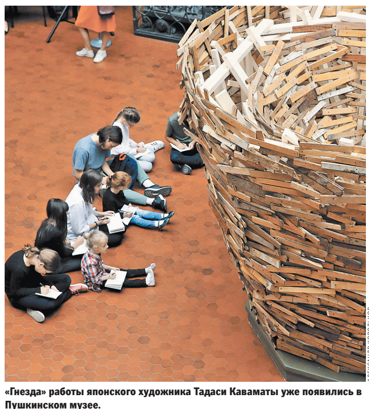
«Гнезда» работы японского художника Тадаси Каваматы уже появились в Пушкинском музее.