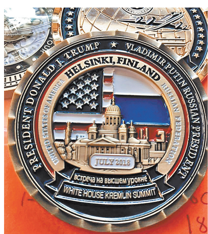
Так выглядит жетон, посвященный встрече Трампа и Путина в Хельсинки.

Жетон о саммите в Хельсинки — часть коллекции из 10 таких изделий под названием «Исторические моменты»