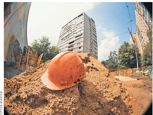
Некрасивые дворы еще долго напоминают стройплощадку, особенно если с них не убрали строительный мусор.

В 2018 году на реализацию проекта по созданию комфортной городской среды было выделено 30 миллиардов рублей. И еще 5 миллиардов на благоустройство малых городов и исторических поселений. В 2017 году работы по благоустройству дворов, парков, скверов, набережных были выполнены в 1653 населенных пунктах.