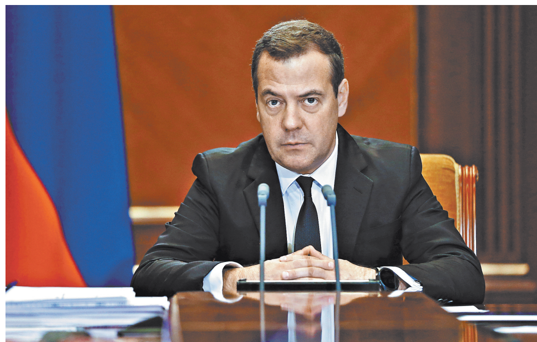
Ситуация, когда дети учатся в три смены, «подлежит абсолютному решению», заявил премьер-министр. Здесь никаких компромиссов быть не может.

Решение суда вступило в законную силу 14 августа 2018 г.