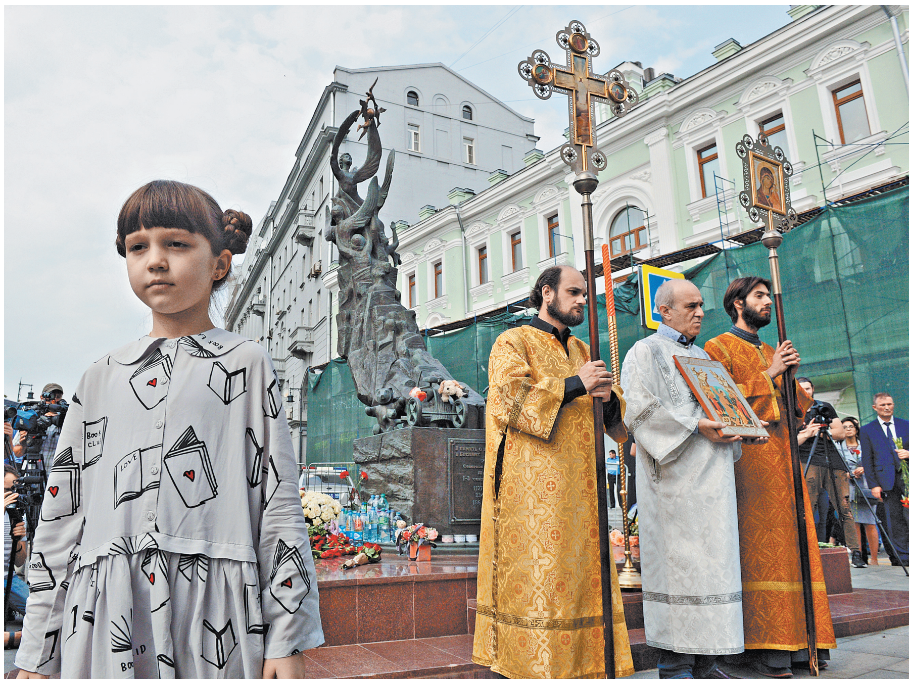
Вчера во многих городах России вспоминали жертв теракта в Беслане. Именно 3 сентября 2004 года в школе небольшого осетинского городка, захваченной боевиками, прогремели взрывы. Всего тогда погибли 334 человека, большинство из них — дети. В Москве памятные мероприятия прошли у памятника «Детям Беслана» на Солнечной, рядом с храмом Рождества Пресвятой Богородицы. Состоялся траурный митинг «Без слов», была прочитана поминальная молитва, в небо выпустили 334 белых воздушных шара.

Напомню, до конца года электробусы планируют выпустить еще на пять маршрутов. До марта 2019-го в город должны быть поставлены 200 машин, а в конце декабря будет объявлен конкурс на поставку еще 100 электробусов. С 2021 года Москва планирует полностью отказаться от закупки дизельных автобусов. За оставшиеся два года столичные власти собираются отработать все необходимые технологические решения.