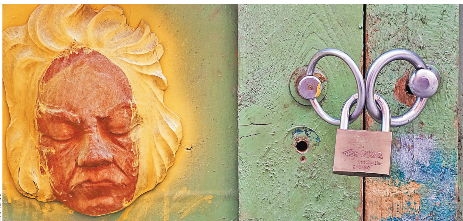
Тайна Венеции — на замке.