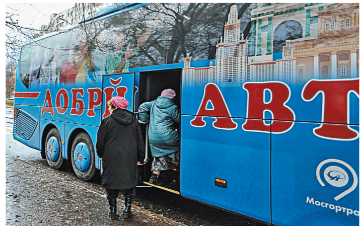
«Добрый автобус» в Москве пока один, желающих попасть на экскурсии — сотни. Всем хочется вспомнить лучшие места своей юности.