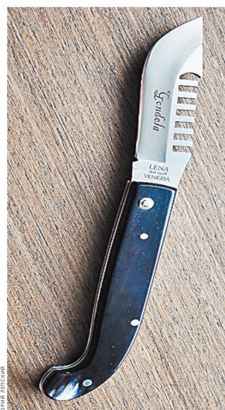
Настоящий нож гондольера.