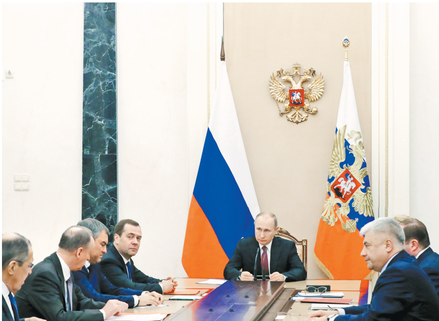
Владимир Путин в пятницу провел совещание с постоянными членами Совета безопасности. Обсуждалась завершающая стадия подготовки к Конгрессу сирийского национального диалога в Сочи. Кроме того, речь шла о ситуации в Африке, и в этом контексте глава государства информировал участников совещания об обсуждении этой темы в телефонном разговоре с президентом Турции Реджепом Тайипом Эрдоганом. Затрагивались также текущие вопросы внутрироссийской социально-экономической повестки дня.

Правоприменительные решения по данному делу в отношении фирмы подлежат рассмотрению.