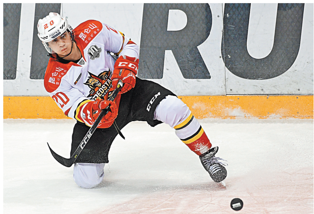
Второй сезон в КХЛ игроки «Куньлуна» (на фото) провели хуже дебютного и остались без плей-офф.

На Востоке все еще сложнее. Здесь спокойно могут готовиться к играм на вылет лишь четыре клуба— «Ак Барс», «Нефтехимик», «Автомобилист» и «Трактор». Математически не решились задачу «Салават Юлаев» и магнитогорский «Металлург», но им достаточно не растерять преимуществ в несколько очков. А вот «Сибирь», «Авангард» и «Амур» идут практически синхронно. У новосибирцев—85 очков, у омичей—84. «Ястребы» выше хабаровчан по дополнительным показателям, и только это позволяет им удерживаться в зоне плей-офф, оставляя за бортом «Амур». Но дальневосточники закончат регулярный сезон двумя матчами с немотивированными соседями из «Адмирала», тогда как «Авангард» и «Сибирь» играть между собой, и кто-то в этой паре очки точно потеряет. Вполне возможно, именно результат этой встречи окажется в итоге ключевым.