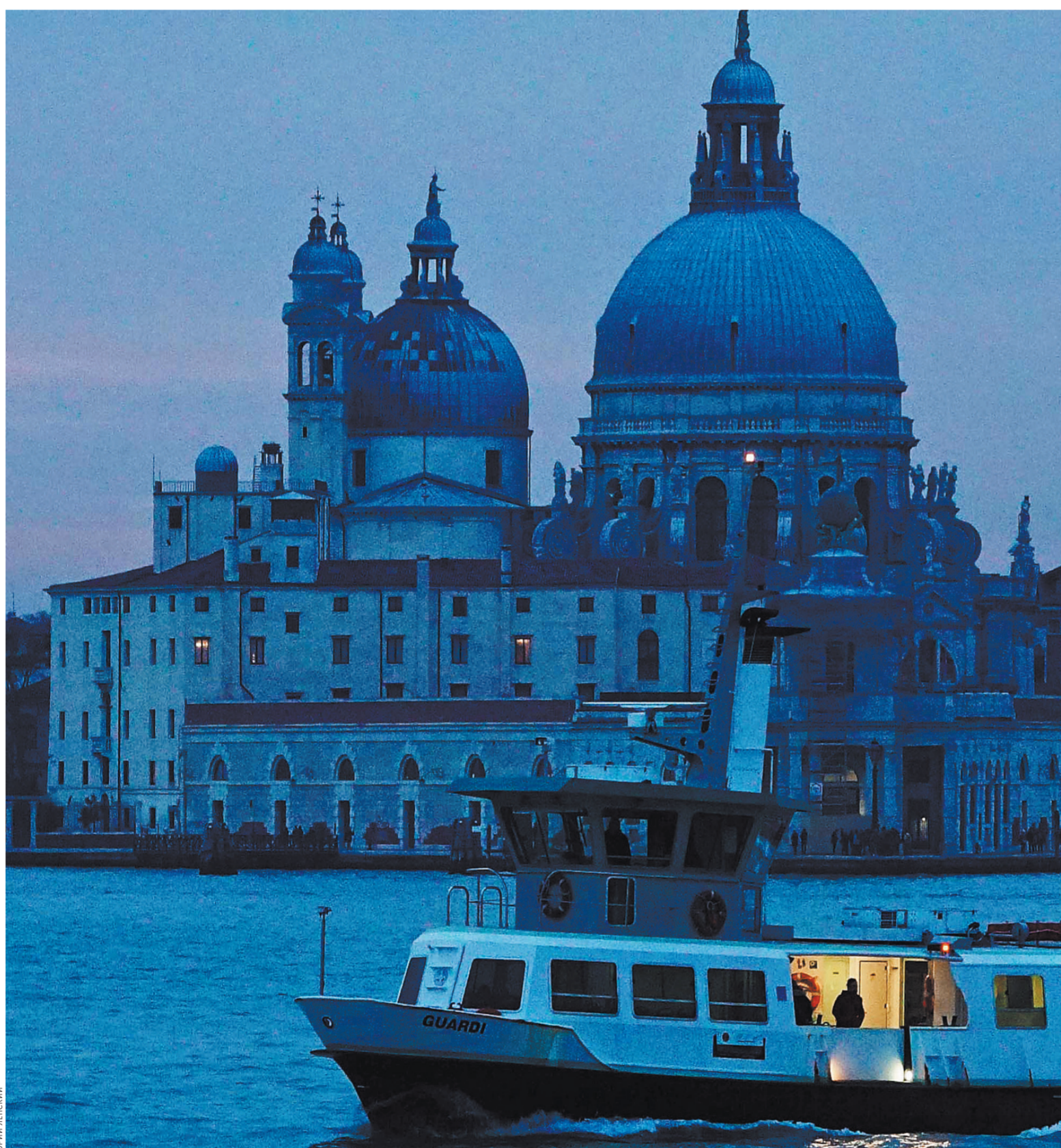
И еще долго этот город будет снится вам.