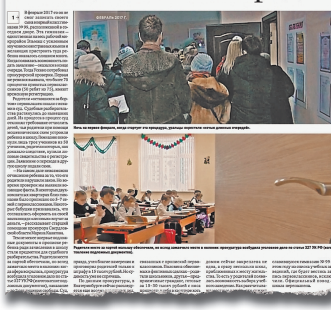
«РГ»: Запись в школу часто сопровождается скандалами и даже судами.