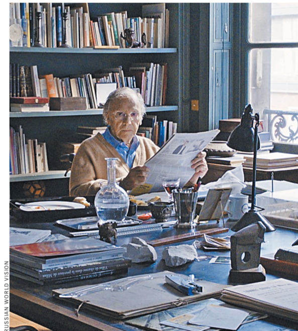
В «Голубином туннеле» Ле Карре предстает самовлюбленным мизантропом.

От книги нечего ждать правдивости. Зачем? Разве это ее цель? Но она увлекательна, а посвящая нам главу «Диккий Восток», показывает, как трогательно не переносит нас Дэвид Корнуэлл, чьи произведения, подписанные Джон Ле Карре, мы издаем бешеными тиражами и так усердно читаем.