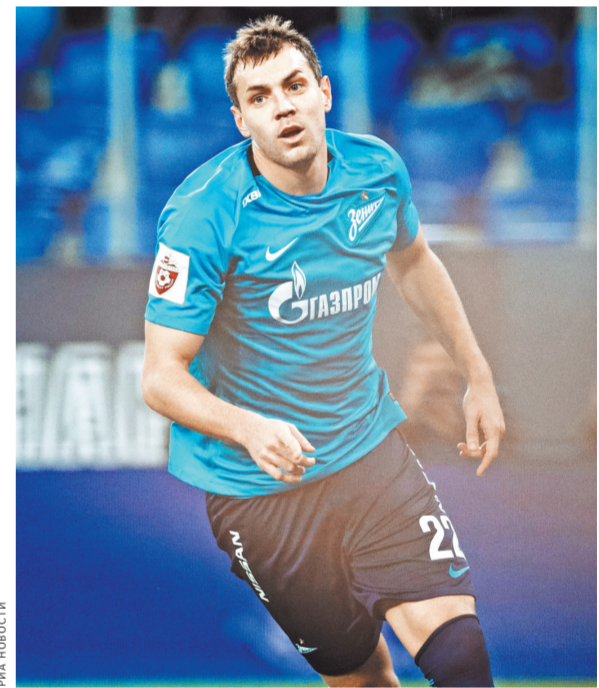
Артем Дзюба лишился места в основе «Зенита» и готов сменить голубую форму на футболку тульского «Арсенала».

Ну а к первому громкому трансферу зимы близок ЦСКА. Москвичи вот-вот вернут Ахмеда Мусу. Напомним, летом 2015 года нигериец сменил армейцев на английский «Лестер». Ожидается, что Муса присоединится к «красно-синим» на правах аренды до конца весны.