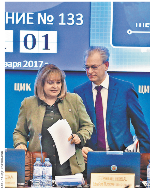
Элла Памфилова уверена, что у КПРФ были время и возможность исправить ситуацию, но коммунисты этого почему-то не сделали.

В итоге тираж информационного бюллетеня был признан незаконной агитацией избирательными Новосибирской области, Бурятии, Красноярского края, Ульяновской области и Смоленской области. А в ЦИК решили «вынести политическую партию «Коммунистическая партия Российской Федерации» предупреждение о недопустимости нарушения требований законодательства РФ о выборах». «Прошу всех остальных выдвинутых и зарегистрированных кандидатов обратить внимание на эту ситуацию и впредь ее не повторять. У нас нет никакого желания применять такие меры к кандидатам. Мы абсолютно доброжелательно относимся (к ним) и хотим, чтобы кампания проходила абсолютно цивилизованно», — сказала Элла Памфилова.