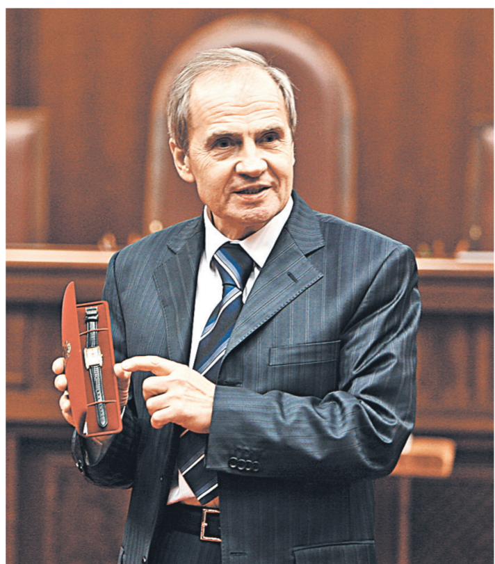
Валерий Зорькин зарекомендовал себя как принципиальный юрист.