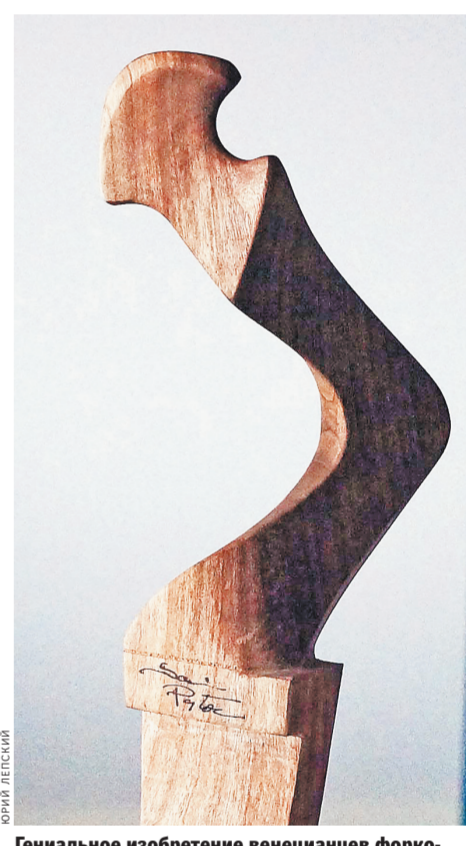
Гениальное изобретение венецианцев: форк-ла — деревянная уключина гондолы.