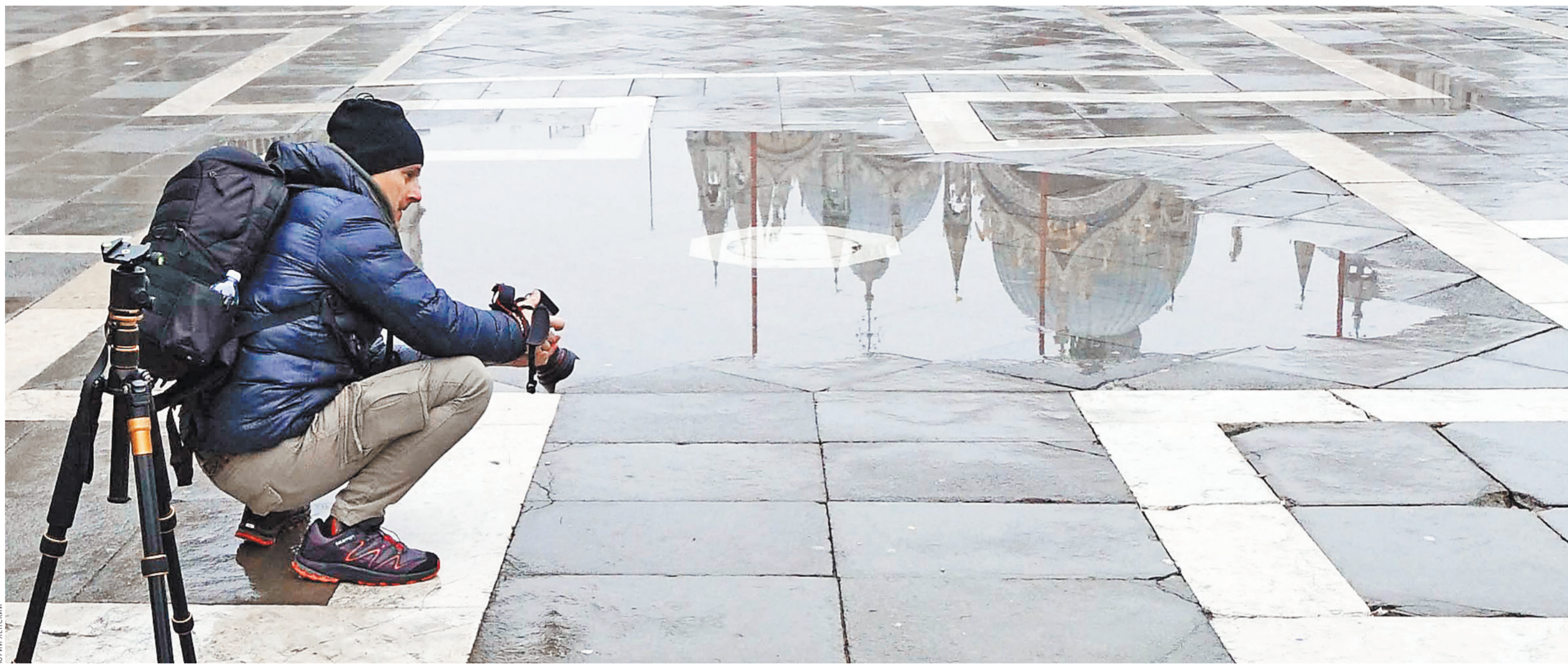
Многочисленные фотографии увозят отсюда фрагменты этой красоты.

И все же «маленькие Венеции», разбросанные по всему миру, это мы сами. Мы изгнанники из суровых и порой жестоких к нам жизненных обстоятельств, приезжающие сюда за красотой и свободой, за глотком свежего воздуха лагуны, которого хватает иногда на год, иногда на два, а иногда на всю жизнь.