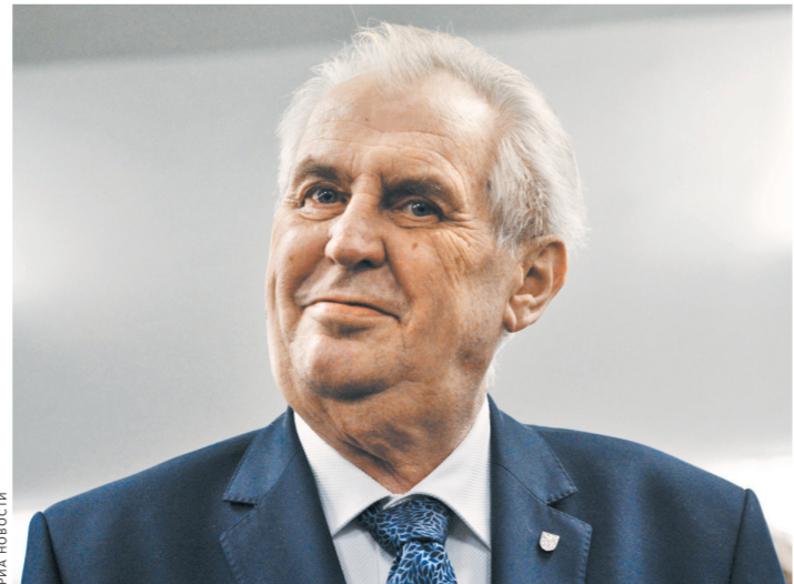
Милош Земан будет президентом Чехии еще пять лет.