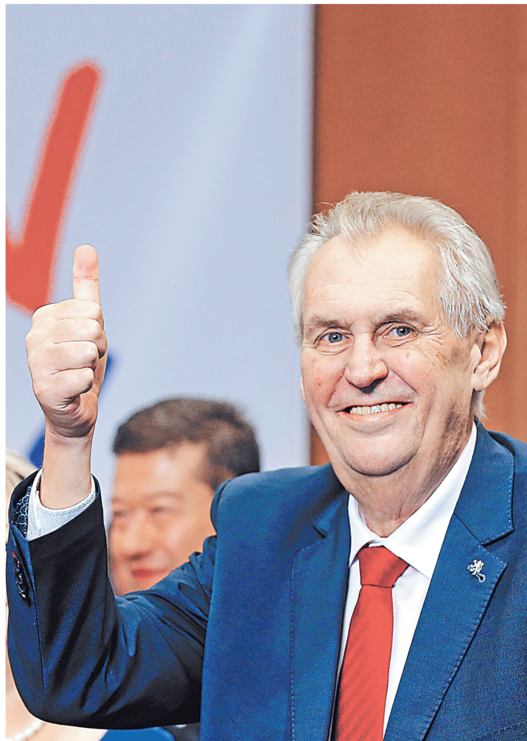
На нынешних президентских выборах за Земана проголосовало даже больше избирателей, чем на предыдущих.

та на два примерно равных лагеря. Причем граница проходит вовсе не по отношению к тому, каких этических правил должен придерживаться глава государства. Оба кандидата однозначные сторонники евроинтеграции, ни тот, ни другой ничего не имеют против членства Чехии в НАТО, нет у них особых разногласий и по большинству других фундаментальных вопросов. Тогда почему избиратель предпочел Земана? Думается, ответ таков: живущие в самом сердце Европы чехи извлекли хорошие уроки из своего исторического опыта и теперь болезненно не хотят потери своей национальной идентичности, изо всех сил стремятся сохранить свою самобытность, культуру, независимость. Милош Земан, категорически отвергающий всякие понукания, идущие из Брюсселя и Вашингтона, циничный прагматик, любитель местного пива и сливовицы, последовательный противник заигрывания с радикальными исламистами иммиграционных квот, сторонник отмены антироссийских санкций, он, как верно заме-