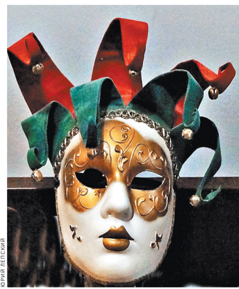
...И маска на стене.