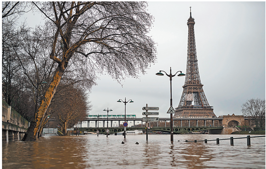
По нижним набережным Сены несутся потоки воды. Потоп угрожает Марсову полю и острову Ситэ.

В связи с риском наводнения знаменитые столичные музеи принимают меры предосторожности. Лувр, музей Орсе перенесли часть своих коллекций на верхние этажи. Также поступили в дворце Пети-Пале, что рядом с мостом Александра III, где начали эвакуировать несколько тысяч экспонатов.