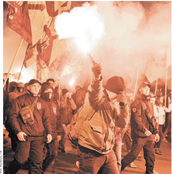
В 2017 году сторонники Бандеры не раз маршировали по Киеву. Но в Польше за подобные взгляды им грозит тюрьма.