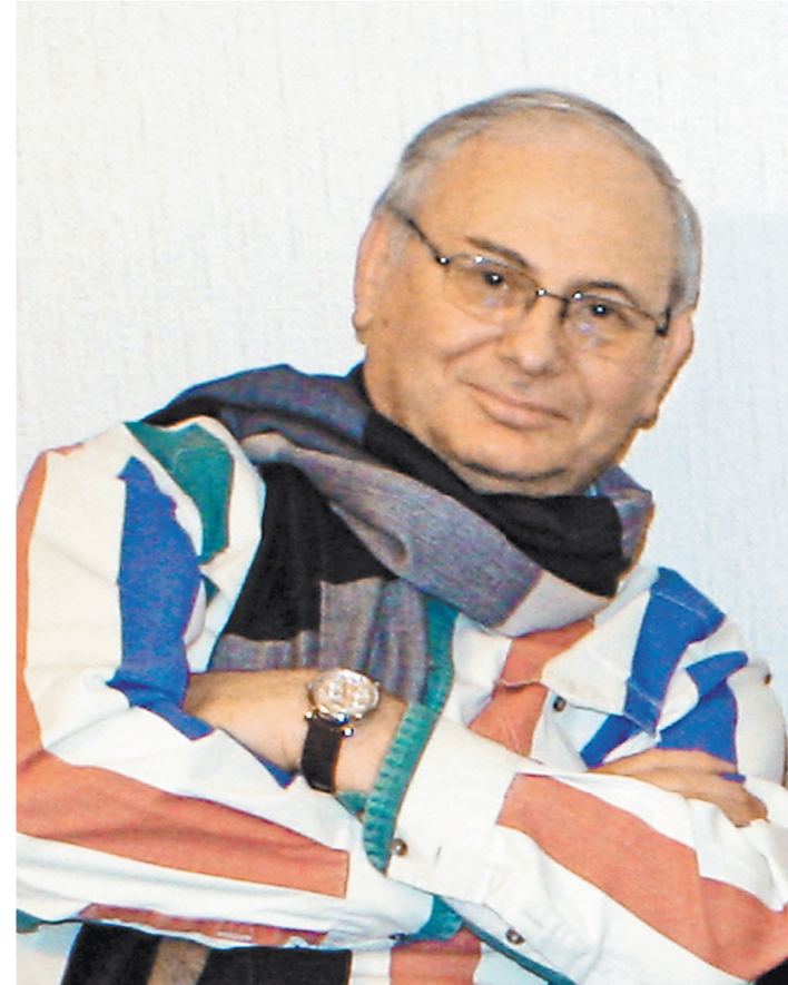
Вот таким он и останется для всех, кто его знал и любил.

По его словам, возрастет также оперативность и улучшится качество рассмотрения дел в судах первой инстанции. В проекте сказано, что целях приближения правосудия к месту нахождения или месту жительства лиц, участвующих в деле, находящихся или проживающих в отдаленных местностях, федеральным законом в составе апелляционного суда общей юрисдикции или кассационного суда может быть образовано постоянное судебное присутствие, расположенное вне места постоянного пребывания суда. Такое постоянное судебное присутствие будет обособленным подразделением окружного апелляционного или кассационного суда.