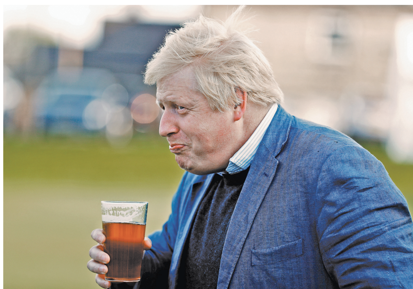
Глава британского МИД Борис Джонсон ругает ЧМ-2018, но любит пиво.