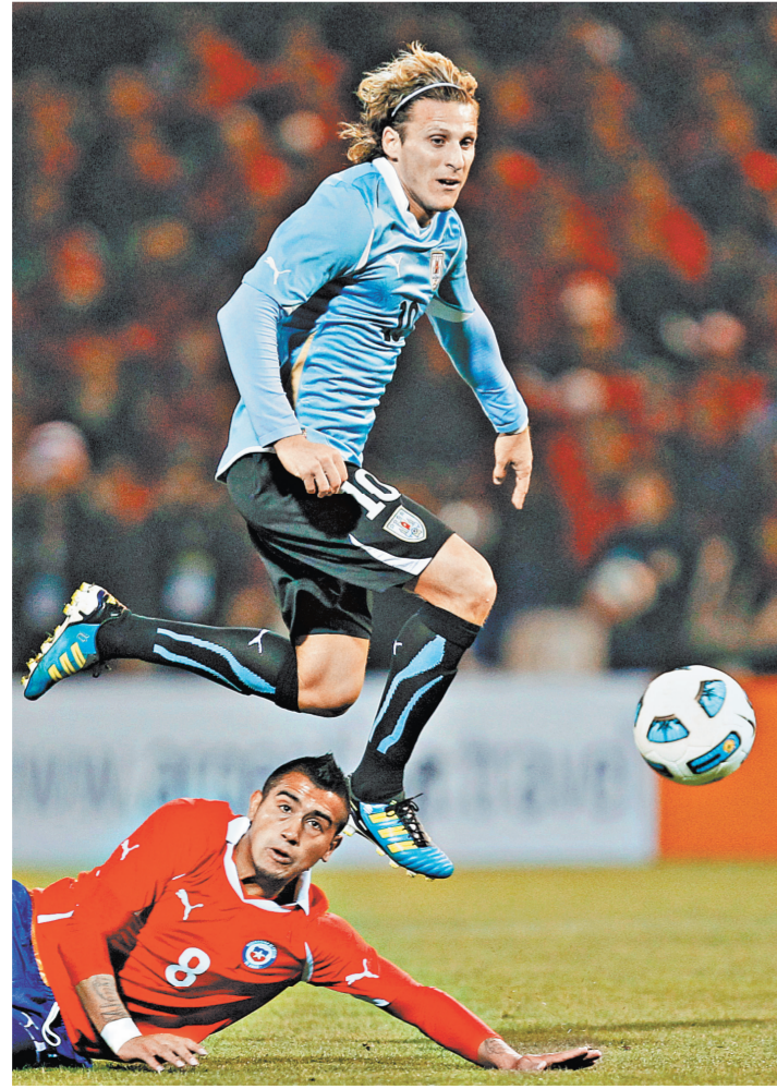
Диего Форлан считает, что смена тренера в испанской сборной за сутки до старта ЧМ никак не повлияла на команду.

В ожидании матча у москвичей и гостей столицы появилась возможность узнать соперника поближе: в самом центре города в ГУМе открылся интерактивный музей «Ла Лиги», высшего испанского дивизиона, в клубах которого играет подавляющее большинство игроков сборной Испании.