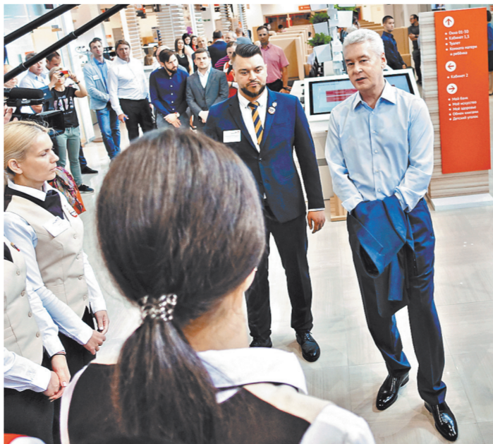
Собянин высоко оценил организацию работы нового флагманского МФЦ

Революция в сфере предоставления госуслуг, по словам мэра, будет продолжаться и дальше. «Не все офисы пока такие красивые, как этот. Районные центры размещаются пока еще не в очень хороших помещениях. Будем дописывать лучшие здания и развивать дополнительные сервисы», — пообещал мэр.