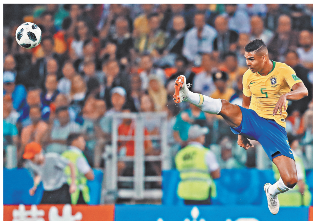
Бразильские футболисты начали групповой этап с ничьей в матче со Швейцарией, но затем обыграли Коста-Рику и сербов. В 1/8 финала «желто-зеленые» встретятся с мексиканцами.

Владимир Путин и президент ФИФА Джанни Инфантино сыграли в футбол на Красной площади / стр. 9