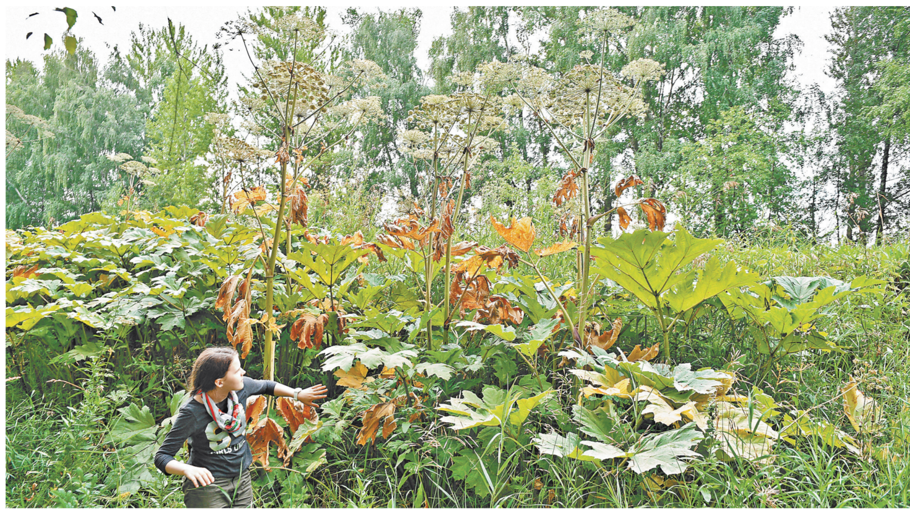
НИКАИИ ФРОЛОВ / КОСМОПОЛИС ПРАДА