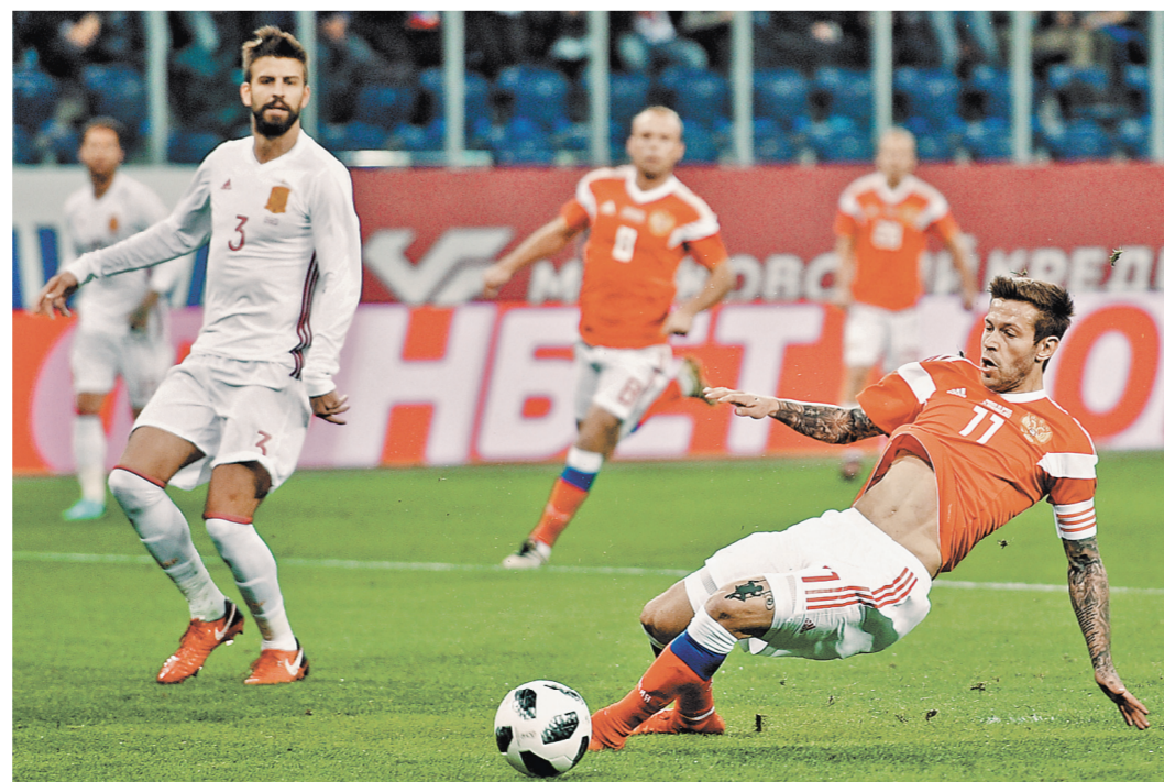
В ноябре прошлого года товарищеский матч Россия — Испания в Санкт-Петербурге завершился со счетом 3:3.

Какие шансы в процентах у России пройти Испанию, Владимир Гранат? 50 на 50.