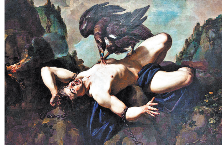
Сегодня медики смогли бы помочь даже Прометею.