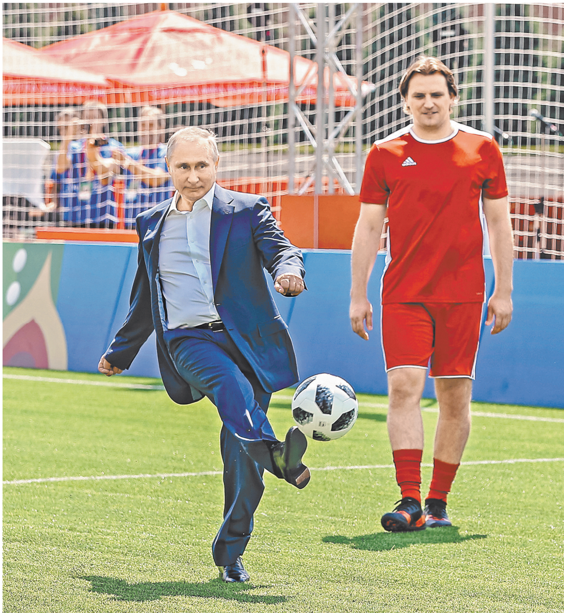
После второго удара президента юный вратарь пропустил мяч. «Классно!» — восторжались дети. «Ну, как-то так», — улыбнулся и развел руками Владимир Путин.

Парк футбола будет работать в Москве до самого завершения чемпионата.