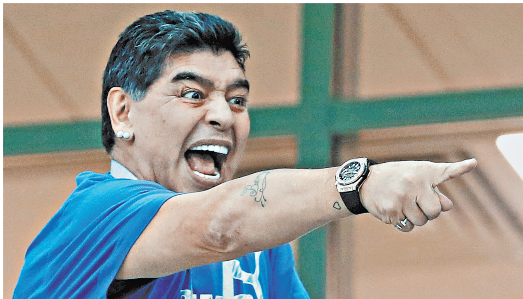
То, как эмоционально болит за сборную Аргентины на трибуне Диего Марадона, — целый спектакль.