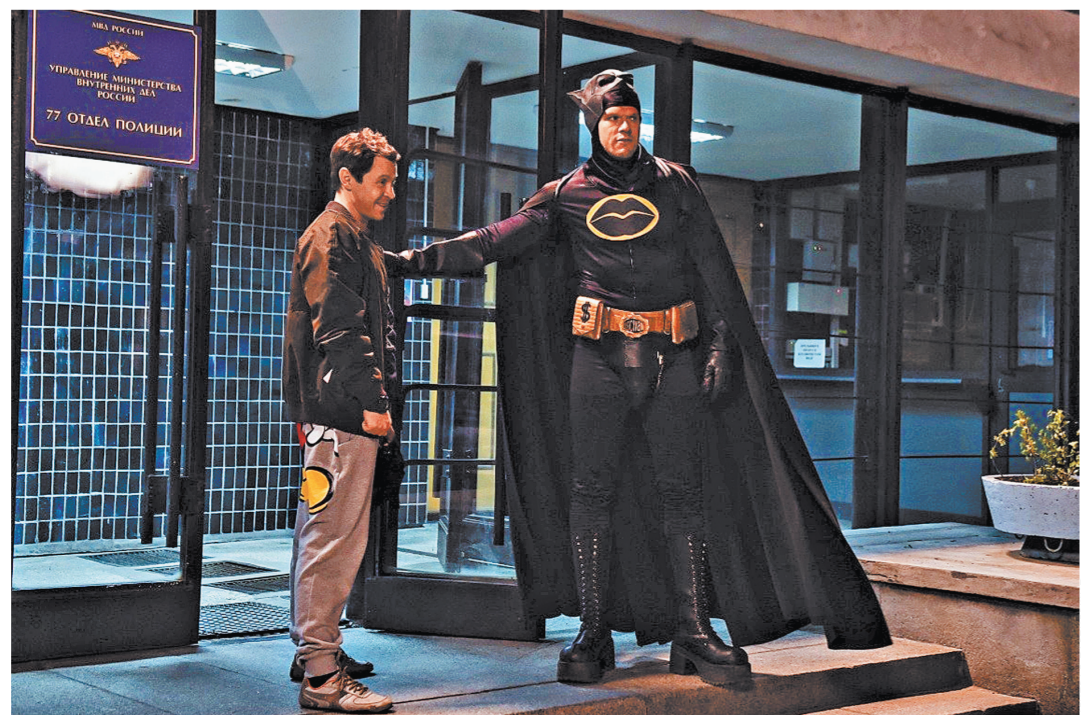
Фильмы Вайсберга представляют интерес социологический — как барометр усредненного «народного» вкуса.

Но самым важным в случае с «Ночной сменой» был, разумеется, ее прием целевой аудитории. И вот тут случился главный казус — свой стартовый уик-энд «Ночная смена» стреском провалила, заработав вдвое меньше ожидаемого. То есть Марюс Вайсберг как бы говорит — люди, пришло время слушать и рассказывать новые истории. А люди будто отвечают: ничего такого знать не хотим, давай нам Ревву в гриме бабушки.