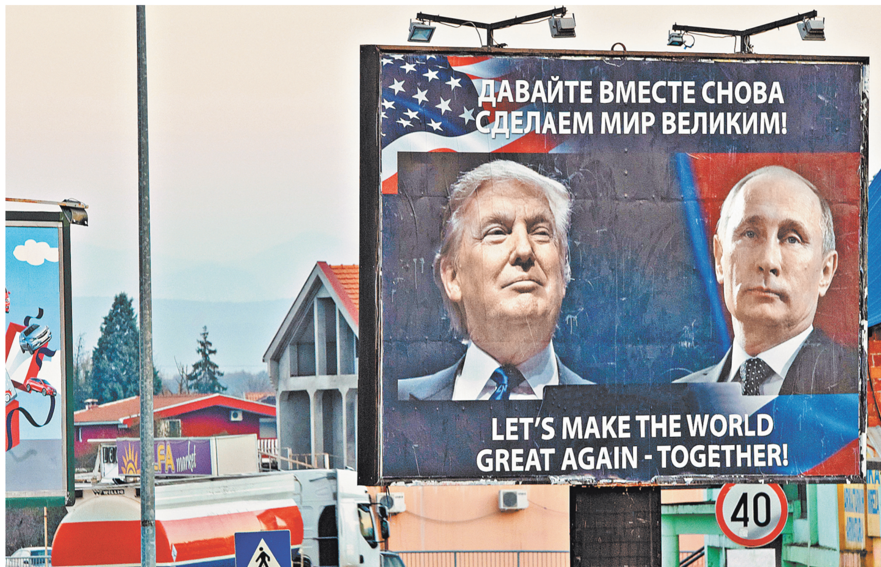
Во всем мире от лидеров России и США ждут прорывных решений как в двусторонних отношениях, так и в глобальной повестке.