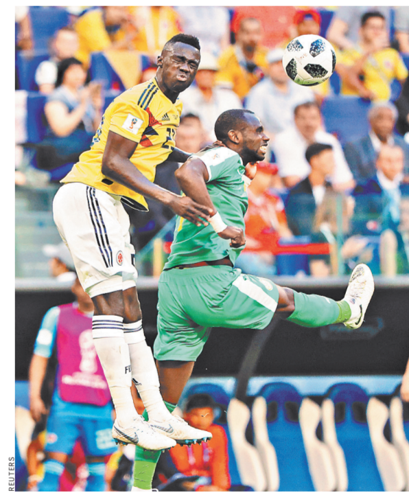
В матче колумбийцев с Сенегалом удача была на стороне южноамериканцев.

Сборная Японии участвовала в плей-офф чемпионата мира. Было это в 2002 и 2010 годах. В первом случае азиаты уступили Турции, во втором — Парагваю.