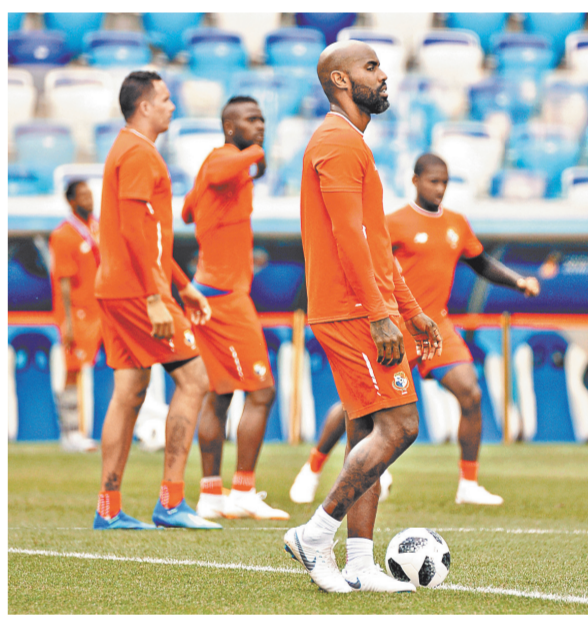
Сборная Панамы — одна из 16 команд, которые после предварительного этапа отправились домой.