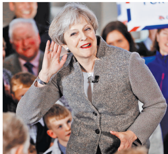
Тереза Мэй продолжает уверять британцев, что им не стоит волноваться по поводу «брексита».

Момент для презентации «дорожной карты» для будущих переговоров с Лондоном европейские стратеги выбрали не случайно. В среду прекратит работу британский парламент — об этом премьер Тереза Мэй сообщила королевев, чтобы получить формальное одобрение роспуска депутатского корпуса. Глава британского правительства утверждала, что досрочные выборы нужны для того, чтобы продемонстрировать ее политическим