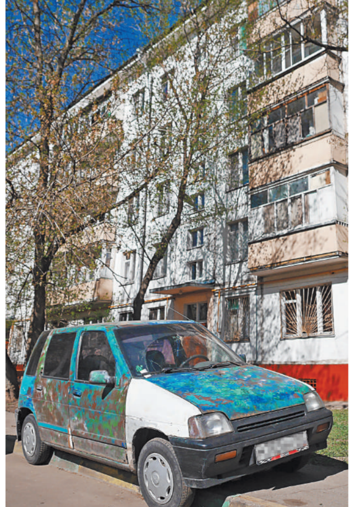
Депутаты хотят удостовериться: действительно ли жители пятиэтажек мечтают о новой жизни в новом доме?

Конкретную дату рассмотрения поправок установит Совет Госдумы 16 мая.