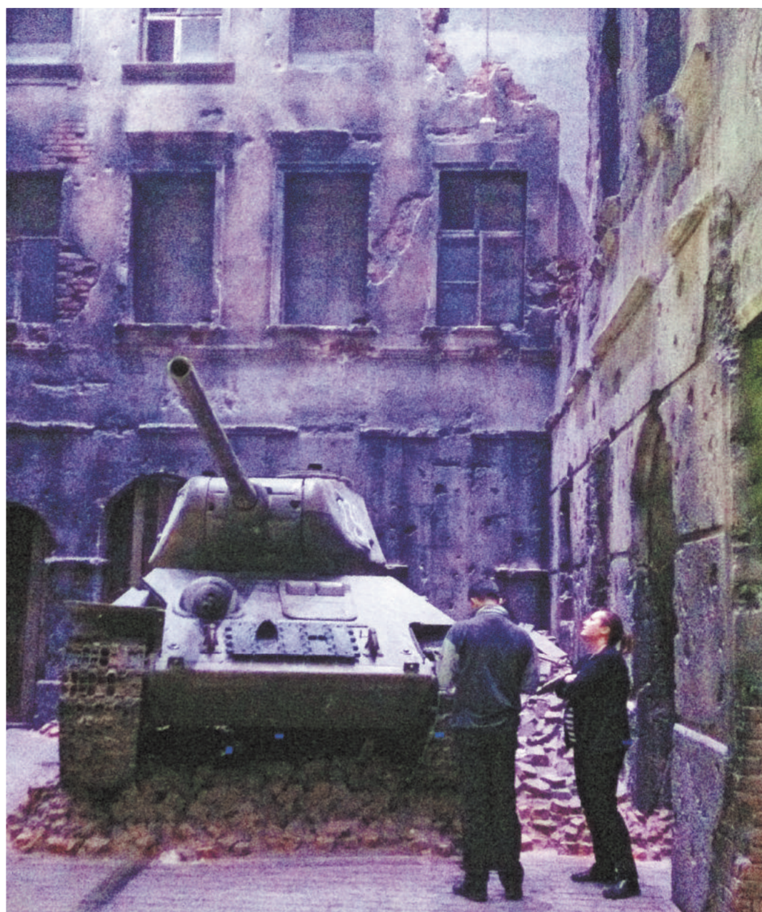
В конце экспозиции можно увидеть, как выглядела после войны обычная улица обычного города в восточной части Европы. На стене одного из домов написано по-русски: «Мин нет».

На вопрос корреспондента «РГ», почему город сразу превратил в концепцию молодых историков и выделил землю под музей в очень престижном районе на берегу Мотлавы, а правительство «Гражданской платформы» потратило на его создание полмиллиарда злотых, президент Адамович пояснил, что это, как и многих других, захватил масштаб этого замысла. «На церемонии открытия в конце марта Маршалеца, конкретно те, которые были привезены с территории бывшего СССР, это в основном заслуга сотрудника музея, который происходит из Казахстана, и русский язык является для него родным. Он проделал огромную работу, разрезая по городам и весям. Среди экспонатов в том числе и предметы из архива