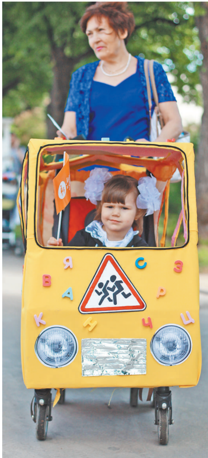
Няни должны будут получать лицензии на свою деятельность.

И платить им большие деньги. По данным агентств, предоставляющих услуги няни, минимум, что придется заплатить в месяц, — это 30 тысяч рублей. Да и то такие расценки существуют в средних по численности населения городах. В мегаполи-