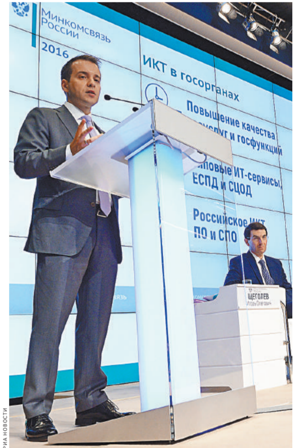
Николай Никифоров: У госкомпаний должна быть финансовая ответственность при закупках софта за рубежом.

Что до цифровой экономики, то она нуждается в базовом бюджетном финансировании, уверен Никифоров. К 2024 году 97 процентов жителей России могут быть подключены к своему «быстрому» Интернету по приемлемой цене. В рамках подготовки приоритетного проекта по цифровой экономике минкомсвязь рассматривает вопрос обособления платы за универсальные услуги связи, платы за частоты, расходов федеральных органов на цифровизацию, возможно, дополнительных источников финансирования. Все их предлагает объединить в фонд цифровой экономики. В июне единые предложения по этому поводу будут представлены правительству, отметил министр.