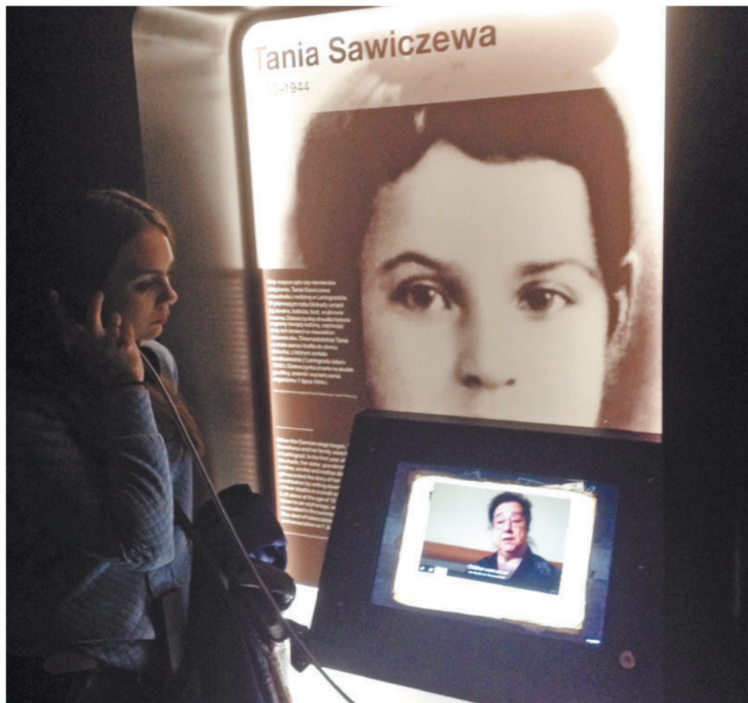
В зале, посвященном блокаде Ленинграда, можно увидеть хлебные карточки и блокадные 125 грамм хлеба, а также послушать историю Тани Савичевой и воспоминания блокадников.