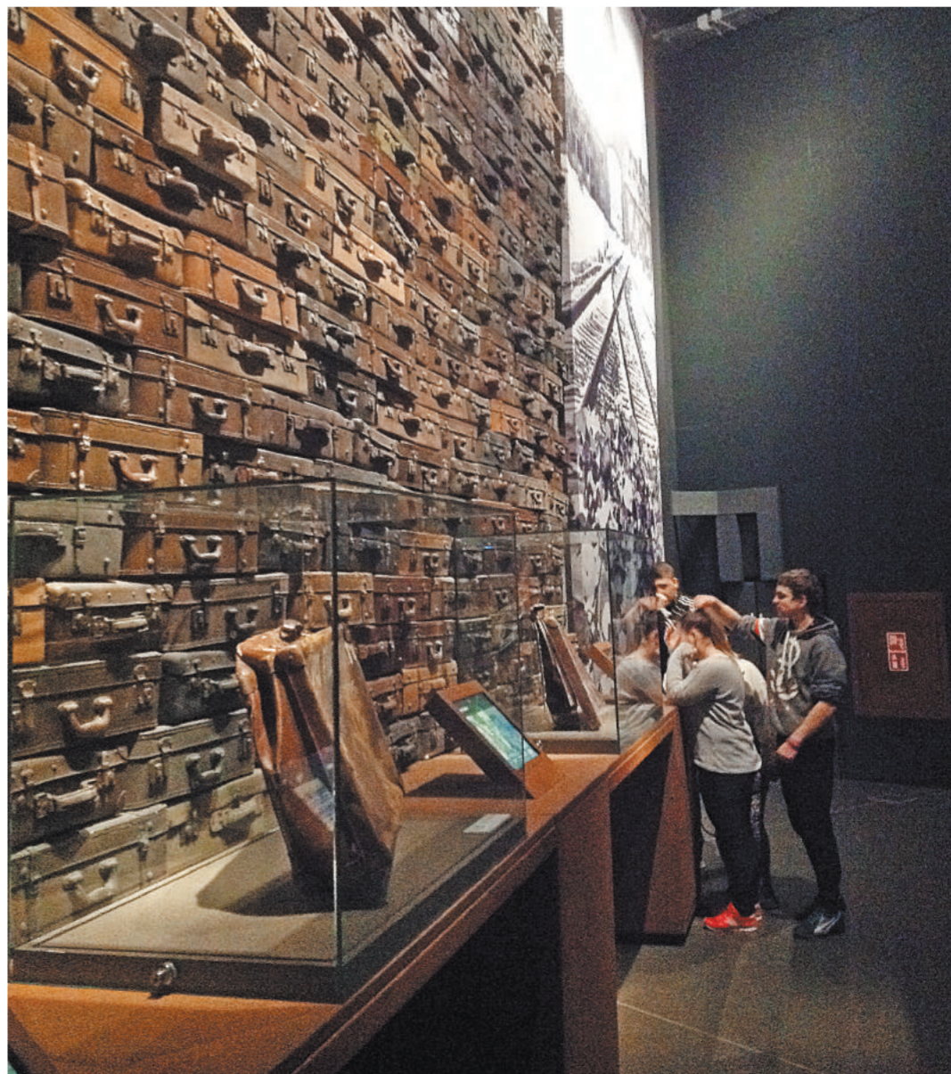
Среди экспонатов, рассказывающих о системе концентрационных лагерей Третьего рейха, особенно сильное впечатление производит стена из чемоданов узников лагеря смерти Аушвиц-Биркенау.

рисковать. Премьер Туск шел на этот риск, потому что у него не было никакой идеологической концепции. Он говорил о теплой воде в кране и невместительстве в дела граждан, а в случае с музеем — полностью доверился специалистам. То, что получилось у нашей команды историков, превзошло все самые смелые ожидания. Даже я — человек, который историю войны знает достаточно неплохо, только здесь узнал, например, что в оккупированной гитлеровцами Дании существовали правительство и армия, которая должна была только предупредить вермахт о проведении своих учений (то есть практически не зависеть от вермахта. — Авт.) И одновременно там показано то, что известно нам, но неизвестно в Западной Европе: например, что за спасение евреев в оккупированной Польше и в занятых немцами районах СССР грозила смертная казнь, и люди все равно спасали — под страхом смерти».