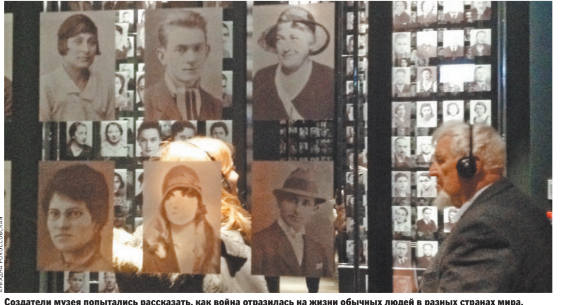
Создатели музея попытались рассказать, как война отразилась на жизни обычных людей в разных странах мира.

Экспозиция находится в специально построенном помещении площадью более 5 тысяч квадратных метров на глубине 15 метров под землей. По этой причине некоторые особенно крупные экспонаты устанавливали на этажах строительства.