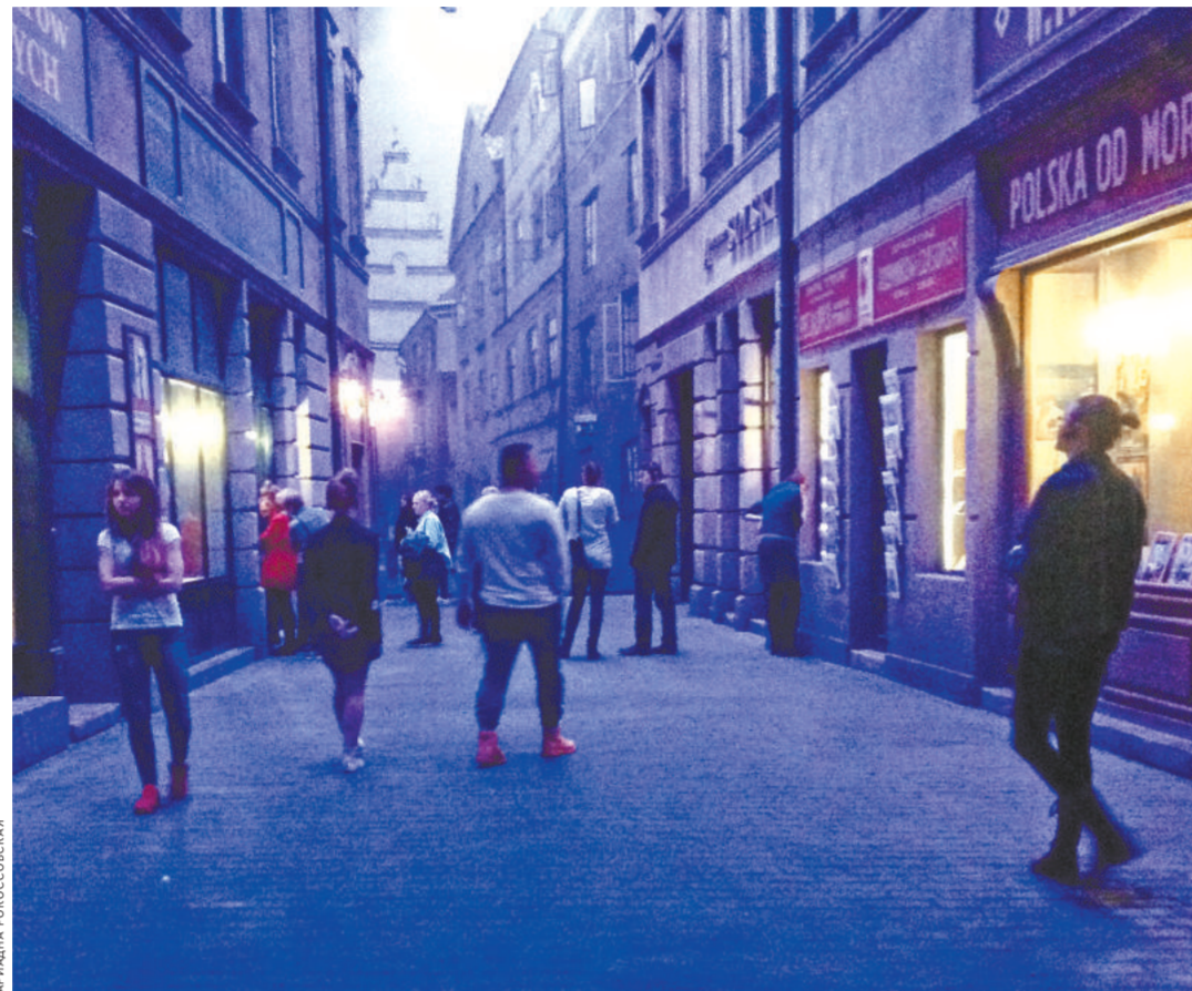
В начале экспозиции посетители попадают на довоенную польскую улицу — с киосками и кинотеатром.