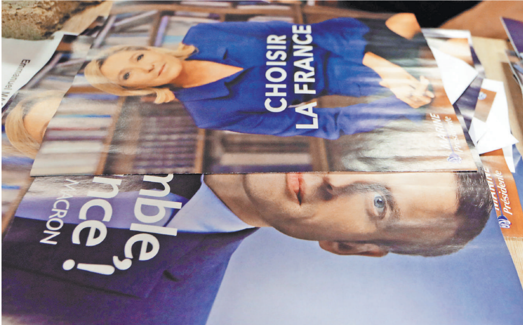
Организаторы дебатов Ле Пен и Макрона, назначив их на 3 мая, допустили более чем досадную промашку, вызвав большое недовольство французских болельщиков.

Оба кандидата основательно готовились к битве, в которой в прошлом банкир, министр экономики Эмманюэль Макрон считается фаворитом. Хотя он себя и позиционирует в качестве «независимого кандидата», ни для кого не секрет, что его массово поддерживает практически весь социал-либеральный истеблишмент — политический, финансовый и экономический, как французский, так и Евросоюза, который бросает в дрожь от мысли,