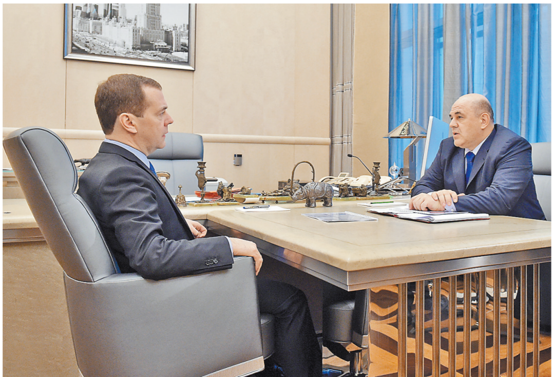
Премьер одобрил усилия ФНС, которые делают жизнь налогоплательщиков более спокойной, предсказуемой.

Некоторые депутаты, а также защитники прав автомобилистов, опасаются, что термин «опасное вождение» при введении ответственности за него, может стать поводом для коррупции.