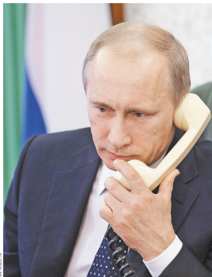
Беседа Путина и Трампа прошла в позитивном ключе.