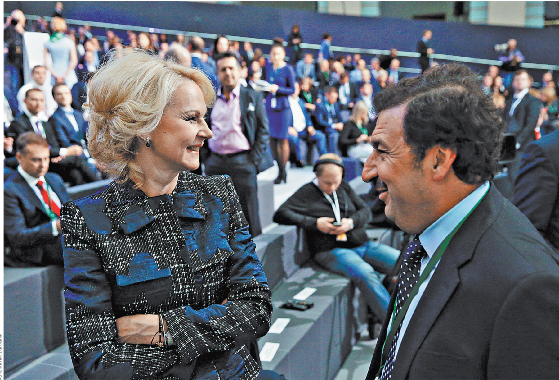
Владимир Мау, как и Татьяна Голикова, считает, что пенсионный возраст должен быть повышен.

Правда, Маркс учил нас, что если история повторяется дважды, то один раз это происходит как трагедия, второй раз как фарс. Если повторит Рейгана, может, это и не самый плохой вариант. Во всяком случае, я настроен не так скептически, как многие из поколения глобализации, для которых жесткая антиглобалистская риторика страна. Но и надежд каких-то особых в связи с Трампом у меня нет. На самом деле, у нас просто недостаточно информации, чтобы понять, чего ждать от новой администрации в США.