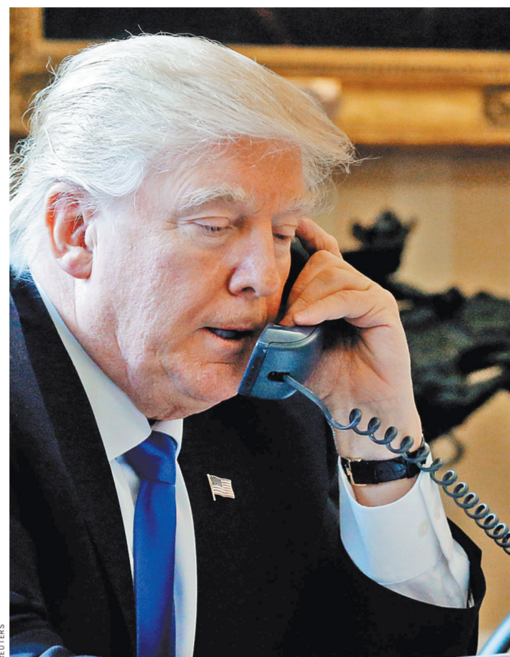
Президенты договорились поддерживать личные контакты.