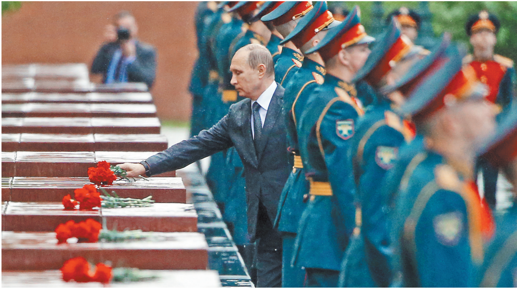
Президент также возложил цветы к обелискам городов-героев в Александровском саду.