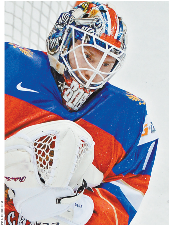
Карьеру в НХЛ Бобровский совмещает с игрой за сборную — он выступил на трех чемпионатах мира и Олимпиаде-2014.