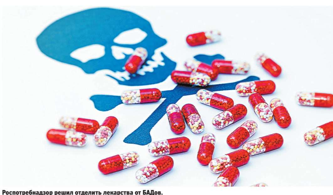
Роспотребнадзор решил отделить лекарства от БАДов.

Витаминный «голод» нашли у большинства россиян — подробности узнайте на сайте rg.ru/art/1396604