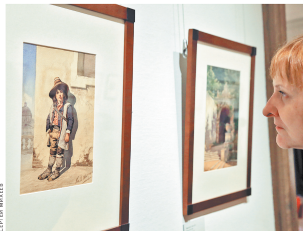
Под выставку «Конец прекрасной эпохи» Третьяковская галерея выделила пять залов отдела графики.