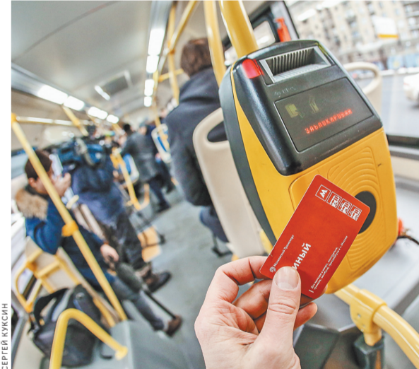
Как только в автобусе появляется турникет, зайцев на маршруте становится в три раза меньше.