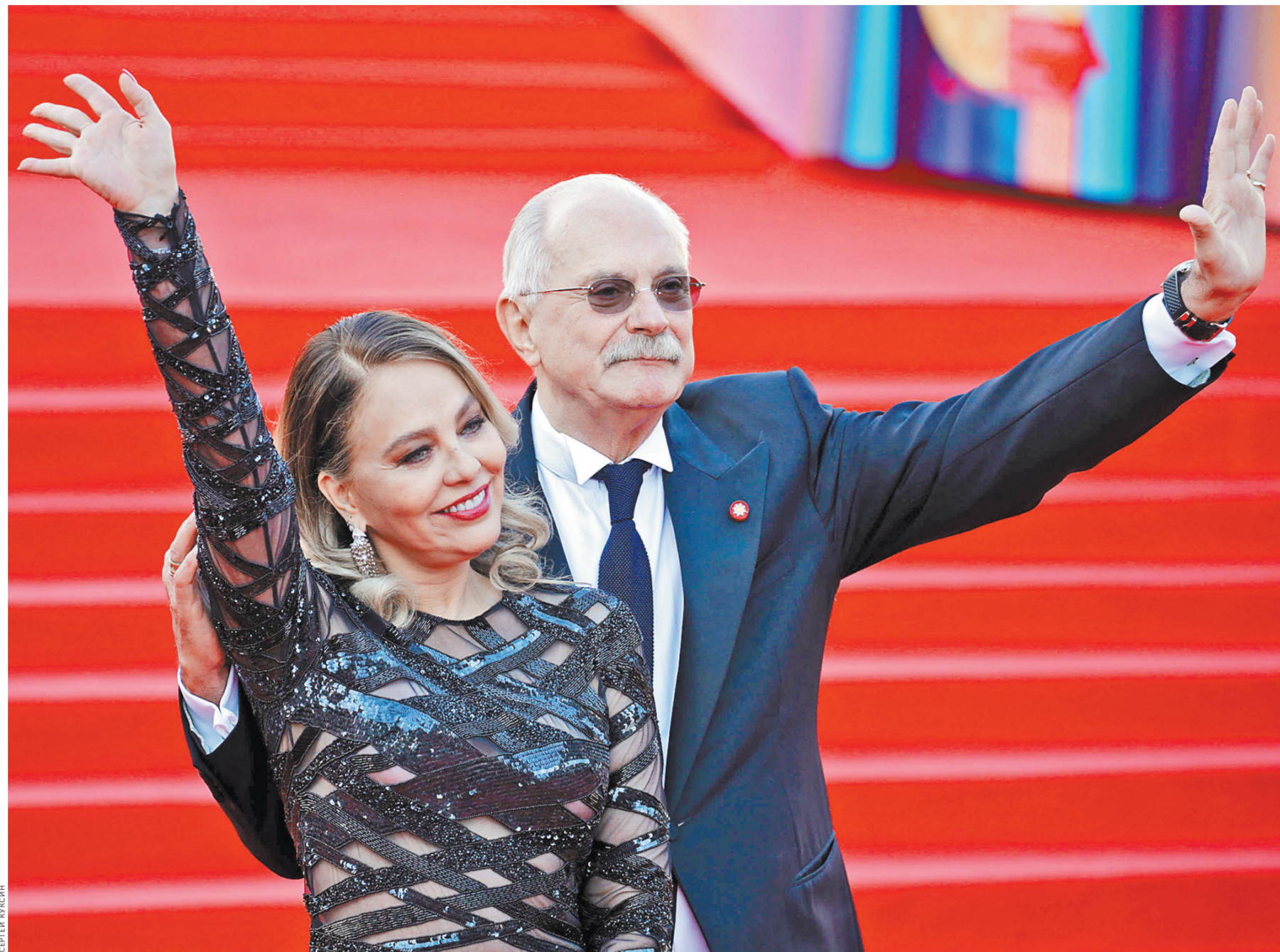
Главной звездой церемонии открытия ММКФ стала итальянская актриса Орнелла Мути, вошедшая в состав жюри фестиваля.

Был момент, когда ни одной русской картины не было, которая была бы достойна фестиваля. Был скандал в микроблоге — неужели нет ни одного фильма, чтобы достойно была представлена страна.