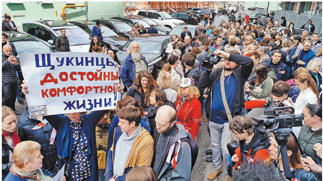
Москвичи, пришедшие вчера к Госдуме, ждут от законопроекта о пятиэтажках улучшений в своей жизни.

Ключ к решению проблемы глава Совфеда видит в работе с молодежью. Надо развивать сеть филиалов российских вузов за рубежом, оказывать поддержку иностранцам, желающим получить образование в России, особенно когда речь идет о соотечественниках. Мостом для молодежи стран СНГ, говорящей на русском языке, может стать и развитие электронных библиотек русскоязычной литературы, считает министр образования РФ Ольга Васильева. По ее словам, не стоит идти на поводу у латинизации и арабизации графики стран, где распространены русский язык, надо поддерживать кириллическую письменную традицию, мотивировать к изучению славянских иностранных студентов. Пока эту специальность выбирает всего 1% от тех, кто приезжает на учебу в Россию по линии Россотрудничества.