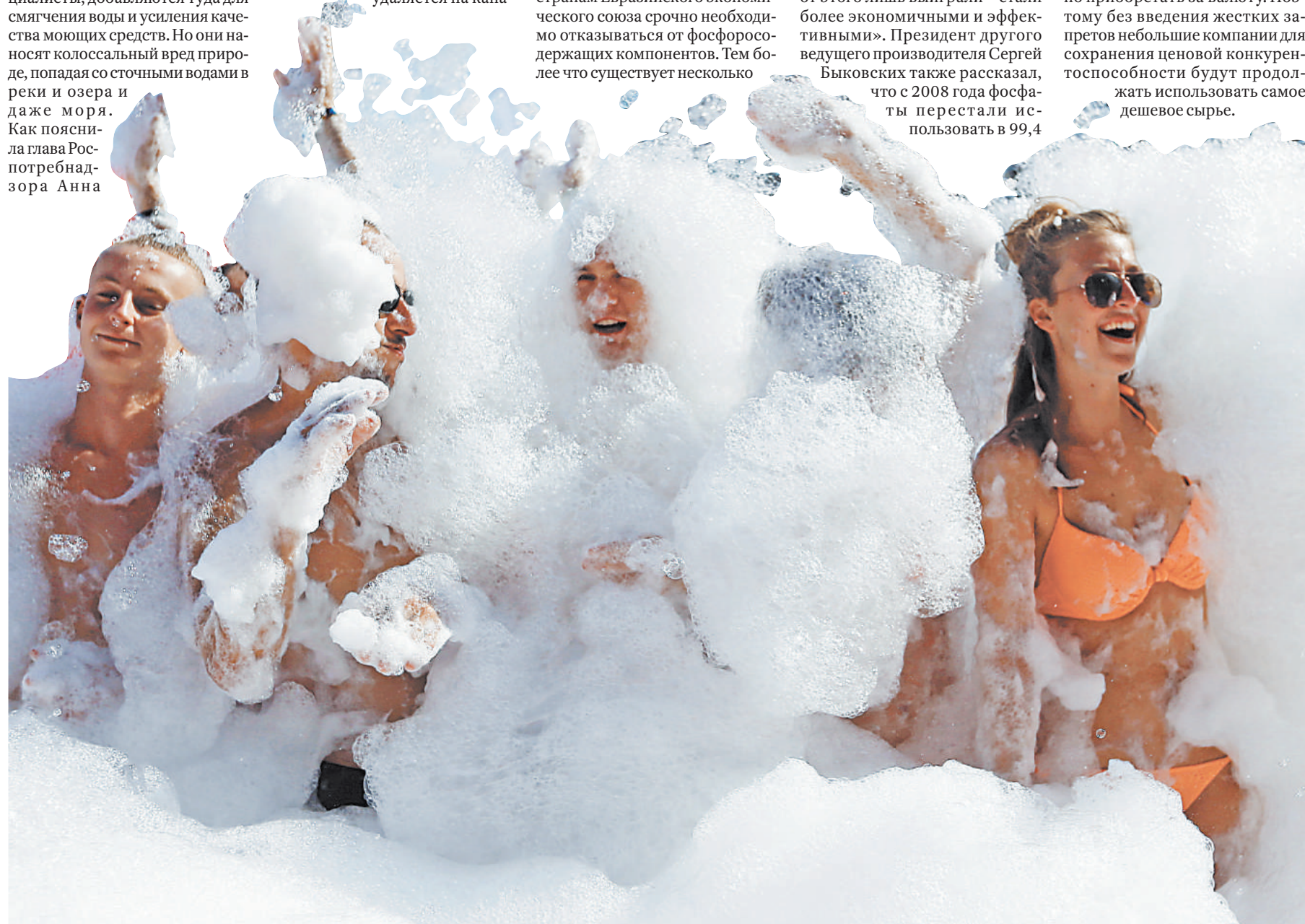
Порошки и гели должны не только хорошо отмыть, но и быть безопасными.