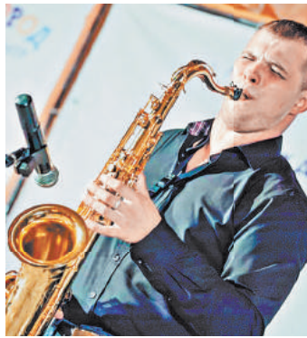
Джазовый конкурс в Москве собрал лучших музыкантов из Европы и стран СНГ.

Джаз — удивительная музыка. Предельно эмоциональная, неприкаянная, беспокойная и постоянно ищущая новые формы, идеи, сочетания инструментов и удивительные взаимные влияния с другими музыкальными жанрами — от блюза до латина. И играть джаз стремятся все больше молодых музыкантов, ищущих пути самовыражения и исполнительской манеры. Отборочные туры фестиваля Big Sky стартовали