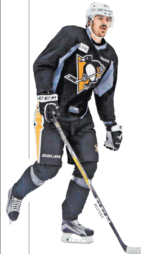
Евгений Малкин снова не забил.

Четвертый по счету поединок серии мало чем отличался от третьего, в котором «Нэшвилл» выиграл 5:1. На этот раз «пингвины» не смогли забить первыми, но довольно быстро ответили на гол Ярнкрока шайбой в исполнении Сидни Кросби. Капитан гостей отличился после выхода «один на один», и этот гол стал для него первым в финальных сериях, начиная с 2009 года, когда Сид забил «Детройту». Но даже успех лидера «Питтсбурга» не помог «пингвинам» после перебива. Ключевой, пожалуй, оказался гол Фредерика Гудро, который засчитали после просмотра видеоповтора — судьи убили-