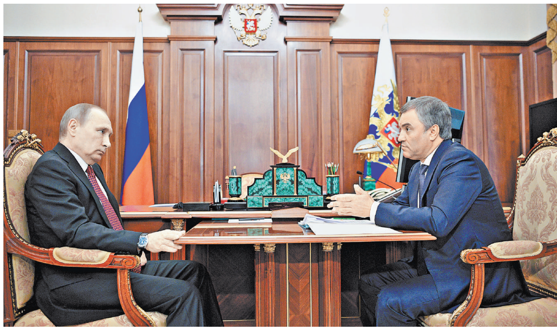
Президент в беседе с Вячеславом Володиным заявил речь о поправках в закон о гражданстве.