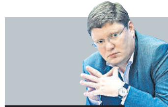
Андрей Исаев первый заместитель руководителя фракции «Единая Россия» в Государственной Думе