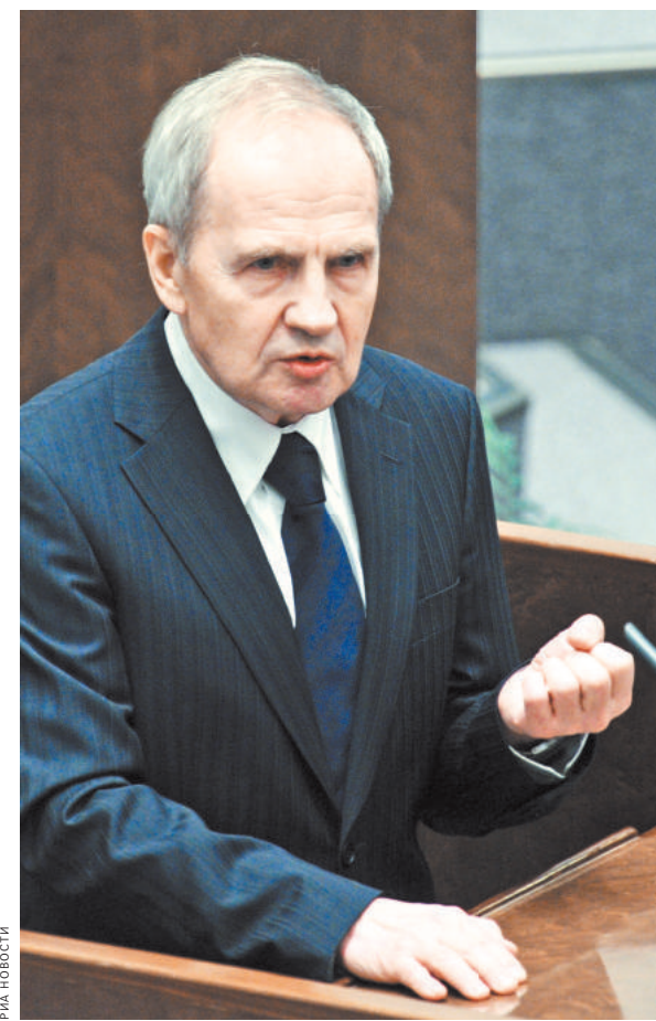
Валерий Зорькин: Законы не создают право — они лишь отмеряют его естественный ход.

Поиск ответов на эти вопросы и посвящена статья председателя Конституционного суда РФ В.Д. Зорькина «Сон права рождает произвол», опубликованная на сайте «Российской газеты» rg.ru/art/1412189