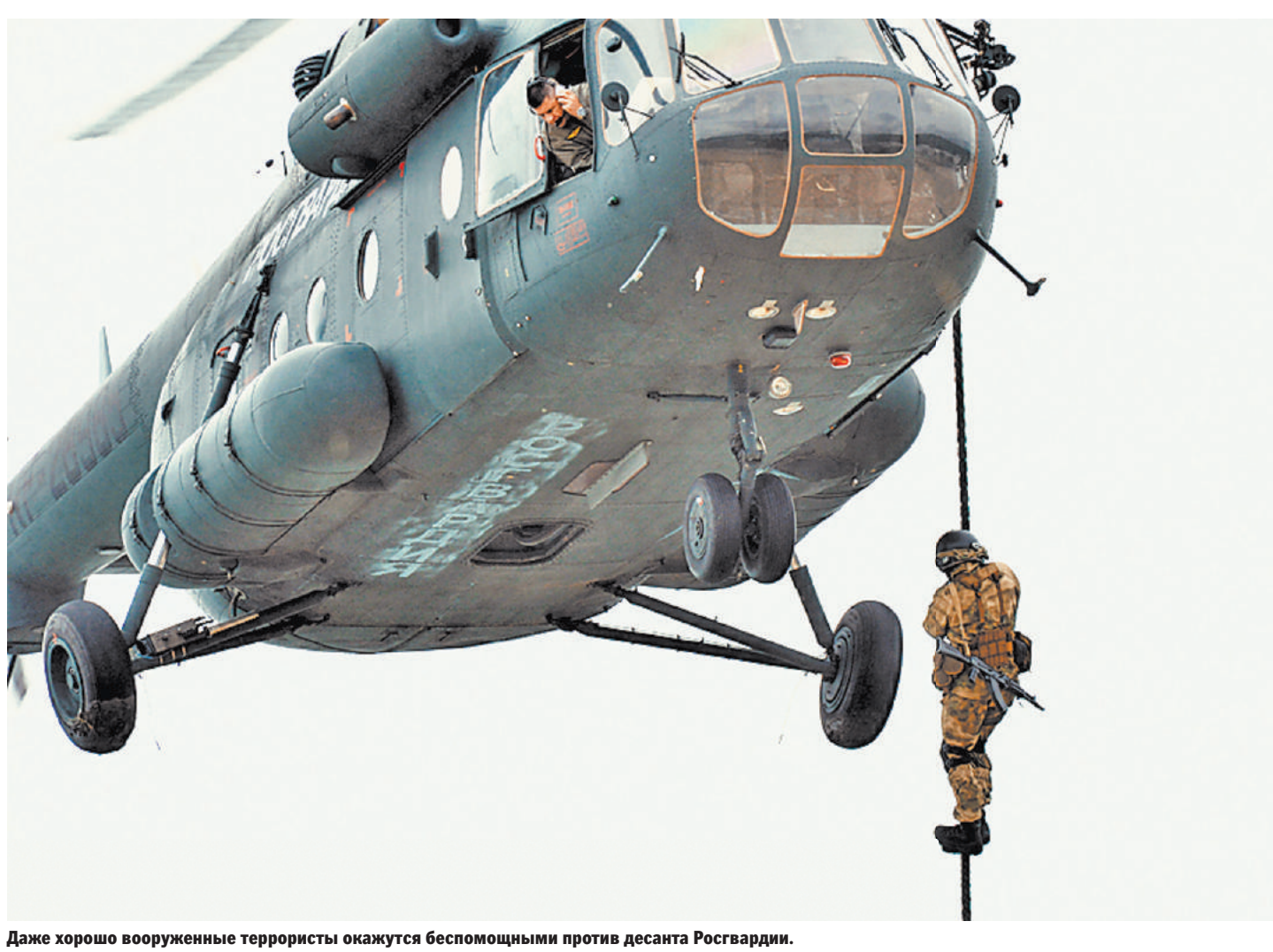
Даже хорошо вооруженные террористы окажутся беспомощными против десанта Росгвардии.