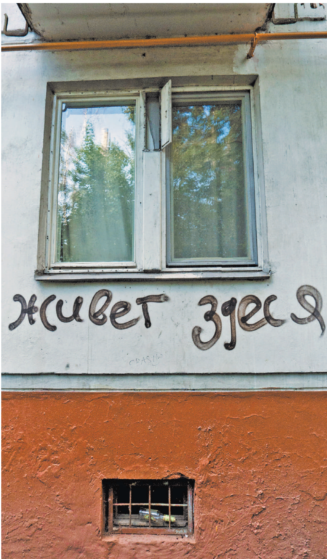
Совет при президенте по правам человека предлагает разрешить людям регистрироваться в нежилых помещениях. Тогда «прописаться» можно будет не только в квартире, но и в подвале и офисе.