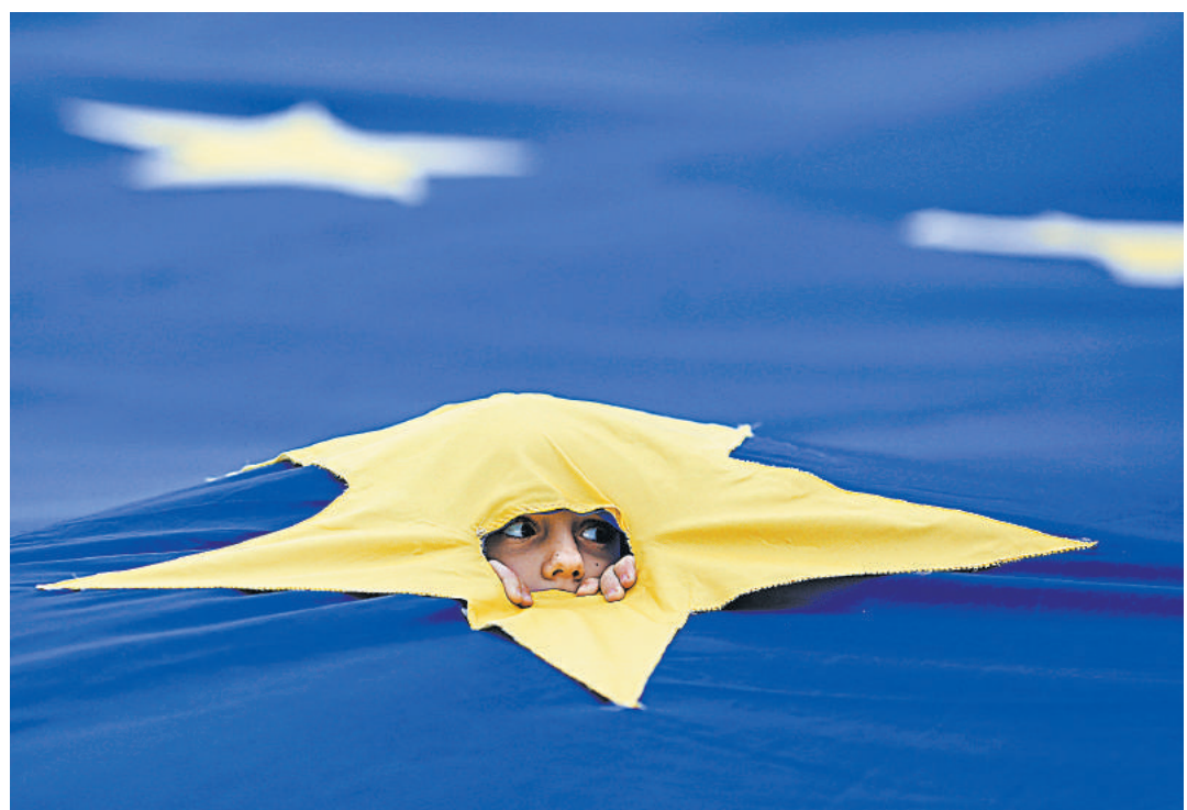
Европейцам предстоит решить, соглашаться ли на добровольное ограничение их личных свобод со стороны спецслужб.