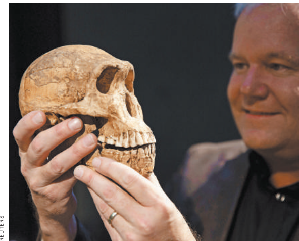
Эта находка знаменитого ученого Ли Бергера стала мировой сенсацией.

— Белов давно в разных СМИ пропагандирует свои «нестандартные» взгляды на эволюцию. Дело в том, что ученые периодически находят существа с переходными признаками. Их можно трактовать в обе стороны, в прошлое и в будущее. Но в теории эволюции четко показано, как человек менялся от обезьяноподобных существ к человекоподобным. Если же следовать логике Белова, то антропологи должны находить останки