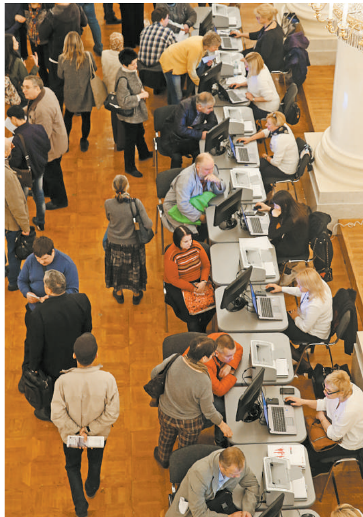
В Москве работают специальные отделы трудоустройства инвалидов. С начала года благодаря им 500 москвичей нашли работу.