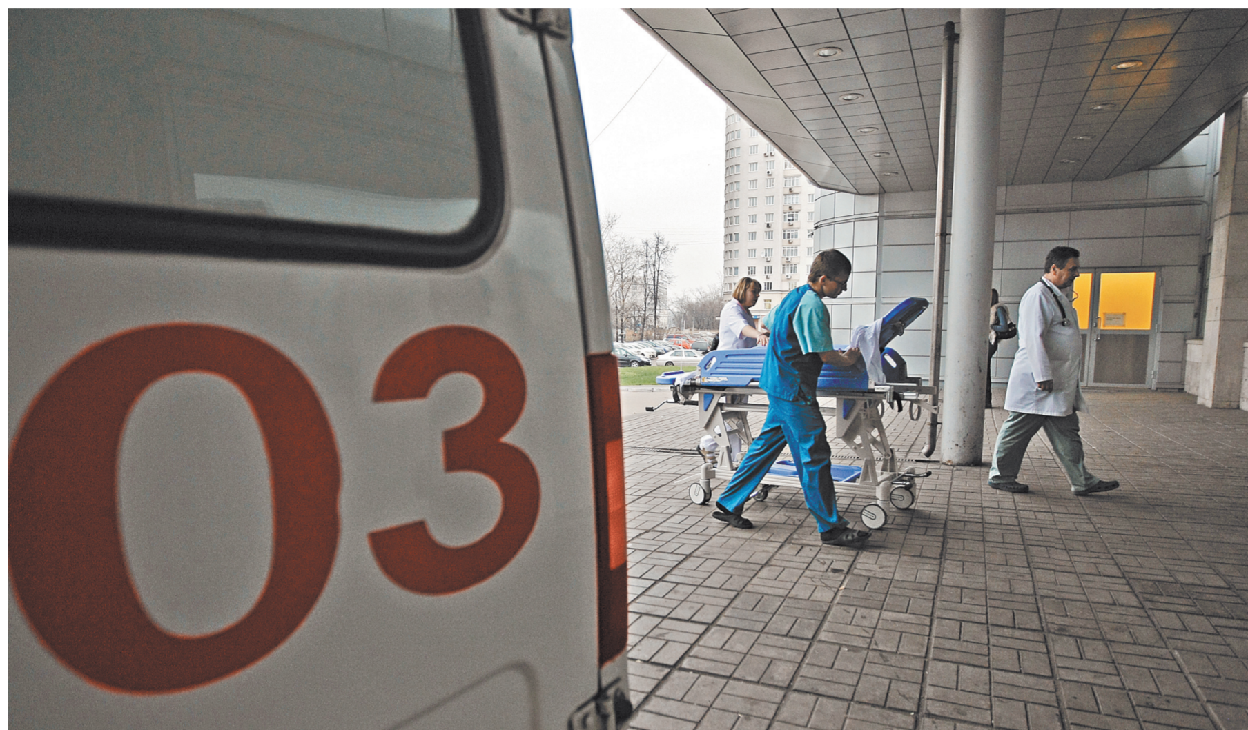
45 миллионов раз каждый год в России врачи «скорой помощи» выезжают к больным.