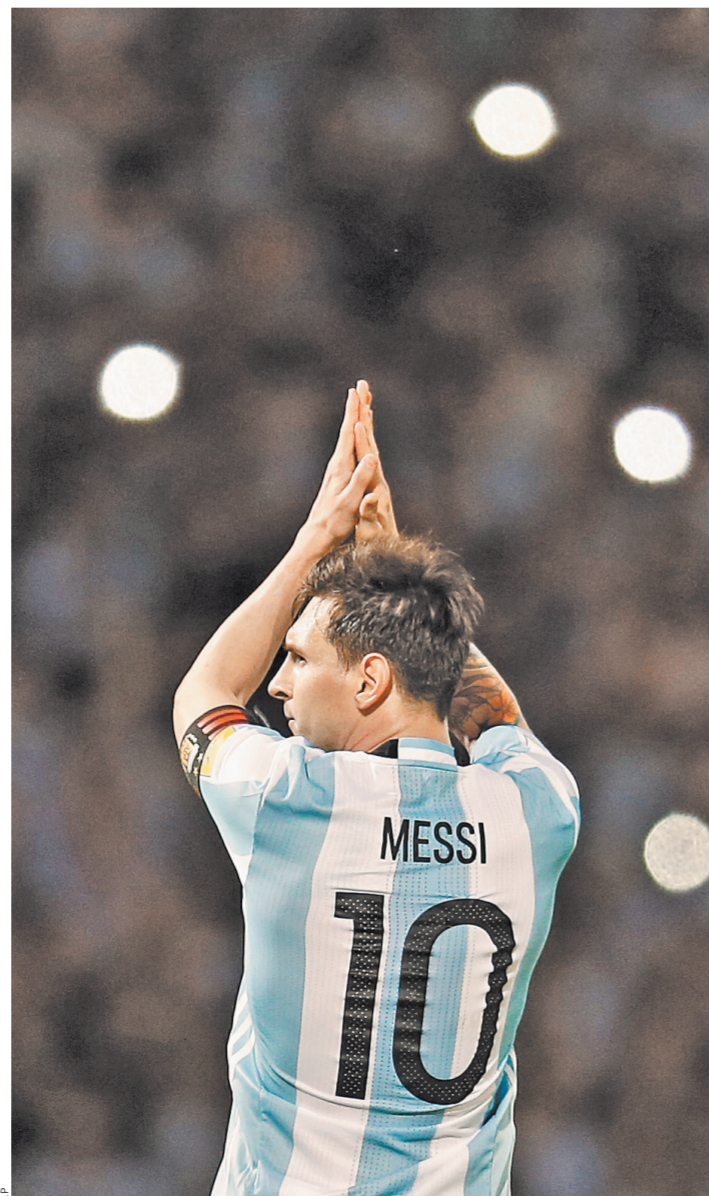
Мяч в ворота Боливии стал первым для Лионеля Месси в текущем отборочном цикле.

провел за сборную Аргентины Лионель Месси