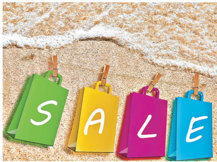
Чиновники, запросто решая судьбу акватории Байкала, не обратили внимания, что закон запрещает торговать природными водоемами.

А с берегами в законе все проще. Водный кодекс говорит о равных правах россиян на все естественные водоемы: «Каждый гражданин вправе иметь доступ к водным объектам общего пользования и бесплатно использовать их для личных и бытовых нужд». Объекты общего пользования — это все водоемы, кроме частных прудов и карьер-