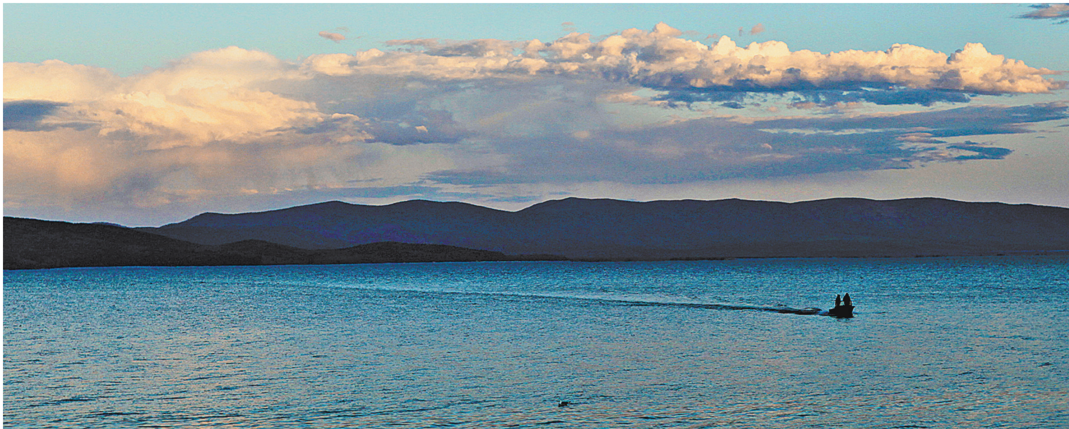
Озеро Байкал остро нуждается в реальной помощи, чтобы остаться на долгие годы самым красивым озером на планете.

1 → Прошла проверка Восточно-Байкальской межрайонной природоохранной прокуратуры. По ее иску суд признал незаконными сделки по оформлению в собственность части акватории Байкала и сделки по передаче прав собственности.