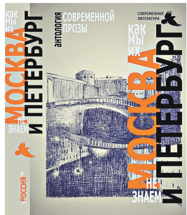
Это первый двоянный том антологии современной прозы — симпатичного проекта «Россия — как мы ее не знаем».