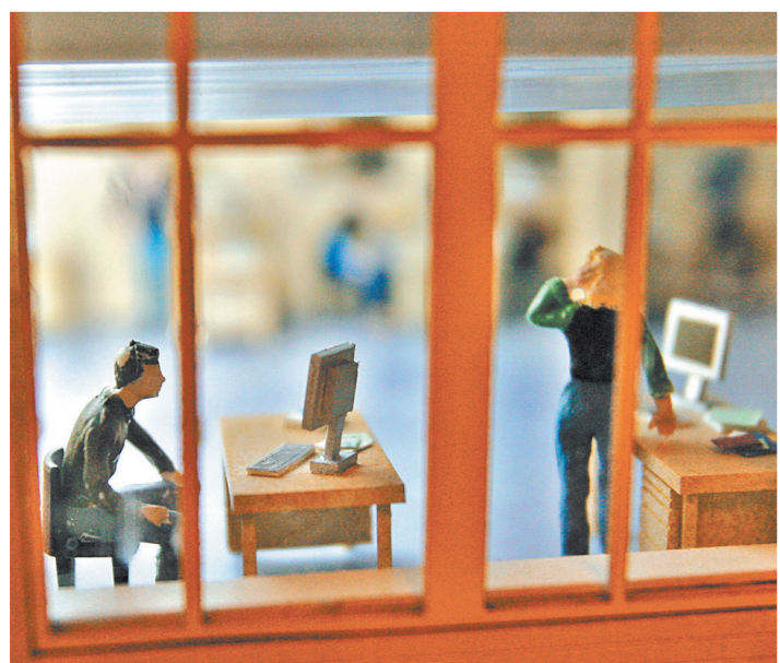
Все услуги и ресурсы для организации своей мини-фирмы соединят в службе занятости в один пакет по принципу «одного окна».

Читайте также: МРОТ вырастет до 7,5 тысячи рублей www.rg.ru/art/1240268