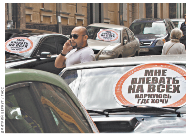
Грубые нарушения закона стали причиной ликвидации «СтопХам».

В свою очередь, основатель и глава общественного движения «СтопХам» вчера сообщил журналистам, что активисты продолжают свою деятельность.