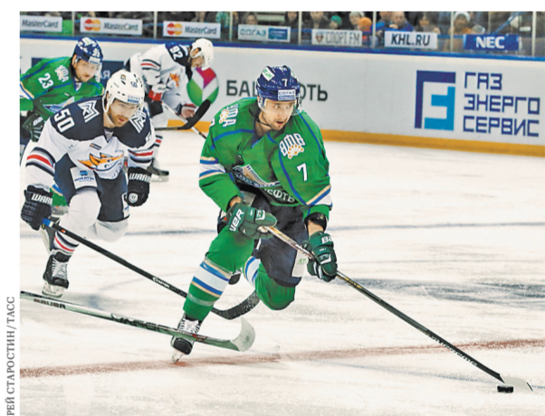
Хоккеистам «Салавата Юлаева» родной лед не помог, и они уже сегодня могут вылететь из плей-офф.