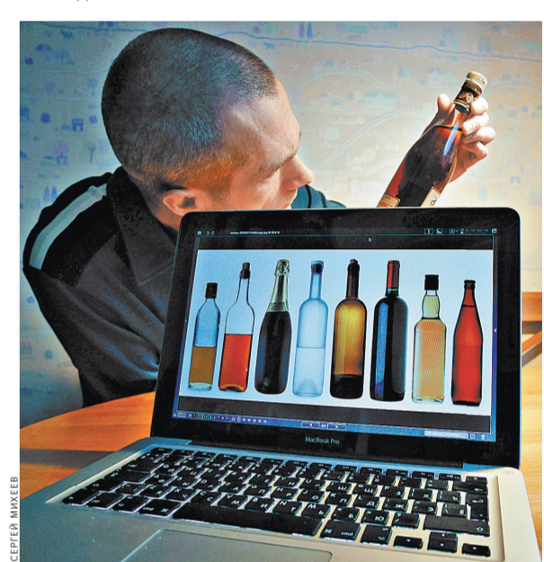
Понять, качественной или нет окажется бутылка спиртного, купленная через Интернет, сейчас практически нереально.

В Росалкогольрегулировании ранее высказывались в поддержку подобной идеи. Вчера в ведомстве «Российской газете» напомнили, что с 2007 года дистанционная торговля алкоголем в России запрещена. И подчеркнули, что пока запрет не снят, законодательство должно четко соблюдаться.