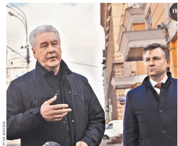
Сергей Собянин: Садовое кольцо после благоустройства обретет новое «лицо».

В МОСКВЕ стартовал новый этап программы «Моя улица». Благоустроить в этом году планируется более 50 улиц в центре города, включая Тверскую, Новый Арбат, Малую Дмитровку, Знаменку, Воздвиженку. На многих из них подготовительные работы уже начались. Масштабная реконструкция ожидается и Садовое кольцо. Работы там стартовали с замены изношенных подземных коммуникаций. Например, водопроводные чугунные трубы, проложенные здесь 80 лет назад, за свою «жизнь» так и не увидели ни одного капитального ремонта. Сейчас их реконструируют по так называемой бесшумной технологии — внутри старых труб прокладывают новые, полиэтиленовые. В отличие от своих предшественников они обладают сразу несколькими преимуществами, пояснил гендиректор «Мосводокана-