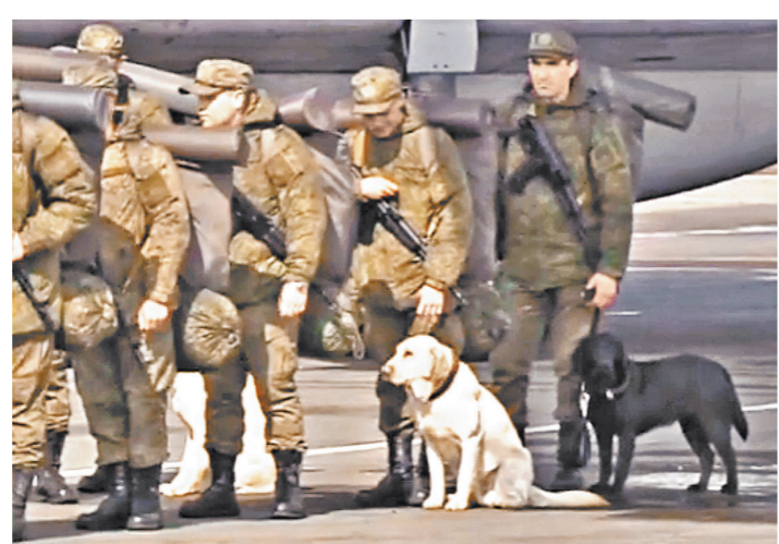
Вчера в Сирию для разминирования древнего города Пальмиры отправилась уже вторая группа наших саперов.

Пока, на взгляд, Пальмира разрушена на 70 процентов