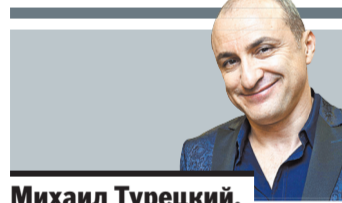
Михаил Турецкий, художественный руководитель «Хора Турецкого»:

у себя «взаимы». Многие наши граждане, которые по разным причинам не могут оплатить долги, хотя бы на машине могли бы как-то зарабатывать на жизнь, а если их лишит этой возможности, они или иждивенчески сядут на шею своим близким, или будут продолжать обрывать теми же долгами, пока не продадут последнее имущество. Что касается задолжников по алиментам, которые по законопроекту должны тоже будут лишены прав, здесь, на мой взгляд, есть и другие способы влияния. Чтобы не было бессовестных отцов, работу над совестью и сознанием нужно проводить еще со школьной скамьи. Мне кажется, в современном обществе будут уместны уроки отношения к детям, семье, нужны конкретные знания от психологов о том, как с детства воспитать настоящего мужчину. Хорошо бы давать ему возможность принимать реше-