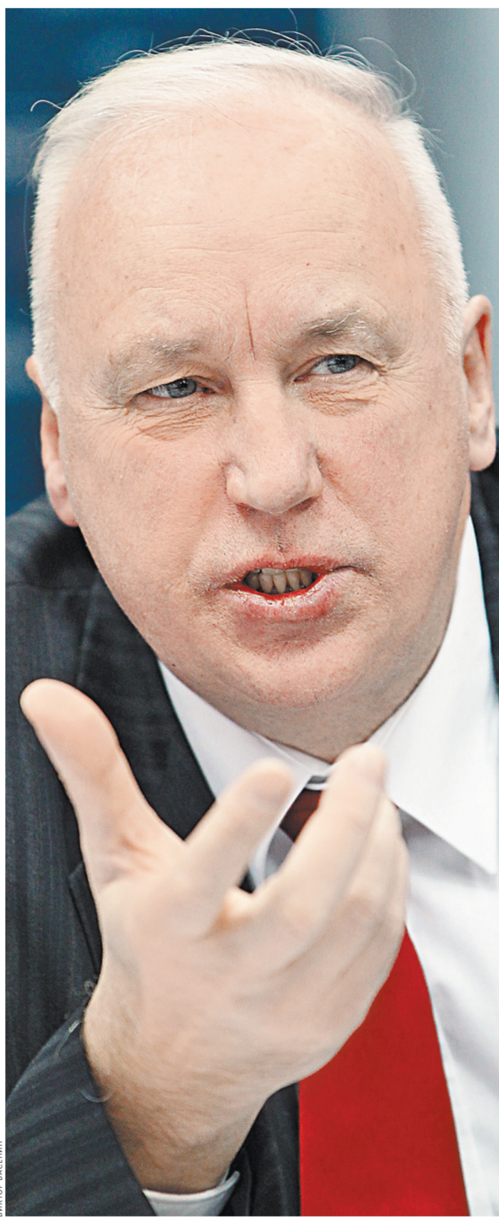
Председатель СКР: У нас есть реальная возможность пресекать любые коррупционные проявления в высших эшелонах госвласти.

Александр Бастрыкин: Завершены следственные действия по делу в отношении бывшего начальника «Дальспецстроя» Хризмана и главного бухгалтера предприятия Ашихмина, обвиняемых в злоупотреблении должностными полномочиями при строительстве космодрома Восточный.