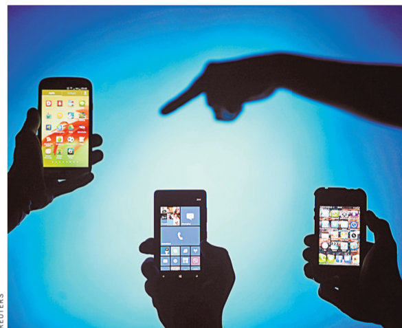
При выборе нового смартфона россияне в 2016 году будут больше обращать внимания не на бренд, а на его цену.

Названы лучшие смартфоны 2015 года — обзор на сайте www.rg.ru/art/1205925