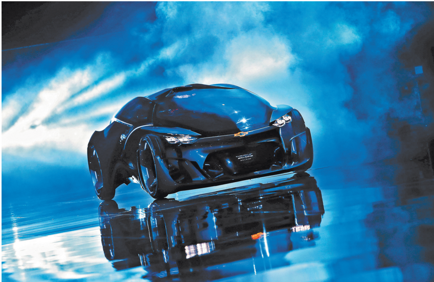
Концепт электрокара Chevrolet FNR умеет заряжать аккумуляторы дистанционно и распознает команды, данные жестами.

Второй момент касается девушек-моделей, которые, как правило, представляют машины,