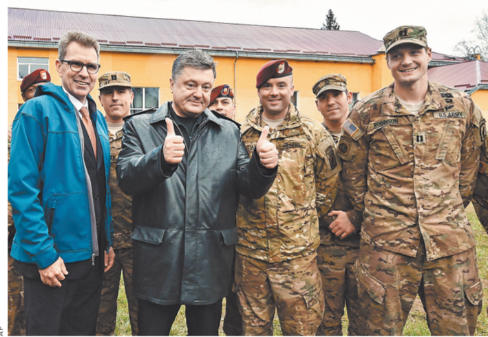
Петр Порошенко американским и украинским солдатам: «Воевать» вместе — это здорово!

Вокруг России находятся в общей сложности около 400 военных баз и объектов США и других стран НАТО