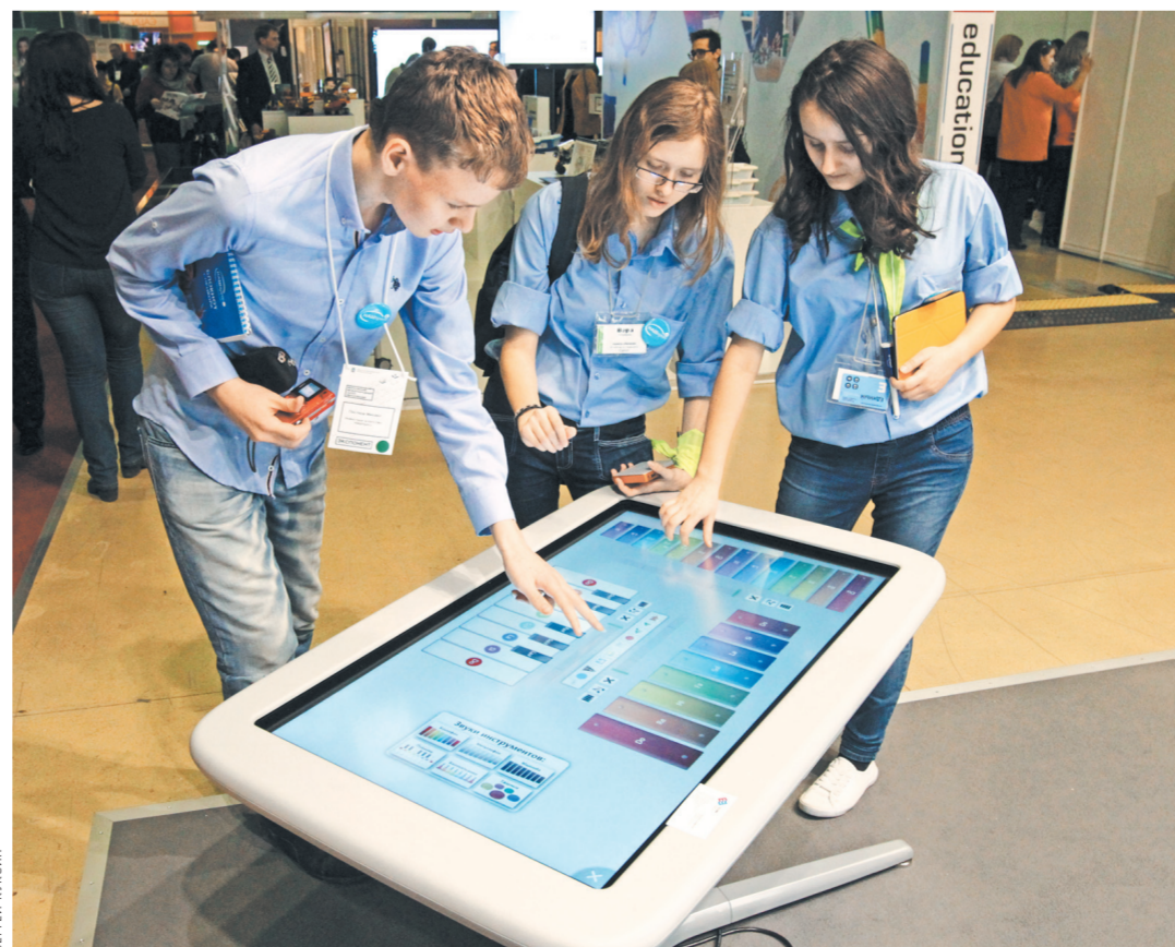
Интерактивный стол может позволить себе далеко не каждая школа: цена «кусается».