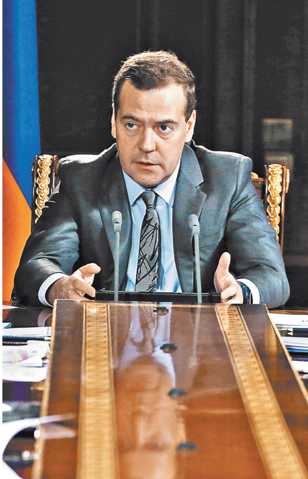
Премьер потребовал предложений, ставящих заслон пожарам.

Что же касается их призыва или непризыва в армию осенью нынешнего года, то этот вопрос в Минобороны не привязывают к конкретному времени. Корреспонденту «РГ» военные сказали, что не будут вызывать в строй местных парней до тех пор, пока обстановка в республике не нормализуется. В ведомстве прекра-