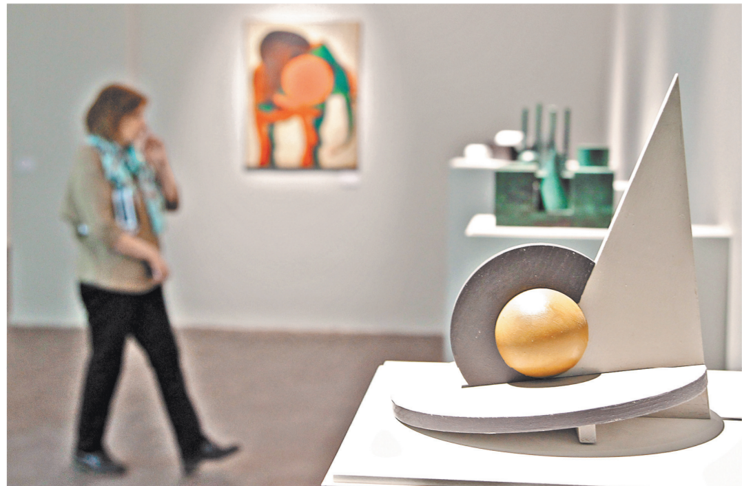
Проект нарочито лишен привкуса ностальгии, который часто сопровождает показ работ советских художников.

Немухин идет по другому пути, хотя он сам обозначает свой маршрут — «от Сезанна до Штейнберга», иначе говоря — от кубизма до метафизической абстракции. Громкие геометрические «натюрморты», призванные сделать эту метафору наглядной, похожи на конструктивистские декорации спектакля. На этом фоне полной неожиданностью оказывается предельно камерная, как бы не обязательная его игра с открытка-