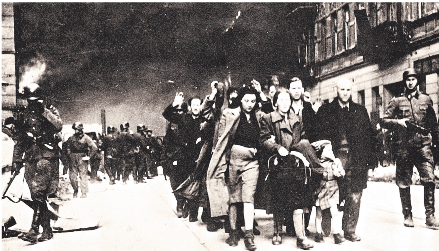
16 октября 1940 года генерал-губернатор оккупированной нацистами Польши Ганс Франк принял решение об организации варшавского гетто.

В последнее время неудачные высказывания политиков все чаще оборачиваются не просто скандалами, а выходом на межгосударственный уровень. Подтверждением тому служат и сам министр Гжегож Схетина. Достаточно напомнить хотя бы его высказывание по поводу того, что Освенцим освободили украинцы, и непонимание того, почему всегда проходит в Москве. Так что польский министр иностранных дел и американский директор ФБР одинаково «хорошо» разбираются в истории.