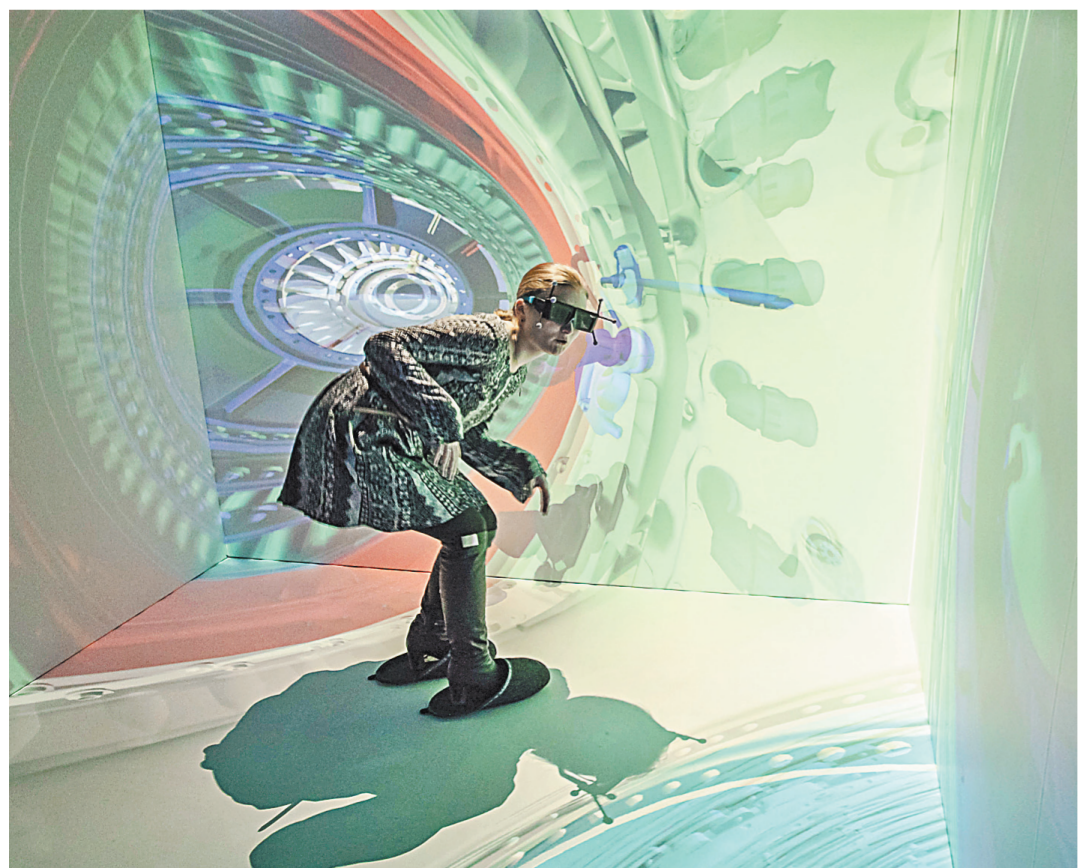
Подобные комнаты виртуальной реальности есть в политехническом университете в Сингапуре.

Основная волна начнется 25 мая и завершится 24 июня. Впервые математику разделят на базовый и профильный уровни сложности, в текстах по иностранному языку появится устная часть, а заданиях по русскому не будет «угадайки».