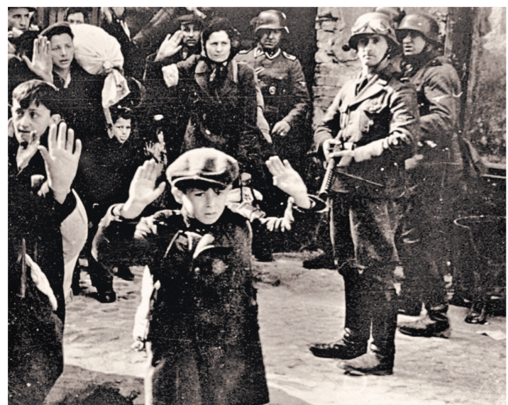
Слова директора ФБР прозвучали akurat к 72-й годовщине восстания в варшавском гетто, которое было жестоко подавлено войсками вермахта.

Несуточный скандал на линии Варшава—Вашингтон разгорелся после того, как директор ФБР Джеймс Коми пригласил Польшу к странам, ответственным за Холокост. Польские власти потребовали извинений от американской администрации и дали время до понедельника. 15 апреля директор ФБР посетил Музей Холокоста в Вашингтоне. Там он выступил с речью, в которой обязал своих сотрудников приходить в этот музей, чтобы увидеть, как «хорошие люди помогали убивать миллионы», подчиняясь идеологии нацистов. «В своем сознании убийцы и их пособники в Германии, Польше, Венгрии и многих-многих других местах не делали ничего ужасного. Они убедили себя в том, что