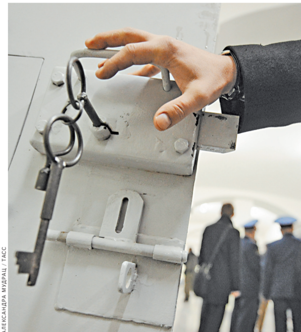
Эксперты уверены: давно пора зафиксировать в Уголовном кодексе тот очевидный факт, что время под тюремным замком течет иначе.

Вообще идея «перевода часов» в СИЗО вышла любопытная история. Законопроект был внесен в Госдуму еще в 2008 году, но там залежался. В феврале в Госдуму был внесен другой законопроект на эту же тему. Его автор более детально прописал систему зачетов. Например, день, проведенный в следственном изоляторе, предлагалось засчитывать за два дня обычной колонии и три дня колонии-поселения. Пикантность ситуации была в том, что депутат выступил с инициативой прямо из камеры следственного изолятора. Еще в прошлом году он был осужден и взят под стражу. Но приговор в силу еще не вступил, так что формально он был вправе предлагать парламенту законопроект.