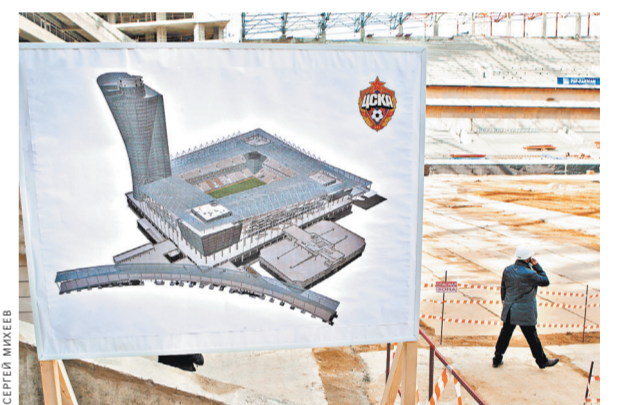
По словам мэра города, новый стадион начнет работать в начале 2016-го.

За последние два года, отметил Собянин, Москва обрела сразу несколько современных спортивных объектов — стадион «Спартак», ледовый дворец «Парк легенд». На очереди — реконструируемые «Лужники» и «Динамо».