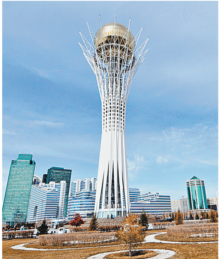
Байтерек — символ современного Казахстана. Внутри лифт на смотровую площадку, откуда открывается самый завораживающий вид на Астану.

Российское общество прекрасно понимает базовые принципы политики казахстанской власти, позволяющей ей четверть века вести страну бесконфликтно, несмотря на этническое многообразие и политическую мозаику, и потому не очень мучается вопросами: с кем нам дружить и кто победит на этих выборах? Победит, уверен, здравый смысл и наша многовековая дружба.