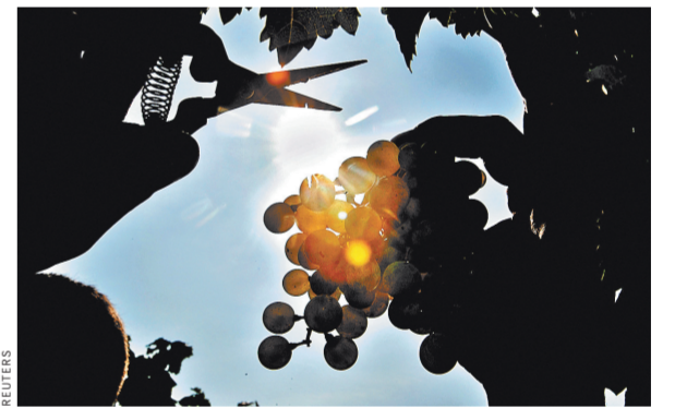
Площадь крымских виноградников сегодня чуть превышает 30 тысяч гектаров. К 2019 году их станет вдвое больше.

Сказать наверняка, во сколько потребителю обойдется напиток, пока никто не берется, так как солидный вклад в его стоимость вносит импортная составляющая. Дозу «успокоительного» винодела даст концепция развития отрасли в Крыму, которую подготовили в Союзе. Она предполагает, что через 4 года число виноградников вырастет до 75 процентов советского уровня. К тому же крымские виноделы еще не знакомы с огромным спросом россиян, но когда поймут, каковы перспективы, будут разливать напиток не только из местного винограда, но и из импортных материалов, которые соответствуют всем требованиям.