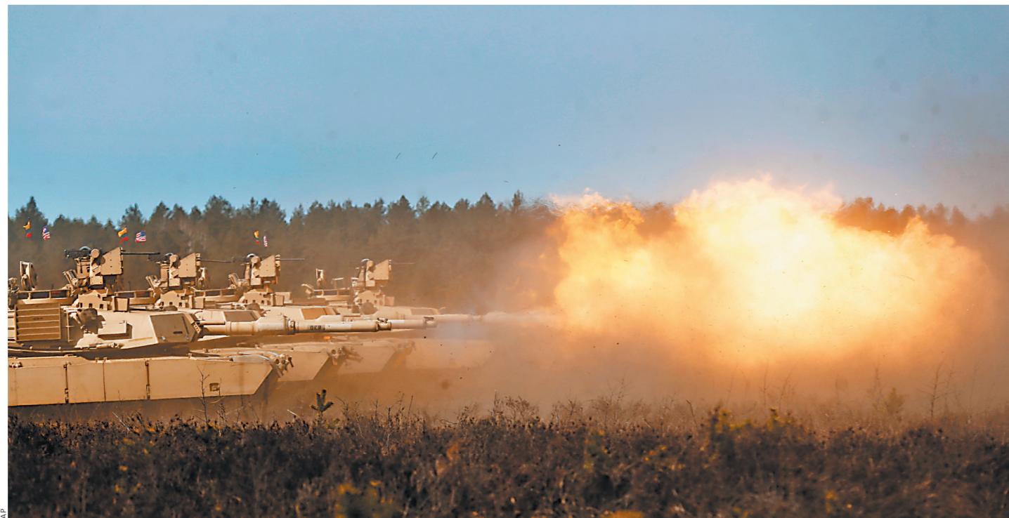
На стартовавших в Эстонии учениях местные пехотинцы противостоят четырем американским танкам «Абрамс» и двум взводам десантников из США.

СВОИ ВОПРОСЫ ВЫ МОЖЕТЕ ЗАДАВАТЬ СЕГОДНЯ, 21 АПРЕЛЯ, ВО ВТОРНИК, ПО ТЕЛЕФОНУ: 8-800-200-09-09 (БЕСПЛАТНО ИЗ ВСЕХ РЕГИОНОВ) С 10.00 ДО 12.00 ПО МОСКОВСКОМУ ВРЕМЕНИ. ВОПРОСЫ МОЖНО ПИСАТЬ ТАКЖЕ ПО ФАКСУ: (495)-257-58-52 И ЭЛЕКТРОННОЙ ПОЧТЕ: ZAVTRAK@RG.RU