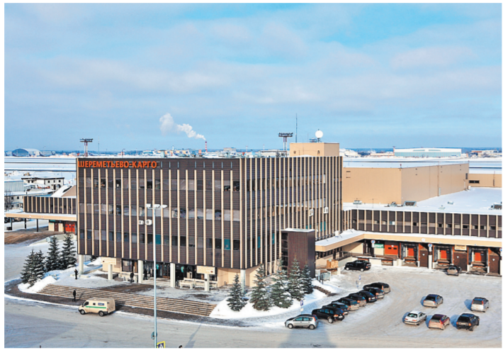
Главный административный корпус ОАО «Шереметьево-Карго» выглядит вполне современно и так же достойно, как и результаты работы самой компании.

Двадцать шесть лет назад благодаря росту коммерческих авиаперевозок в аэропорту Шереметьево была создана новая акционерная грузовая компания — ОАО «Шереметьево-Карго». Ее специалисты подошли к делу новаторски: предпринимать с таким уровнем компьютеризации и автоматизации, на котором даже грузчик не мыслит своей работы без смартфона, не только в России, но и за рубежом надо еще пои-