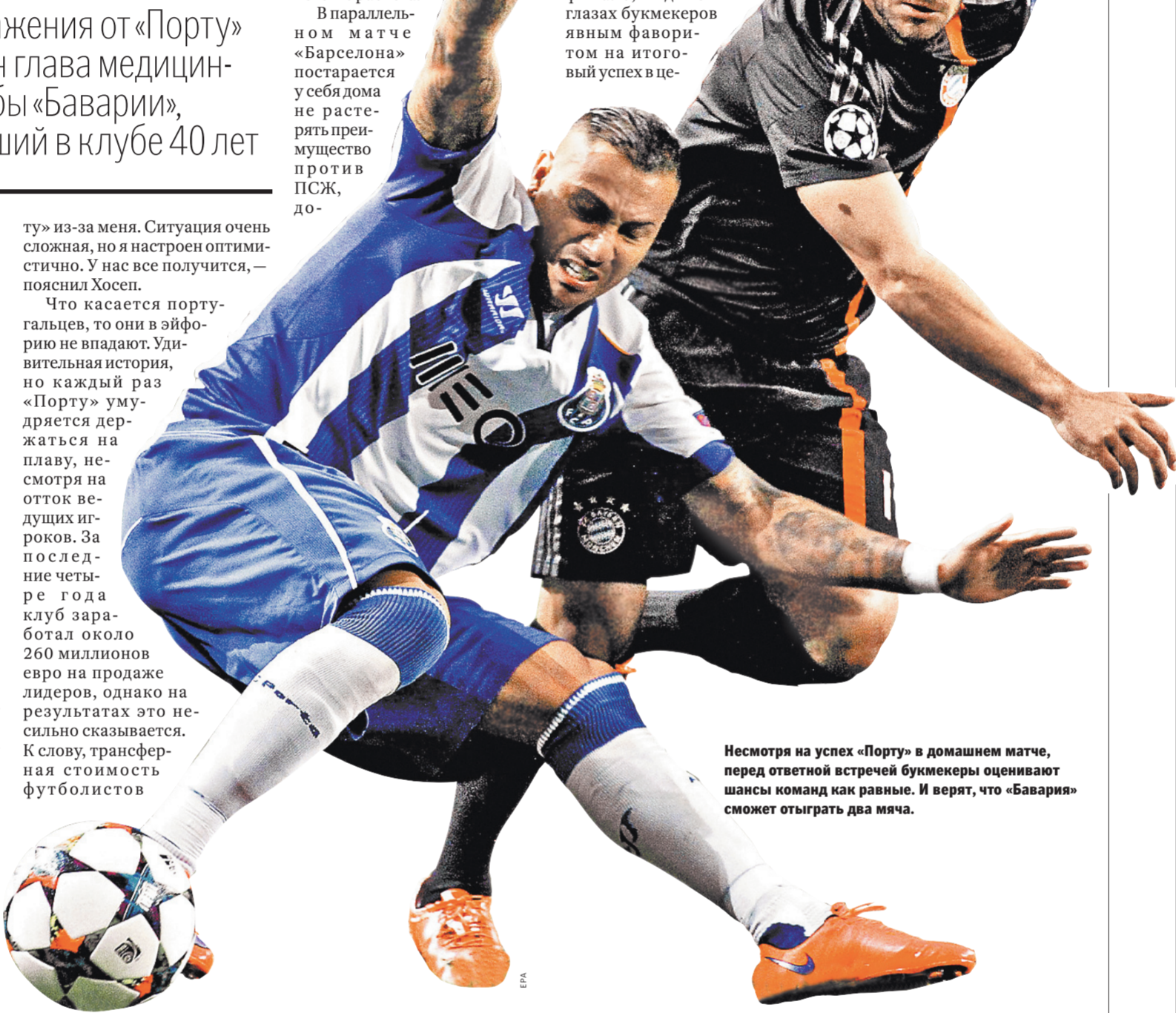
Несмотря на успех «Порту» в домашнем матче, перед ответной встречей букмекеры оценивают шансы команд как равные. И верят, что «Бавария» сможет отыграть два мяча.

Следите за игрой на сайте www.rg.ru/sujet/5259