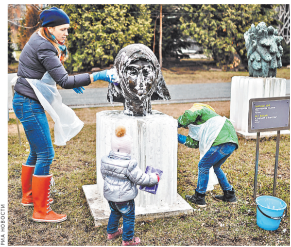
В первом столичном субботнике, прошедшем 18 апреля, приняли участие более 1,3 миллиона горожан.

Напомним, что оставить жалобу можно по телефону «горячей линии» ОАТИ: 8-499-264-96-81 или написав по адресу: www.gorod.mos.ru.