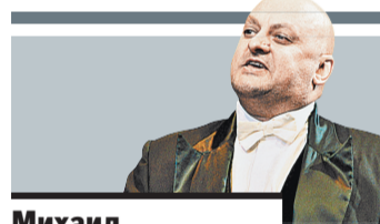
Михаил Церишенко актер, юморист

ОХРАННИКИ выполняют свою роль, когда они в отличной физической форме. Проблема в том, что часто среди охранников наблюдаются дяденьки предпенсионного возраста или даже совсем старики.