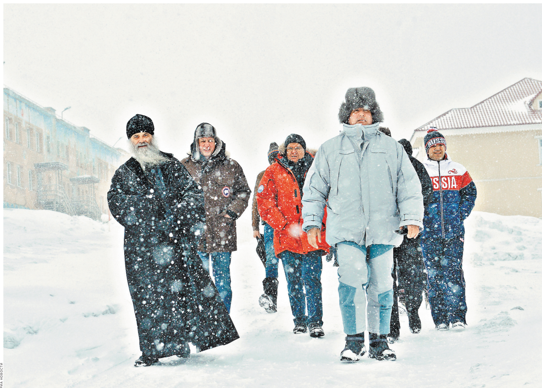
Делегация российских чиновников, отправившаяся в минувшие выходные открывать новую дрейфующую арктическую станцию «Северный полюс-2015», по дороге на вершину планеты остановилась в городе Баренбург на архипелаге Шпицберген. Вице-премьер России Дмитрий Рогозин (справа на переднем плане) и епископ Нарьян-Марский и Мезенский Иаков (слева на переднем плане) вместе со своими спутниками осмотрели поселок в российской части архипелага, шахту предприятия «Арктикуголь», аэропорт и музей.

Библиотека ИНИОН в Москве располагает одной из крупнейших в России коллекций книг на славянских языках. По данным на 2014 год, в ее фондах насчитывалось 14,2 млн единиц хранения, из них 6 млн книжных изданий, в том числе редкие книги XVI—начала XX веков, более 450 тыс. монографий и диссертаций. Как сообщила ранее пресс-служба ИНИОН РАН, в результате пожара реальные потери книжного фонда фундаментальной библиотеки ИНИОН оцениваются в 2,32 млн экземпляров, что составляет 15,7 процента фонда литературы.