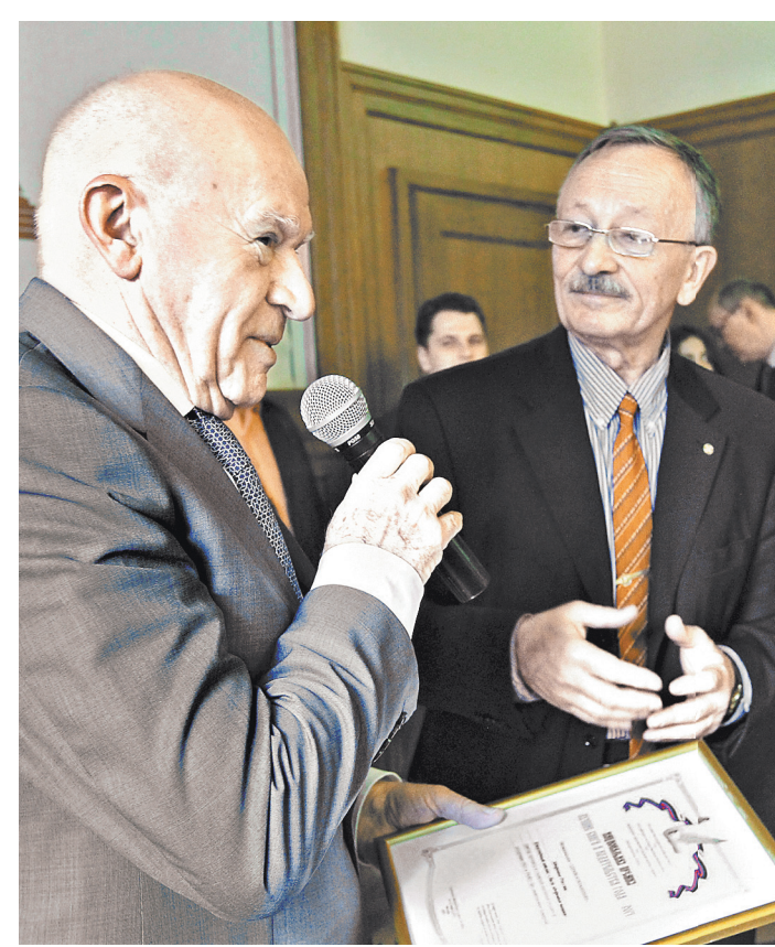
Лео Бокерия и Святослав Рыбас представили 10-е издание атласа «Здоровье России».

сколько у него народа в тюрьмах сидит, а сколько болеет. «Будет здоровье, — считает Лео Бокерия, — будет и народ».