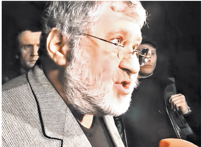
Победитель майдана Коломойский показал свободной украинской прессе ее место.

Отступать, судя по всему, Коломойский не собирается. Не случайно подконтрольные ему СМИ начали пугать Киев беспорядками в Днепрпетровске в случае отставки губернатора, и появилась информация о том, что в Приват-банке заблокированы счета предприятий Порошенко на 50 миллионов долларов. Позже этот информационный «вброс» был косвенно подтвержден украинскими финансистами — счета действительно были заблокированы, но это якобы объясняется сбоями в банковской системе. Сейчас Порошенко может свободно распоряжаться своими деньгами. Но, судя по тому, откуда информация исходила — это недвусмысленный намек Порошенко со стороны Коломойского о том, как дальше будет продолжаться конфликт.