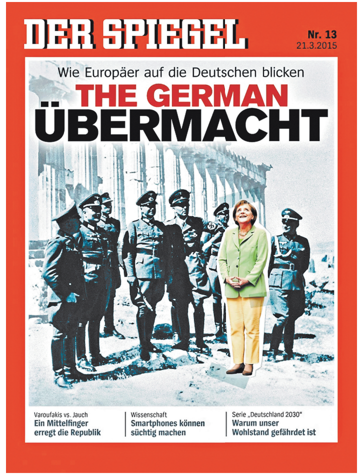
Заголовок обложки гласит: «Германская супердержава. Как европейцы смотрят на немцев».