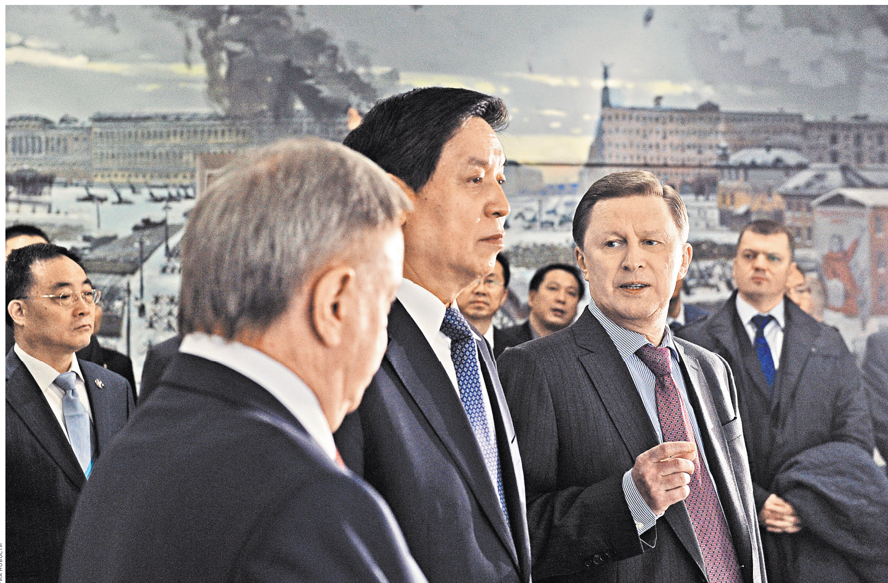
Глава президентской администрации Сергей Иванов и его китайский коллега, глава аппарата ЦК КПК Ли Чжаньшу, посетили музей Великой Отечественной войны. Как подчеркнул Иванов, лживые заявления о том, что советских солдат во время Второй мировой войны встречали не как освободителей, а как оккупантов, легко опровергаются документально.

посол добавил, что его страна готова в будущем оказывать помощь Украине в решении энергетических проблем, когда Турция осуществит планы по строительству у себя регионального энергетического хаба после введения в строй таких проектов, как TANAP и «Турецкий поток». Напомним, что новые киевские власти не в первый раз обращаются с просьбой пропустить их СПГ-танкеры через Босфор. Летом 2014 года они также попытались договориться о проходе судов со сжиженным газом, при этом желая организовать постоянные поставки в объеме до 10 миллиардов кубометров в год для газораспределительной станции, которую планируется построить в районе Одессы. В 2014-м этот вопрос обсуждался на уровне председателей парламентов двух стран, ответ также был отрицательным. Проход через Босфор судов с опасными грузами, куда входит и сжиженный газ, проблема для Турции весьма серьезная. По статистике, более 50 процентов танкеров, проходящих через турецкие проливы, несут опасные и очень опасные грузы. Так, в декабре 2014 года 82-мегагонный алжирский СПГ-танкер, перевозивший газ для нужд Турции, испытал трудности при проходе через Дарданеллы, что стало причиной паники. Турецкие власти перекрыли судоходное движение через проливы на 13 часов. Эксперты утверждают, что в случае аварии подобного танкера мощности взрыва хватило бы, чтобы вызвать гигантскую волну, что в условиях проливов могло привести к страшным последствиям.