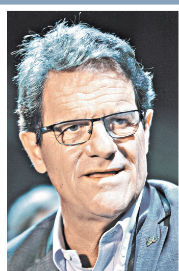
Фабио Капелло готов на кадровые эксперименты, но после матча с Черногорией.