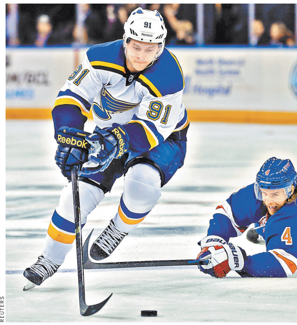
Владимир Тарасенко проводит блестящий сезон в «Сент-Луисе» и вряд ли освободится к чемпионату мира.

Зато все идет к тому, что сборная России на перенесенной планете будет располагать едва ли не сильнейшей вратарской линией. Во-первых, практически потерял шансы на выход в плей-офф «Колумбус», ворота которого защищает Сергей Бобровский. «Жакеды» выступили так неудачно во многом из-за того, что наш голкипер довольно много пропустил из-за травм. Весьма туманными перспективами и «Колорадо». Команду едва ли не в одиночку танет в плей-офф наш вратарь Семен Варламов, однако его усилить может и не хватить. Среди тех, с кем тренерский штаб сборной России может связываться уже сейчас, — Александр Семин и Ниль Якупов. Их «Каролина» и «Эдмонтон» точно не сыграют в матчах на вылет.