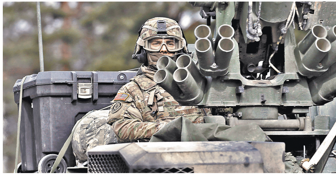
300 американских военных и 40 единиц боевой техники из США задействованы в учениях в Эстонии.