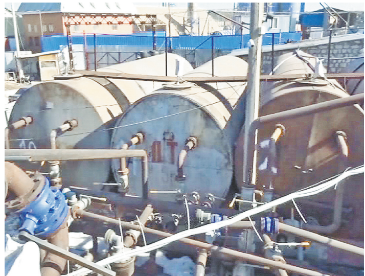
Именно так был устроен этот нефтеперерабатывающий заводик.

И еще одна поправка в правила. Теперь школьным автобусам разрешат двигаться по выделенным полосам для общественного транспорта. Во-первых, выводится такой термин, как «школьный автобус», доставляющий детей от дома до школы и обратно. Во-вторых, он должен соответствовать требованиям технического регламента Таможенного союза.