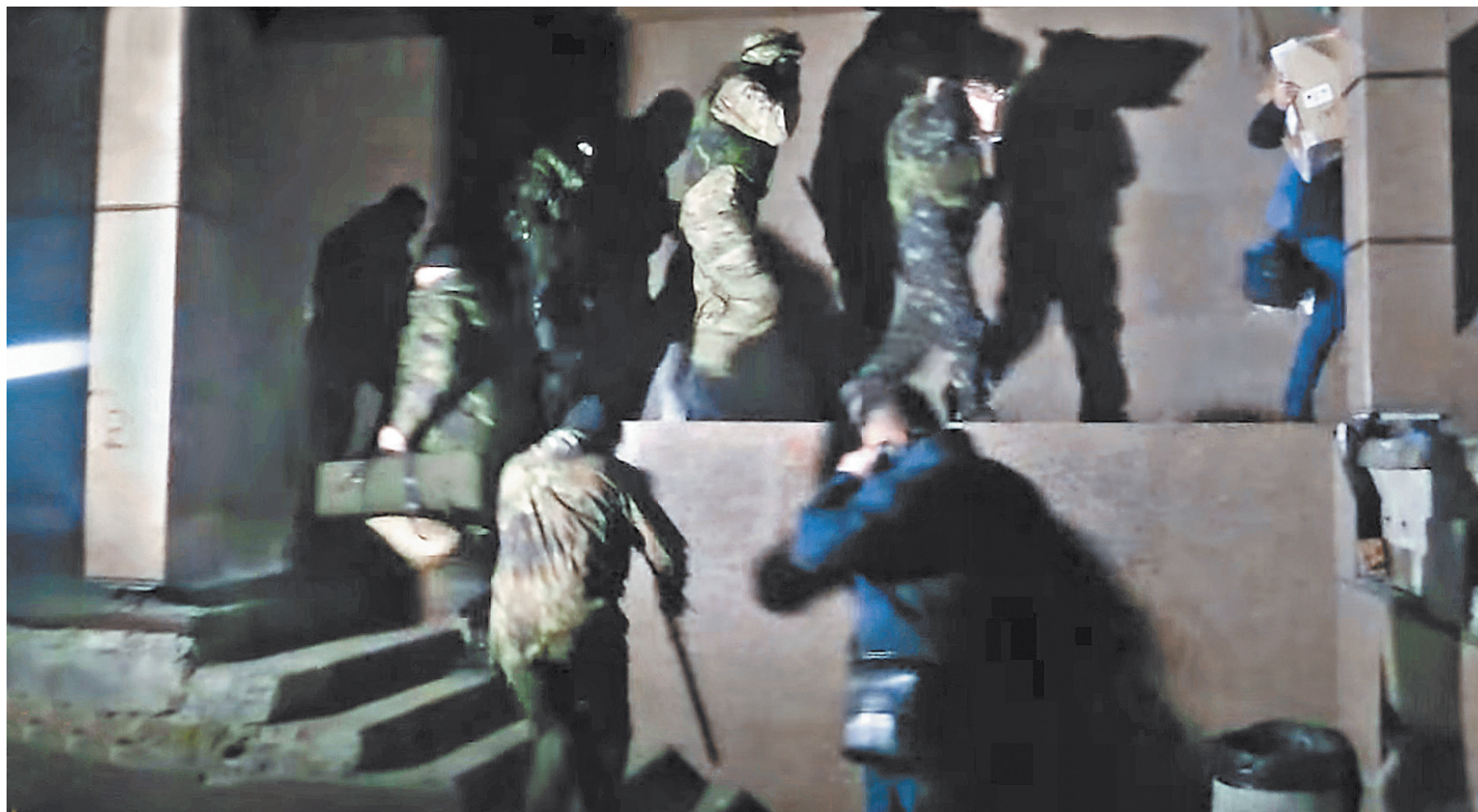
«Охрана» олигарха Коломойского беспрепятственно зашла в офис государственной компании «Укртранснефт» с черного входа.

Столкновение Порошенко и Коломойского было предсказуемым и неизбежным — об этом уже скоро год как пишут в газетах и рассуждают украинские политики. Слишком выветривается из президентской концепции «единой Украины» и его бизнес-стратегии этот деятель, сделавший заявку на весь юг и центр страны. И то, почему конфликт перешел в горячую