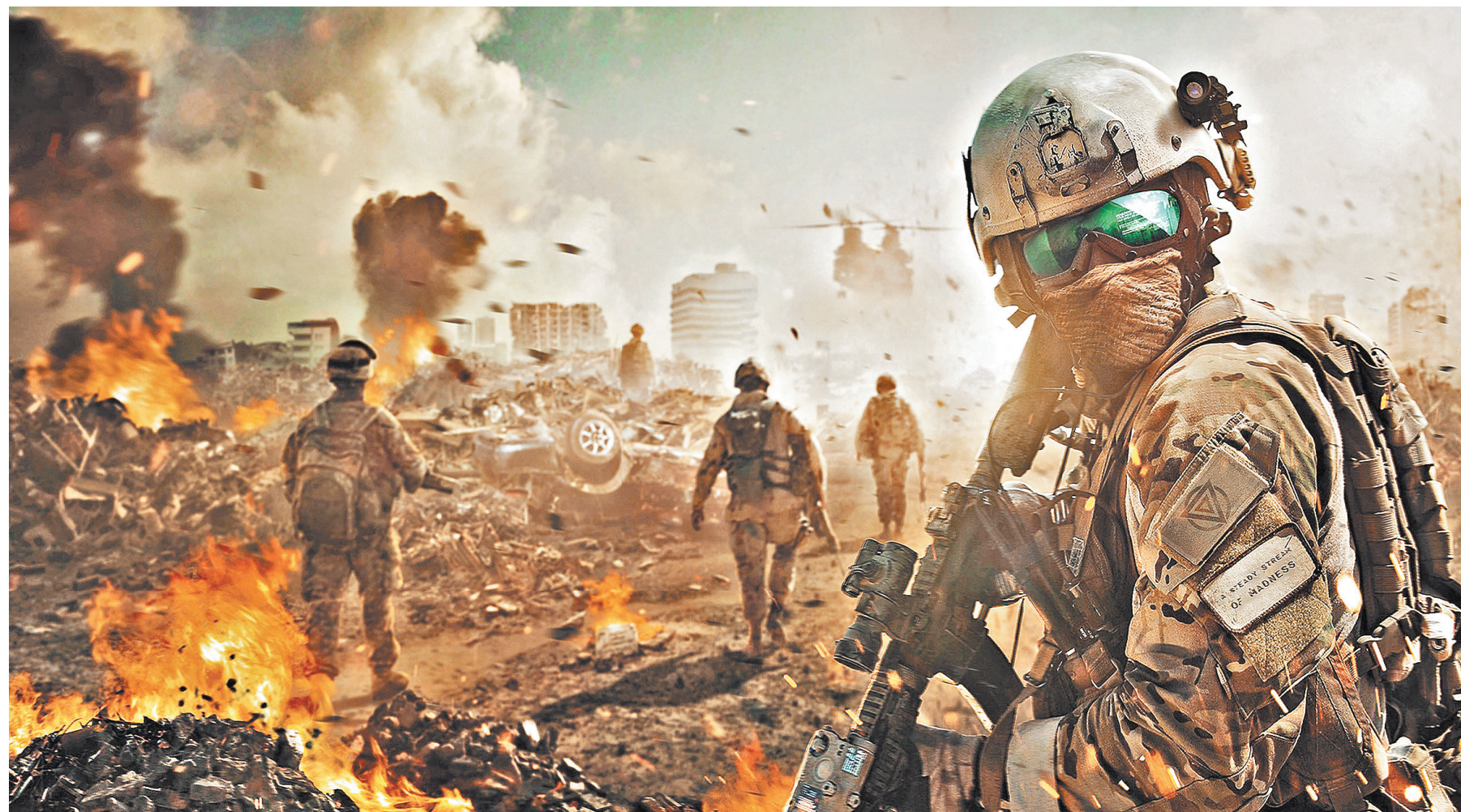
Практика показывает, что воевать в виртуальном пространстве и в реальности — это не одно и то же.

А как тогда рекламировать военную технику? Против кого и чего она должна использоваться? И было достигнуто джентльменское, никак официально не оформленное соглашение, по которому в качестве врагов должны изображаться некие международные террористы. Они якобы представляли военную угрозу всем странам планеты. Смешно сказать, проводились масштабные военные учения, в которых теоретическими и очень серьезными противниками выступали некие террористические группы. Против них использовался весь военный арсенал, кроме стратегических ядерных сил. Накаркали... Появилось целое террористическое государство «ИГ». А как ре-