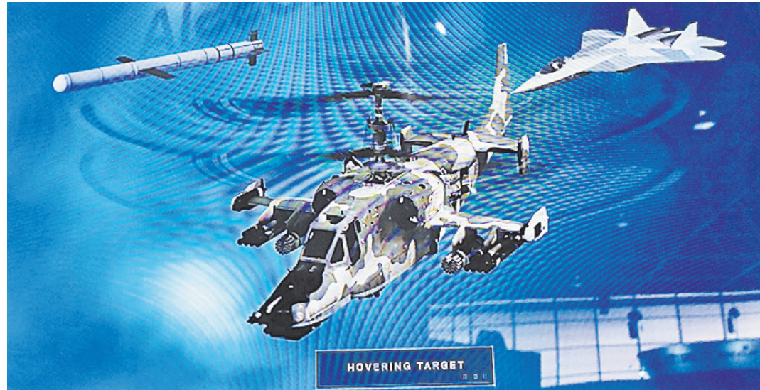
Некоторые фирмы воюют на экране со старой техникой, некоторые — с новой. Но именно с российской.

Огромный телеэкран с этим виртуальным бредом был напротив стенда «Рособоронэкспорта». А там тоже был свой экран. И на нем летал Ка-52, правда, никакого сбивания. Возникла интересная коллизия. Россия продвигает некую боевую технику. А Запад говорит: продвигайте, продвигайте, мы ее все равно уничтожим. Международная промышленная группа THALES, штаб-квартира которой находится во Франции, совсем недавно имела прекрасные отношения с российской обороной. Дело дошло до реализации на мировом рынке вооружений весьма интересных сов-