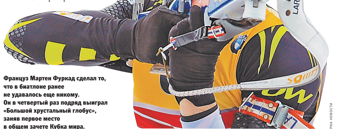
Француз Мартен Фуркад сделал то, что в биатлоне ранее не удавалось еще никому. Он в четвертый раз подряд выиграл «Большой хрустальный глобус», заняв первое место в общем зачете Кубка мира.

В воскресенье масс-старте успех праздновала немка Лаура Дальмайер, серебряный призер чешка Габриэла Соукалова проиграла ей семь секунд, третьей финишировала двукратная чемпионка мира-2015 французка Мари Дорен-Абер. А Домрачева впервые стала победительницей общего зачета Кубка мира, отобрав это звание у финской спортсменки Кайсы Мякярйянен, которая на этот раз осталась на втором месте. Лучшая из россиянок Екатерина Глазырина