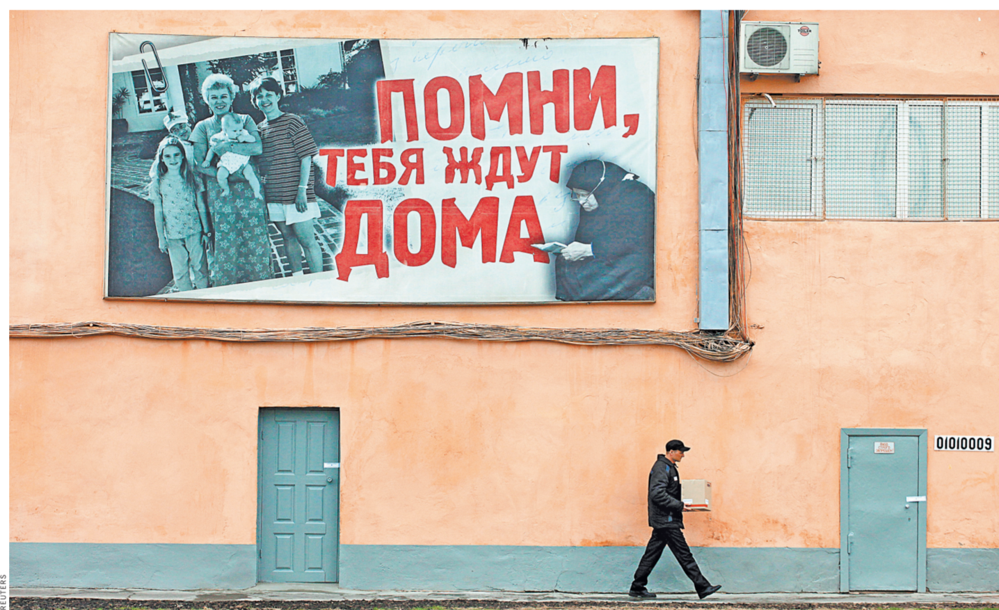
Новый закон даст человеку шанс не ломать свою биографию тюрьмой и судимостью, а исправить ошибки.