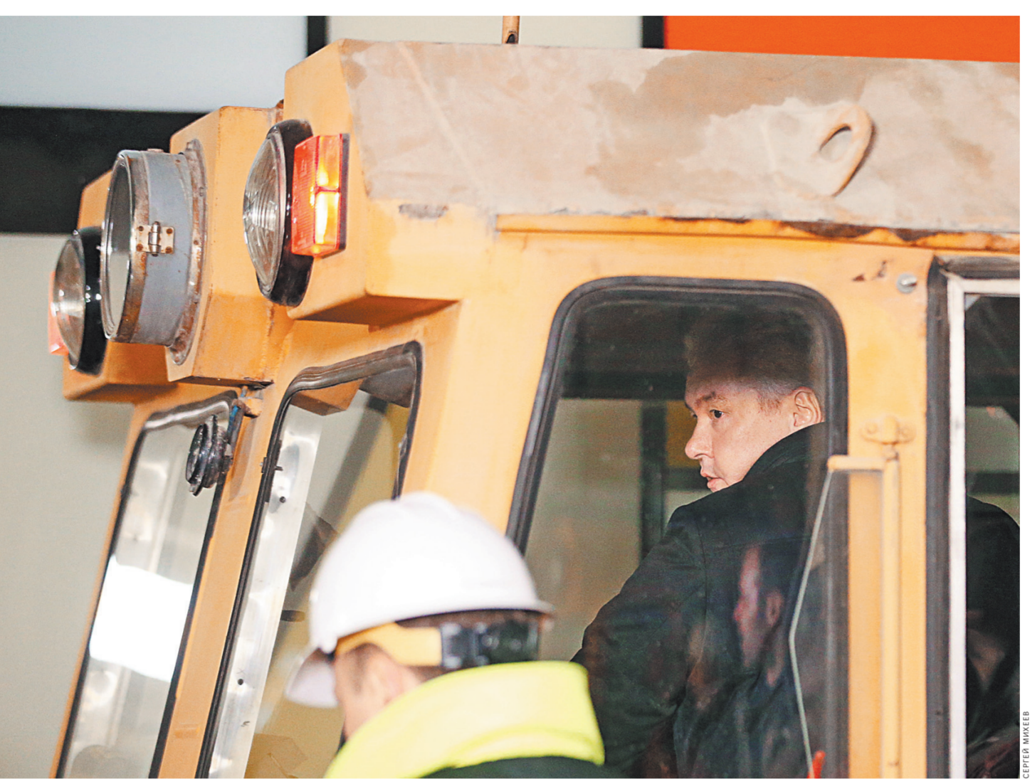
Сергей Собянин проехал по тоннелю от Тропарево до Румянцево и Саларьево.