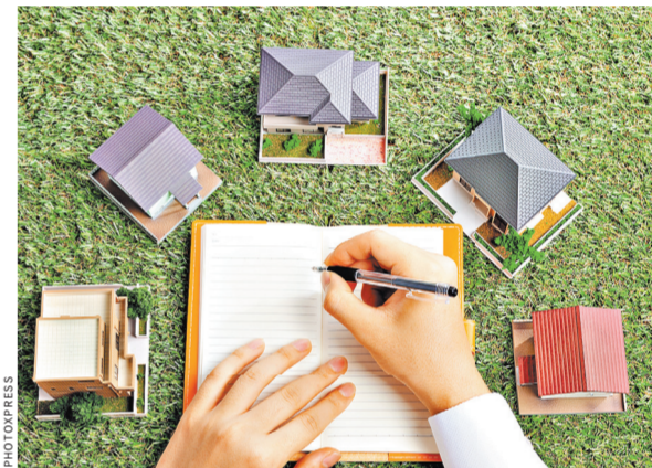
«Черный список» для бизнесменов, раскрывших иностранные активы, составлять не будут.