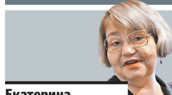
Екатерина Вильмонт писательница

САМОЙ читающей страной в мире не зря считался Советский Союз. Людей с книгами в руках можно было увидеть, наверное, чаще, чем тех, кто сегодня держит мобильные телефоны. Всегда было, о чем поговорить. Сегодня эта эпоха канула в Лету, потому что изменились составляющие, на которых строится общество: интересы, уровень занятости и технический прогресс. Главной причиной угасающей любви к чтению