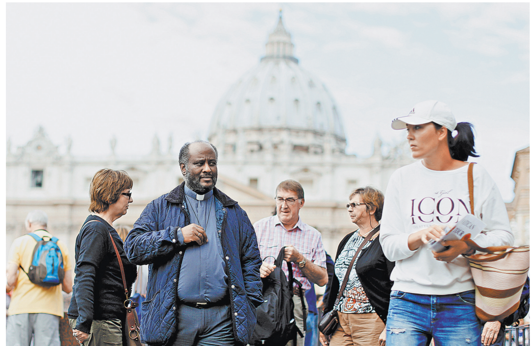
Защитник беженцев Мусса Зераи — один из фаворитов в списке претендентов на Нобелевскую премию мира.

Видео: Российские корабли нанесли удар по ИГ www.rg.ru/art/1173180