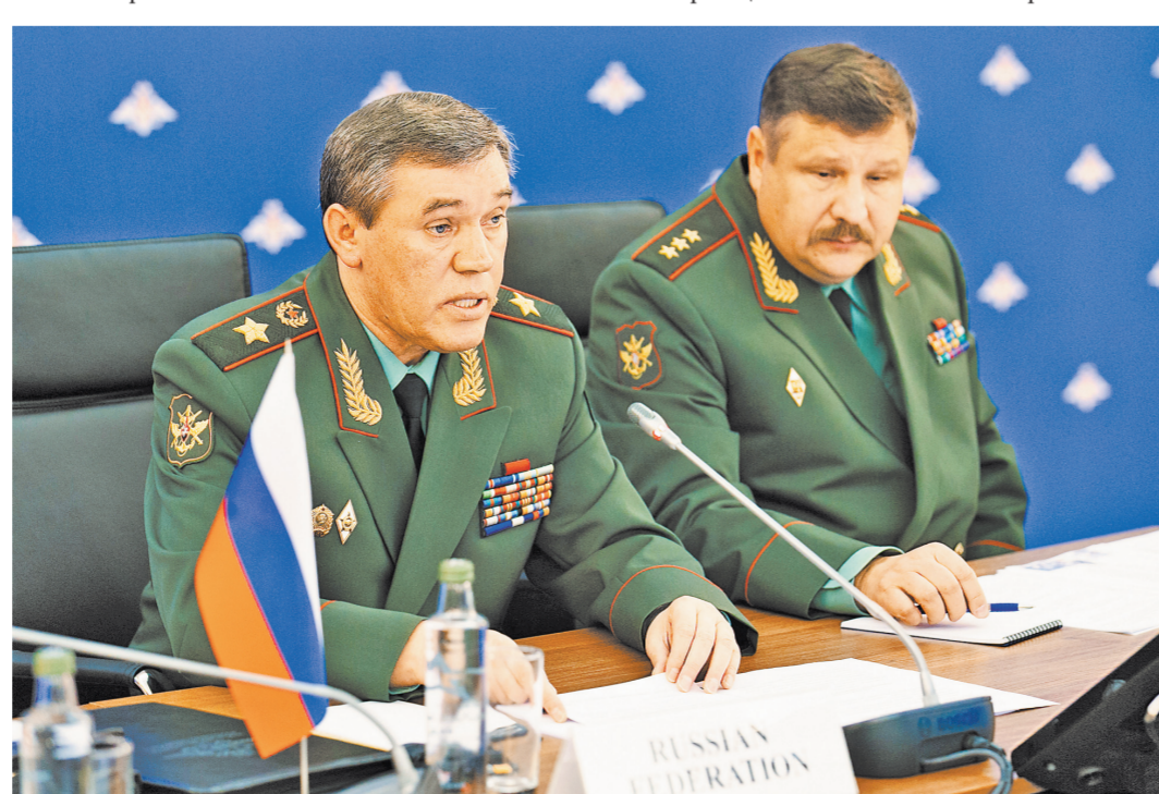
Начальник Генштаба Валерий Герасимов: Сегодня в Афганистане находится от 2 до 3 тысяч боевиков ИГИЛ.

Валентина Матвиенко и сама убедилась в том, что в Кении есть, что посмотреть — она посетила национальный парк (всего в стране их 59), а также питомник для детенышей диких животных, оставшихся без родителей.