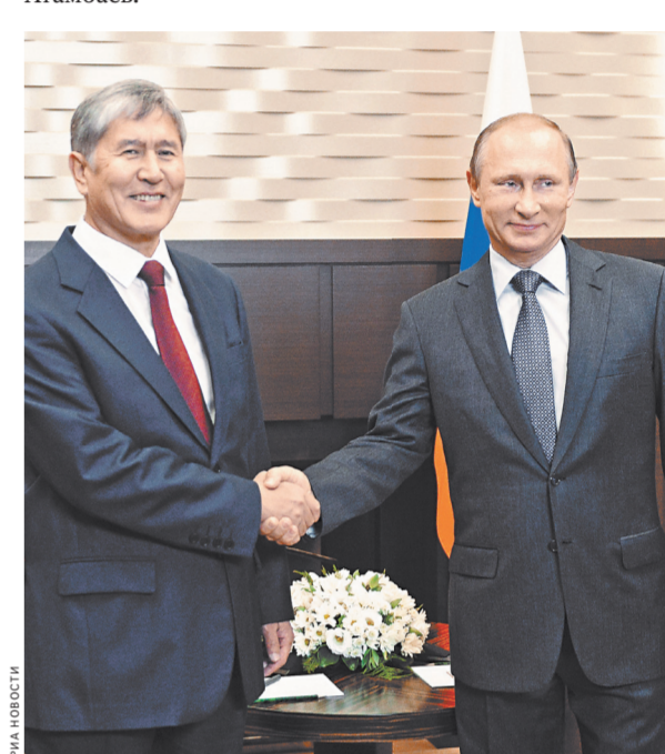
Владимир Путин поздравил Алмазбека Атамбаева, новому составу парламента и всему Киргизстану процветания и исполнения намеченных планов.

Они, по мнению Путина, «были проведены на самом высоком уровне, по всем канонам и традициям демократических стран, и это полностью согласуется со всеми требованиями международных организаций».