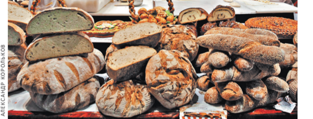
Выставка убедительно продемонстрировала, что санкции Запада оказались полезными для российского агропромышленного комплекса — он на подьеме.