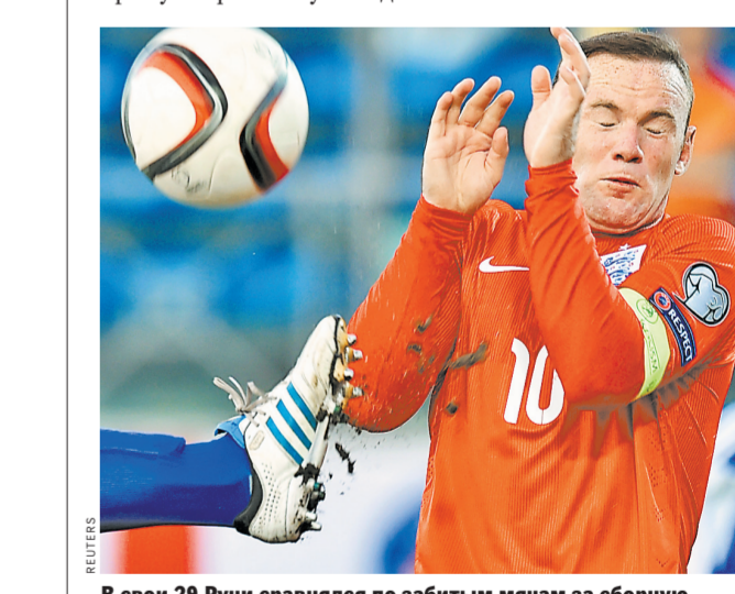
В свои 29 Рунни сравнялся по забитым мячам за сборную с легендарным Бобби Чарльтоном.

9 октября Лихтенштейн—Швеция, Молдавия—Россия, Черногория—Австрия, 12 октября Австрия—Лихтенштейн, Россия—Черногория, Швеция—Молдавия