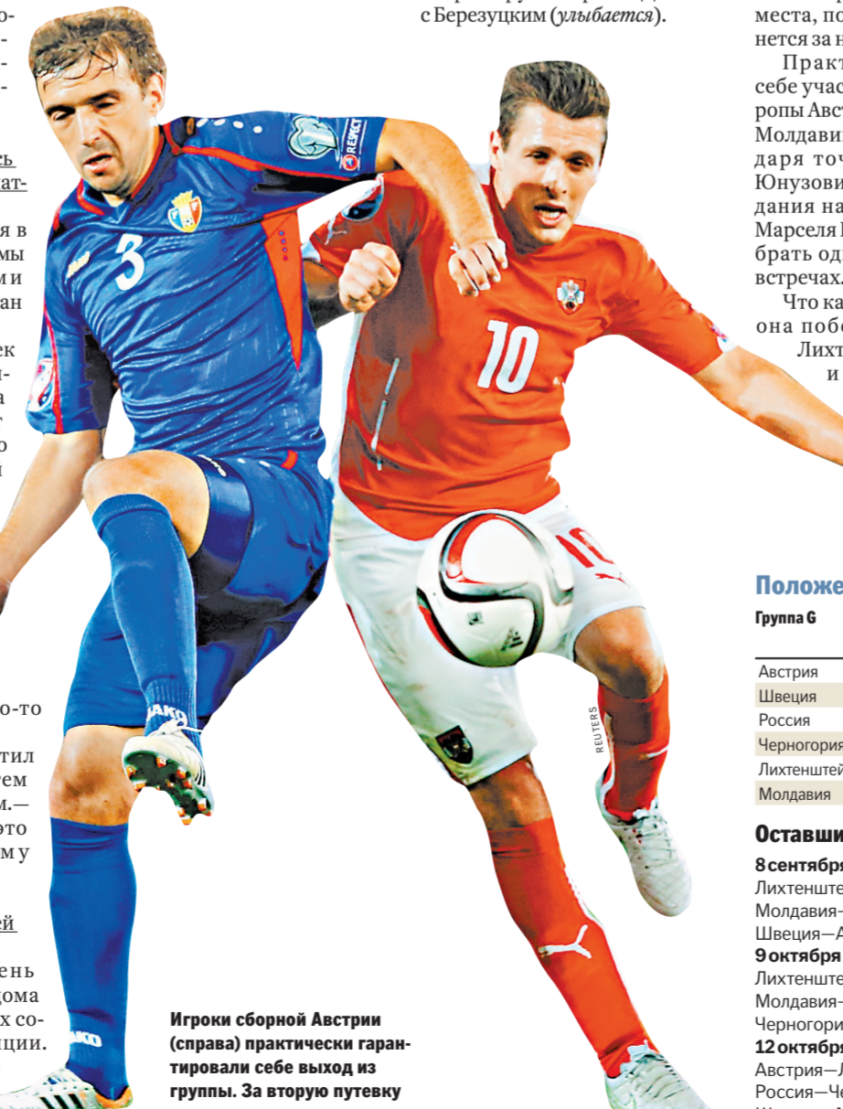
Игроки сборной Австрии (справа) практически гарантировали себе выход из группы. За вторую путевку спорят россияне и шведы.

Принципиальная игра прошла во Франкфурте, где сборная Германии взяла реванш у поляков и победила их со счетом 3:1. Напомним, в октябре прошлого года Роберт Левандовски и компания достаточно неожиданно переиграли действующих чемпионов мира (2:0) и до нынешней встречи удерживали лидерство в группе D. Дубль Марио Гетце и точный удар Томаса Мюллера позволили бундестим обогнать Польшу на два очка. Начало отборочного цикла было неудачным, но у нас много молодежи, которой нужно было время. Германия полностью доминировала в сегодняшней игре, хотя нам пришлось навернывать после гола Левандовского... В свою очередь Гетце подчеркнул: немцам принципиально занять первое место в группе. Мы могли решить все вопросы еще до перерыва, но в итоге допустили глупую ошибку, когда забивал Левандовски. Не сомневаемся, мы выполним задачу и финишируем на первой строчке, для нас это очень важно. Дия полузащитника «Баварии» второй гол в ворота поляков стал 15-м за сборную, и по этому показателю он обогнал Франца Беккенбауэра, Юппа Хайнкеса и Маттиаса Заммера.