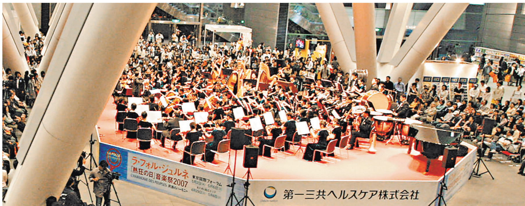
В дни фестиваля весь город превратится в концертный зал.