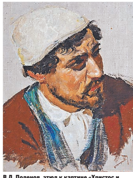
В.Д. Поленов, этюд к картине «Христос и грешница».