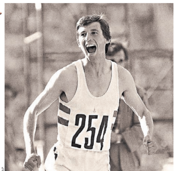
Таких радостным еще не лорд и даже не сэр, а просто Себ Коэ был в Москве, где он проявил себя королем Олимпиады-80 — правда, на тяжелых средних дистанциях.

КСТАТИ Участникам чемпионата мира будут помогать 2800 волонтеров. 300 работников Оргкомитета мирового первенства уже заняли свои места на стадионе «Лужники». В Пекине жарко и для всех членов легкоатлетической семьи завезено 1 миллион 116 тысяч минералки. — ТВ трансляции будут вестись с помощью 113 телекамер.