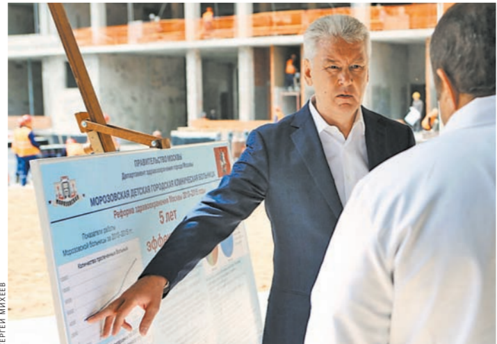
Сергей Собянин: Мало ремонтировать существующие здания и строить новые. Больницам нужно достойное финансирование.

На 10%, по словам мэра, увеличится подушевое финансирование и поликлиник. В общей сложности горбюджет направит на это в фонд ОМС 6,2 млрд руб. В нынешних условиях это позволит Москве сохранить тренд роста качества и доступности медпомощи.