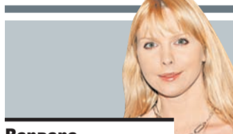
Варвара певица, заслуженная артистка России

НЕСМОТЯ на мое безграничное уважение к правоохранительным органам, надо признать, что иногда они могли бы работать и лучше. Около года назад я стала невольной свидетельницей избивания парня, причем недалеко от участка. Однако полиция за него почему-то не вступилась, хотя была в курсе происходящего. Возможно, этому могло быть рациональное объяснение, но осадок на душе все-таки остался. К