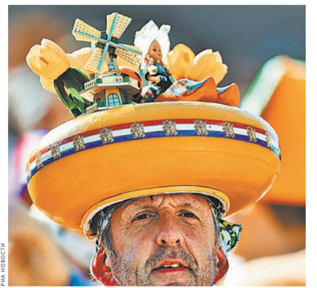
Голландцы не боятся насекомых-вредителей в цветах и украшают ими шляпы, но для россиянина это чревато аллергией.

Заменить голландские цветы российскими можно за пять месяцев — подробнее читайте на сайте www.rg.ru/art/1151449