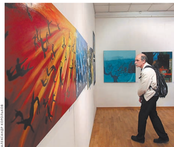
При всех разногласиях художники сходятся в гегелевской мысли о том, что и Восток, и Запад присущи каждой вещи.