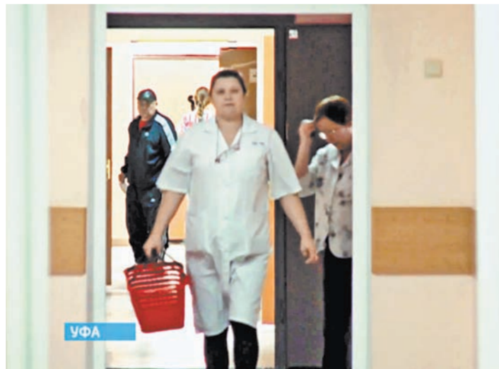
Персонал уфимского роддома так и не смог объяснить, зачем в медучреждении вель «слежка» за пациентками.