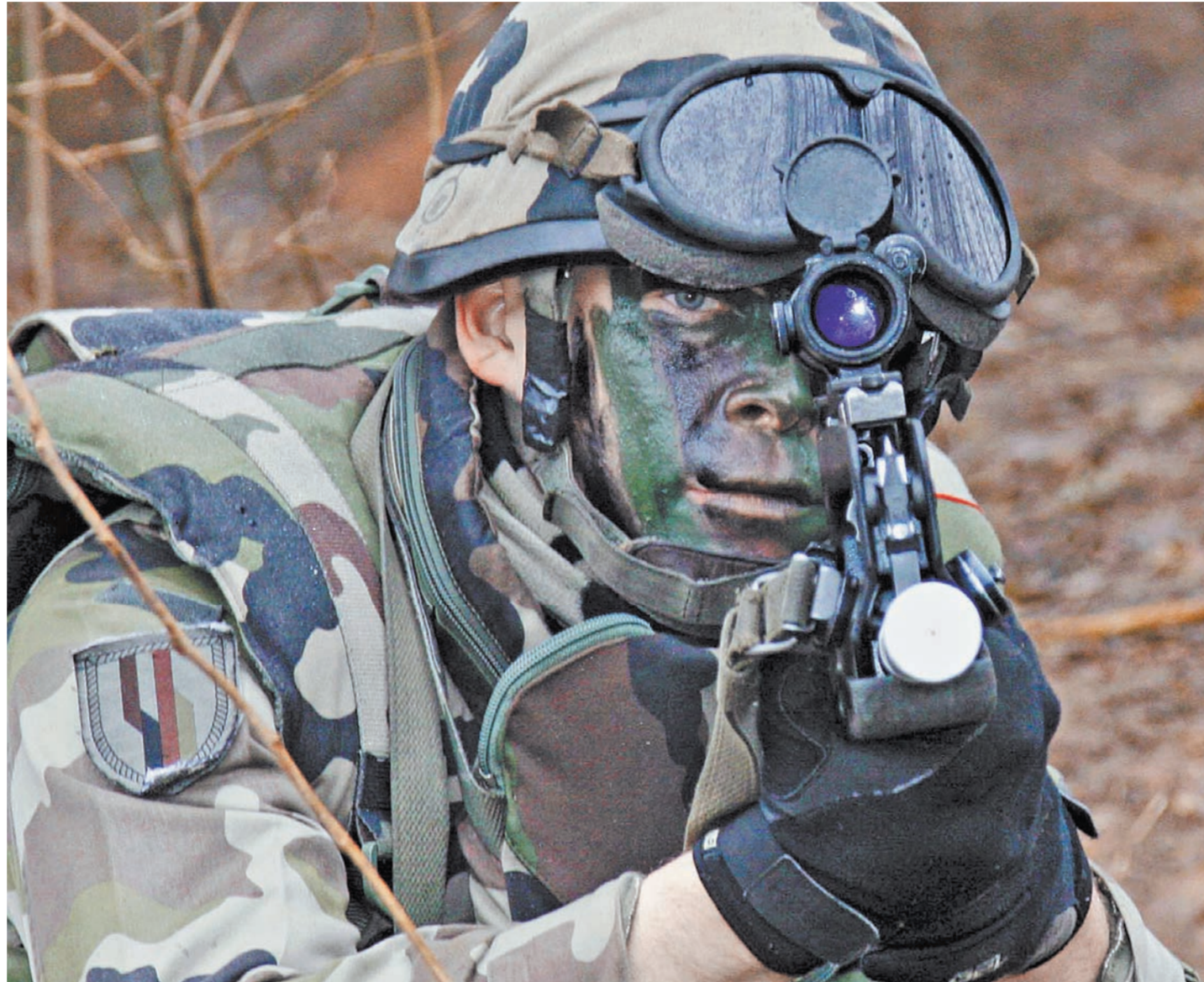
В учениях под кодовым названием «Быстрое реагирование-15» принимают участие около 4,8 тысяч военнослужащих из 11 стран — членов НАТО.

В Вашингтоне уточняют, что такое большое количество американских военных в Европе в последний раз было задействовано в ходе «мировотворческой операции в Косово» в 1999 году. Представители Пентагона официально признали то, что воздушные учения действительно являются крупнейшими в Европе со времен окончания «холодной войны» и заявили о том, что «военные маневры Swift Response демонстрируют готовность альянса