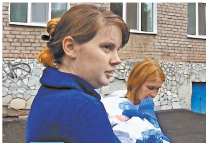
Одна из молодых мам рассказала башкирским тележурналистам, что во время родов заметила видеокамеру.

— Съемка проводилась несанкционированно, камеры обнаружил администрация самого роддома случайно, после чего руководство обратилось в полицию. Министерство здравоохранения республики инициировало служебную проверку, — прокоммен-