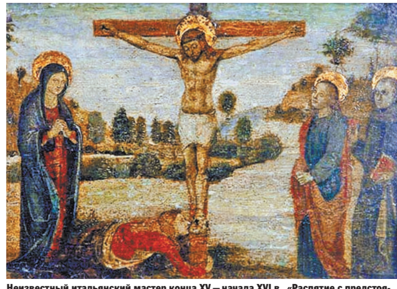
Неизвестный итальянский мастер конца XV — начала XVI в., «Распятие с предстоящими и святым Франциском Ассизским».