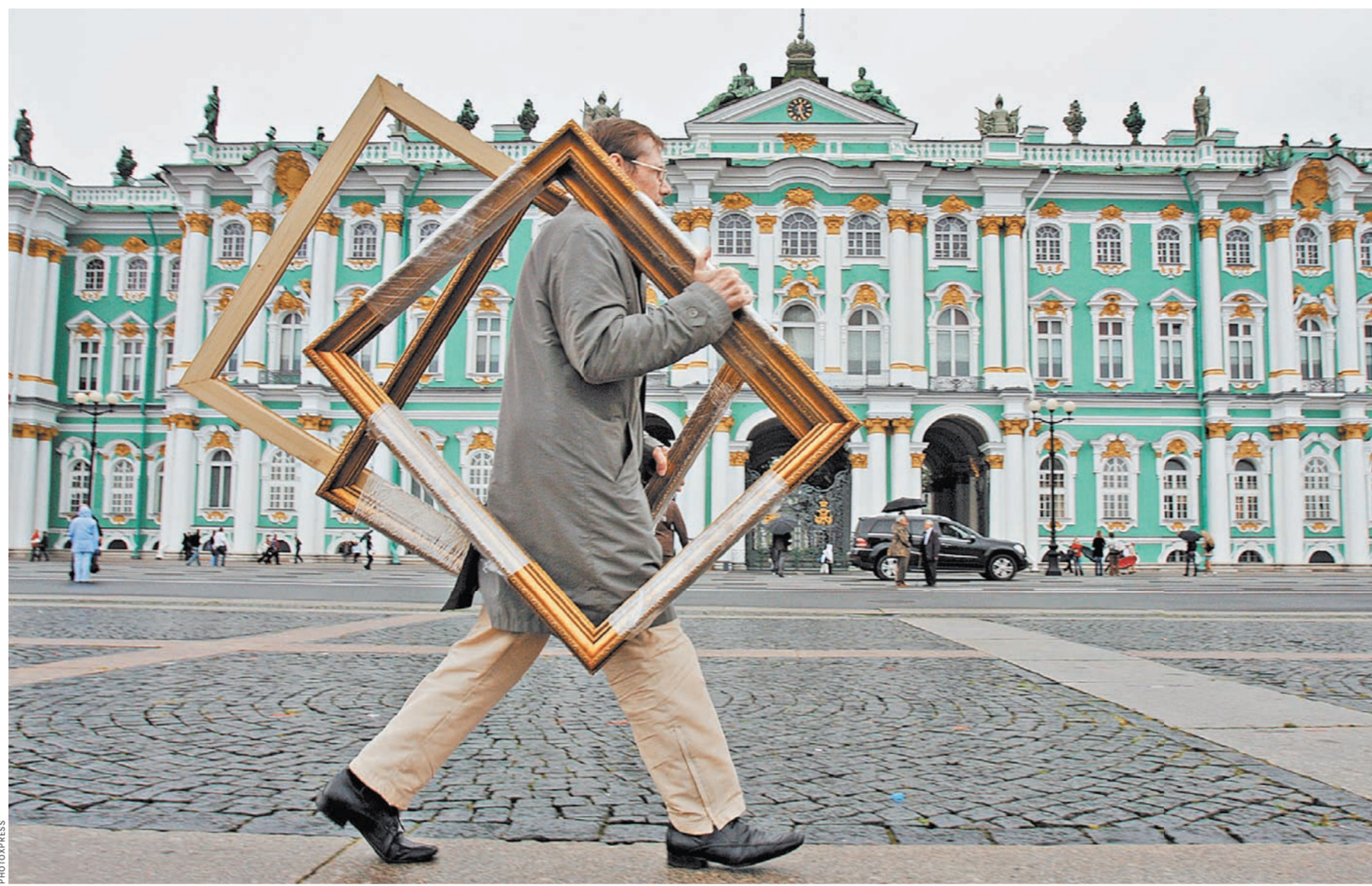
ЧОПы умеют «охранять окна». Дальше по сигналу должна приехать полиция. Но от картин в таком случае могут остаться одни рамы, равно как и от самих окон.

МИХАИЛ ПИОТРОВСКИЙ: У кого-то уже давно снята охрана, у кого-то есть ЧОПы. Увы, даются указания: как охранять окна, а дальше все сводится к тому, что полиция быстро придет по сигналу. На этом основывается вся охрана. Это общий вопрос охраны памятников культуры, и надо понимать, что этот вопрос важнее охраны банка. Банк может заплатить за свою охрану. Музеи за платить за охрану общего исторического, культурного, государственного достояния сами не могут. Рекомендации таковы: давайте наймите частные предприятия либо ГУП «Охрана», есть такое коммерческое предприятие при МВД. Но это совершенно другие деньги... Я обратился к Союзу музеев и предложил