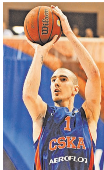
В новом сезоне баскетбольной Единой лиги сыграют 16 команд из восьми стран Европы.