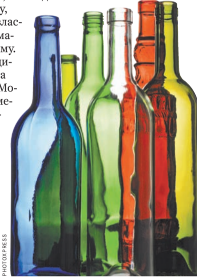
Самые дорогие бутылки принимают в Москве по 1,3 руб. за штуку.

Стекло, попавшее на мусорный полигон, разлагается более миллиона лет