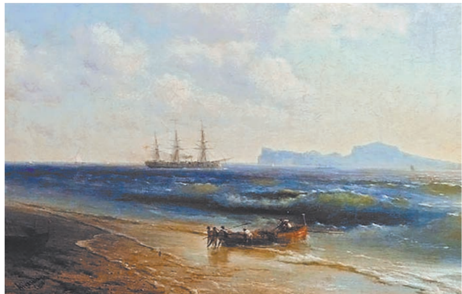
И.К. Айвазовский, «Море у острова Капри». 1876 г.