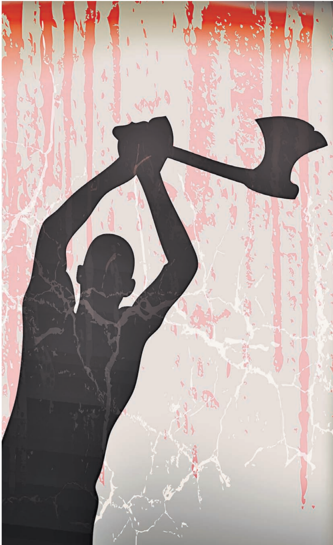
Почему тема душевнобольных всплывает только после того, как совершено преступление?

Читайте также: КС запретил скрывать от пациентов информацию об их психическом здоровье www.rg.ru/art/1145547