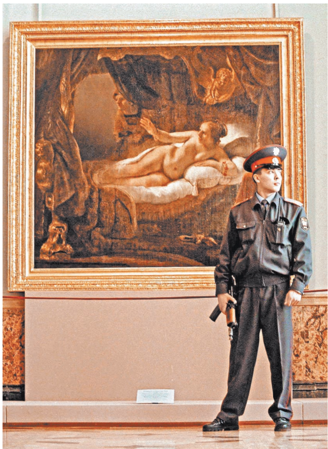
«Даная» Рембрандта стала одной из жертв вандалов, «специализирующихся» на произведениях искусства.

Ф едеральные музеи России получили извещение: с 1 ноября расторгаются договоры о государственной охране этих объектов. Открывшиеся перспективы встревожили музейное сообщество, как и всю культурную общественность страны. История с кражей в художественной галерее Тарусы, кажется, закончилась благополучно: полотна Поленова и Айвазовского найдены, подозреваемые в похищении задержаны. Но каждому ясно, что такой исход — скорее исключение. Гораздо чаще сокровища человеческой истории уходят бесследно или уничтожаются безвозвратно. Культура всеядна и беззащитна: число случаев, когда на нее покушались, огромно. Поэтому упразднение полицейских постов в музеях и галереях России получило такой резонанс: опасность для культурных сокровищ России может возрасти лавинообразно. Кто гарантирует, что в условиях снижения жизненного уровня не появятся все новые любители поправить свое благосостояние, «позаимствовать» ценности в ближайшем музее?