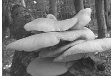
Параметры выращивания грибов.