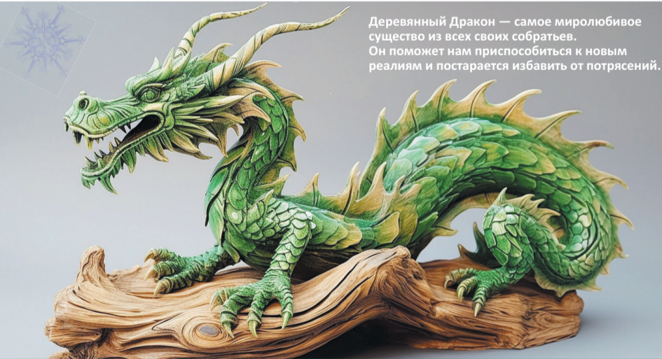
Деревянный Дракон — самое миролюбивое существо из всех своих собратьев. Он поможет нам приспособиться к новым реалиям и постарается избавить от потрясений.

В остальном смело выбирайте то, что вам понравится, учитывайте предпочтения того, кому дарите. Неплохо будет преподнести фигурку Дракона, особенно, выполненную из дерева, таким жестом вы покажете, что желаете успеха и благополучия. И, скорее всего, это все придет к человеку. Панно, постеры, картины, фото с изображением Дракона, предметы из дерева, это то, что будет как раз кстати.