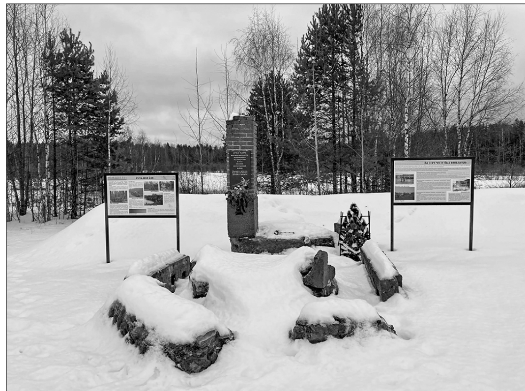
Мемориал жертвам финского концентрационного лагеря.

Жителям депутаты-предприниматели постоянно напоминают: «ваши права заканчиваются за вашим забором». Они пытаются всякими способами подавить волю жителей, с их слов, даже прибегают к угрозам.