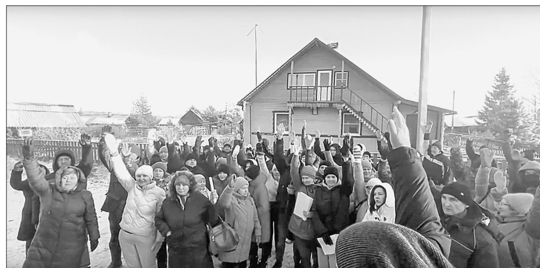
Жители Киндасово голосуют против того, чтобы их деревня считалась «самой весёлой» в России.

В 2025 году схема повторяется. Слушания снова назначены через платформу обратной связи на «Госуслугах», а значит, участвовать могут только зарегистрированные жители Пряжинского городского поселения (а туда входят пг. Пряжа, д. Киндасово и д. Манья). Собственники земли, про-