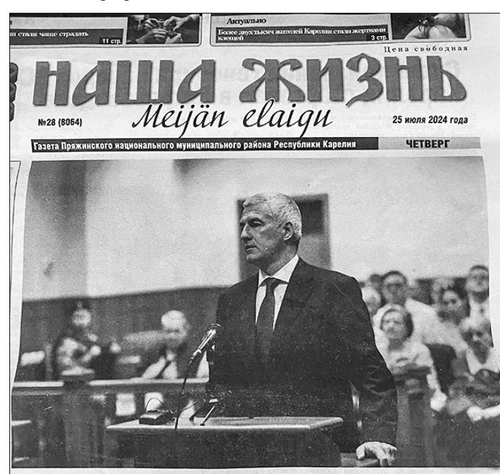
Суд о признании геноцида народов СССР в Карелии стартовал в Петрозаводске

начале XX века и раньше, переживают новую травму: предприниматели, используя свой властный ресурс и поддержку губернатора, пытаются сделать из трагического места «самую весёлую деревню» в федеральном масштабе. Включая недавно «самую весёлую деревню» пропреквалифицировали в программе «Поехали!» на Первом канале. Таким образом, всё больше людей становятся невольными участниками этой моральной катастрофы.