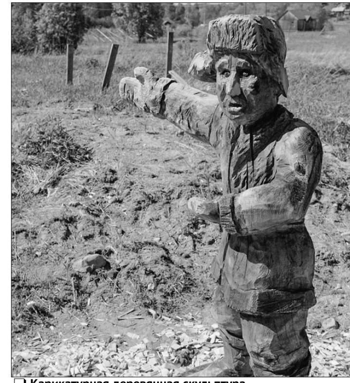
Карикатурная деревянная скульптура.