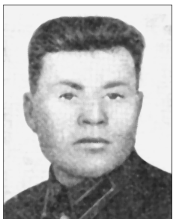
Герой Советского Союза Ф.П. Павлов.