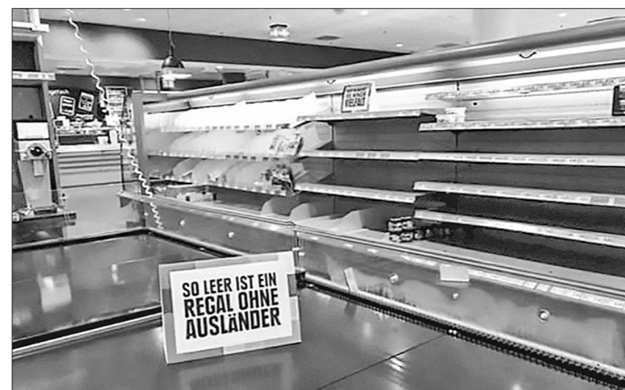
Типичная картина сегодня в супермаркетах ФРГ.

Вспоминается, как относительно недавно резкая критика российской обществу обрушилась на одну из наших чиновниц, предложившую малоумным слоям населения «перейти на макаронки». Чиновнику в итоге уволили с должности.