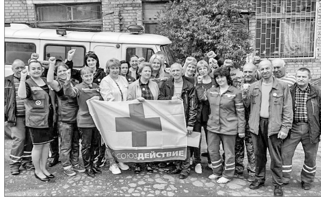
По сообщениям СМИ.

Кроме того, медики обращают внимание на то, что им не выплачивается надбавка за работу в сельской местности, где живёт около 20% жителей обслуживаемого ими Дорогобужского района. При этом полностью отсутствует приток новых кадров. В профсоюзе уточняют, что акции протеста предшествовали попытки найти понимание проблемы у администрации больницы, «однако работодателем отведен на обращение работников отпиской, а на встрече с коллективом и представителями профсоюза заявил, что у больницы нет денег».