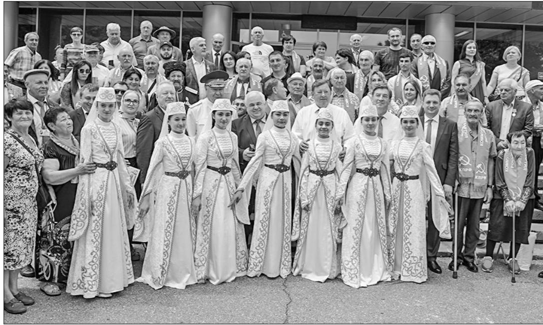
На протяжении 15 лет КПрФ с размахом проводит по всей России Пушкинские дни, посвящённые Александру Сергеевичу и Дню русского языка. И 2022 год — не исключение. После мероприятий в столице эстафету приняла Северная Осетия.