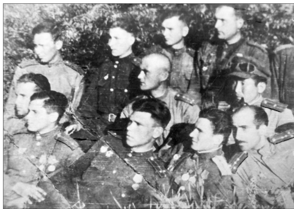
Бойцы 321-й стрелковой дивизии.