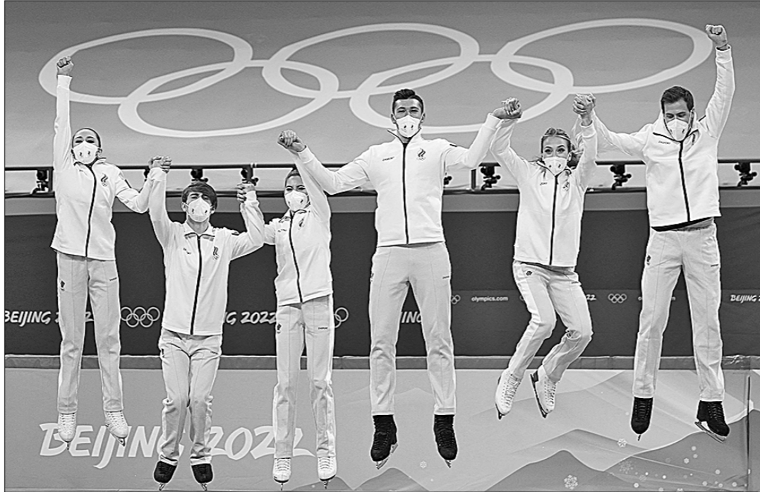
Мойру в Пхёнчхане-2018.

Пожалуй, ни одни спортивные соревнования не вызывают такой ажиотаж, как олимпийские. Особенно если речь идёт о дисциплинах, в которых ты или иная страна, являясь законодателем мод, предвкусывает обильный медальный урожай. Неудивительно, что на зимних Играх в столице Китая пристальное внимание приковано к фигурному катанию, где явным фаворитом считается сборная РФ, официально именуемая на главном старте четырёхлетия ОКР (команда Олимпийского комитета России). По прогнозам, наши мастера конька способны установить исторический рекорд, завоевав в четырёх видах из пяти семь наград, причём три из них, не исключено, окажутся золотыми. Однако давно доказано: предсказывать результаты баталлий мастеров конька — утиная скользкую природу льда — дело неблагодарное, сродни делу журы неубитого медведя.