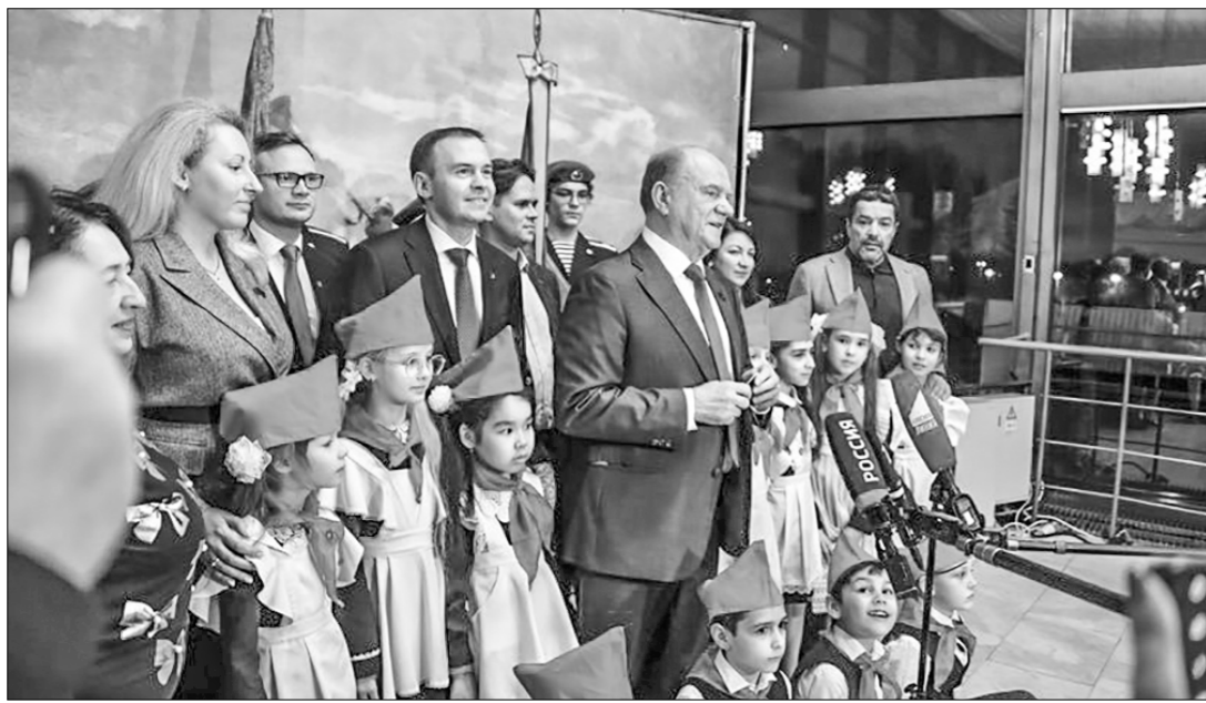
29 октября, вечером, в большом концертном зале Московского дворца пионеров состоялся праздничный концерт, посвящённый Дню рождения Ленинского комсомола. Зрителей и артистов со сцены поздравил Председатель ЦК КПРФ Г.А. Зюганов.

— Дорогие товарищи! Мои юные друзья, — сказал он. — Я хочу вас от всей души поздравить с этим выдающимся праздником. Комсомол родился в горах борьбы за свободу и независимость нашей тысячелетней Родины. Молодёжь откликнулась на призыв Великого Октября и пошла защищать свою любимую Советскую Родину. Она показала пример невиданной храбрости, достоинства и мужества. Мы сегодня гордимся и берём пример с поколения первых комсомольцев. Первый съезд комсомола провёл первую мобилизацию актива на фронт. В тот период зверствовал в Сибири адмирал Колчак, и комсомольцы ушли на фронт. На втором съезде комсомола была объявлена вторая мобилизация актива. И большинство делегатов приняли участие в боевых действиях на фронте. Третья мобилизация комсомольцев была проведена, когда войну развязали белополяки, которые также стремились растерзать нашу Родину. В дальнейшем заслуги ВЛКСМ были отмечены шестью орденами. Комсомольцы про-