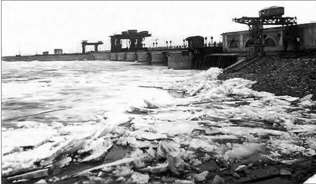
Так выглядел шлюз канала Москва — Волга возле реки Яхромы после сброса в неё воды.