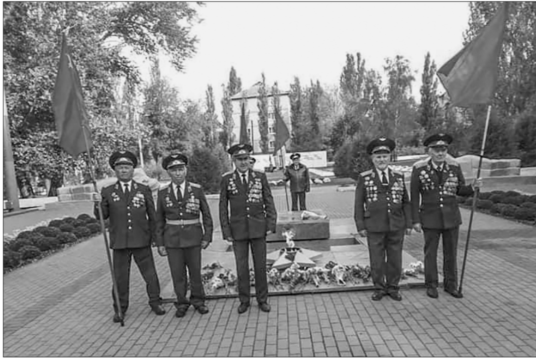
23 октября, в 78-ю годовщину освобождения города Мелитополя от немецко-фашистских захватчиков, представители городских организаций Компартии Украины и Всеукраинского Союза советских офицеров провели ряд торжественных мероприятий. Активисты возложили цветы к памятным местам, выставили почётный караул и организовали автопробег.

что победа в Мелитополе «...показала ведущую роль, которую играет Красная Армия в мировой истории, и твердую решимость русских истребить захватчиков». 87 человек получили звание Героя Советского Союза за освобождение города. Ни за какой другой город, освобожденный советскими войсками, не было столь многочисленных присвоений столь высокого звания, что показывает, насколько ожесточенными и кровопролитными были те бои.