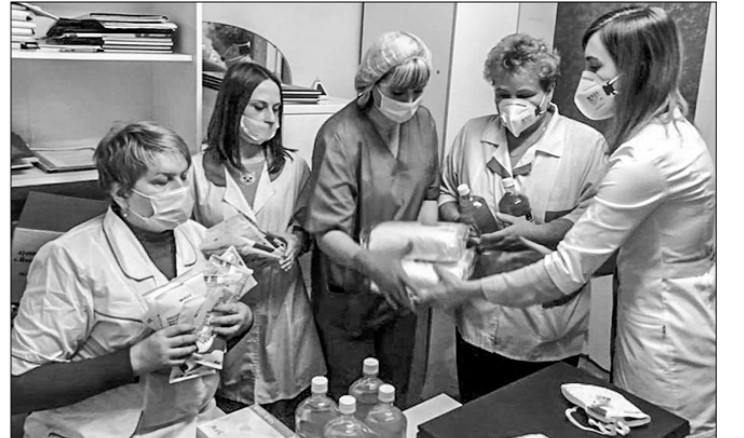
Сотрудники Вологодского роддома получают помощь «Альянса врачей».