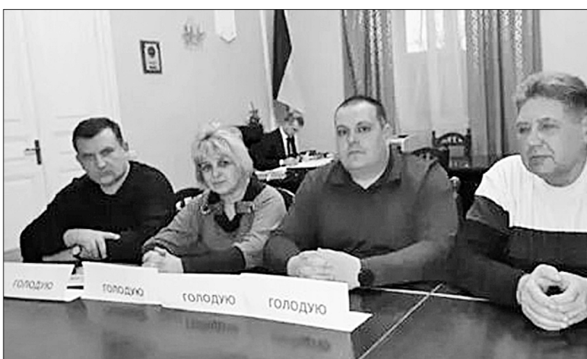
● Не позволим уничтожить угольную отрасль Галичины.