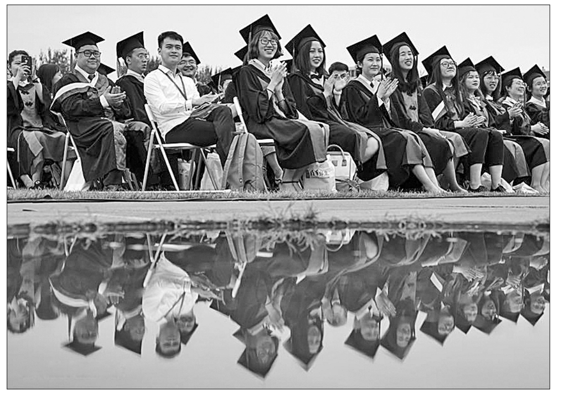
Церемония окончания основного курса обучения, а также присвоения учёных степеней 2019 года прошла в пекинском университете Циньхуа. В ней участвовали более 3000 выпускников, которые облачились по такому случаю в соответствующую парадную одежду.