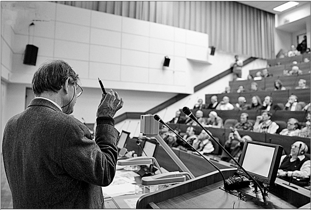
Сегодняшнее состояние высшего профессионального образования вызывает озабоченность.

— установление оплаты труда ассистента в вузе на одной ставке не ниже величины трёх прожиточных минимумов; оплата труда профессора на одной ставке в размере не ниже семи прожиточных минимумов и не ниже двукратного размера средней заработной платы по субъекту Российской Федерации; при сопоставлении со средним уровнем зарплаты в регионе должна учитываться именно ставка, а не весь размер оплаты труда; — увеличение размера надбавки за учёную степень кандидата и доктора наук; — привязка зарплат ректоров вузов к заработной плате профессора на одной ставке в пропорции 1,5:1, а зарплаты отраслевого министра в пропорции 2:1; — регулярная, с опережением темпов инфляции, индексация заработной платы про-