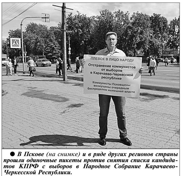
В Пскове (на снимке) и в ряде других регионов страны прошли одиночные пикеты против снятия списка кандидатов КПРФ с выборов в Народное Собрание Карачаево-Черкесской Республики.