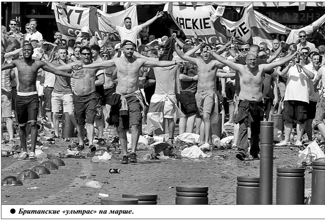
● Британские «ультрас» на марше.

Подобного рода пособия для болельщиков, отправляющихся в Россию, выпускают, конечно, не только в Англии, но и во многих других странах. И хотя в целом содержание таких рекомендаций весьма полезно, но в некоторых случаях, особенно в отношении поведения во время матчей, — британские национальные флаги с крестом святого Георгия, поскольку якобы эти, вероятнее всего, будут воспринято местными болельщиками как символ вражды и империализма. А особую осторожность британцам следует, по мнению полиции, соблюдать по какой-то причине именно в Волгограде, где их команда проведёт один из трёх своих матчей группового этапа — против команды Туниса.