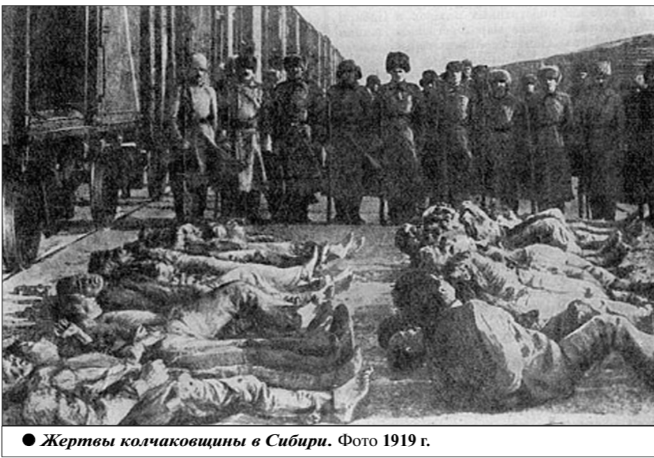
Жертвы колчаковщины в Сибири. Фото 1919 г.