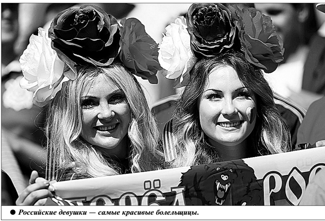
● Российские девушки — самые красивые болельщицы.

Впрочем, издание не ограничивается только советами. На его страницах недавно появилась довольно странная подборка, сделанная редакционным фотографом в Москве. Образ современной столицы России он создаёт, снимая преимущественно людей с татуировками, многими из которых участвуют в любительских боксёрских поединках... Такая Москва, пожалуй, действительно может привести в замешательство любого гостя.