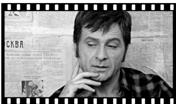
● Кадр из фильма «Двенадцать стульев».