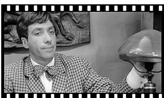
● Кадр из фильма «Золотой телёнок».

Романы Ильи Ильфа и Евгения Петрова «12 стульев» и «Золотой телёнок» — настоящие шедевры сатиры, остроумно рисующие глобальный образ эпохи. Главного героя произведений Остап Бендер давно шагнул со страниц книг в реальную жизнь, его меткие афоризмы известны даже тем, кто не прочитал ни строчки текста. Интересно, что изначально Бендеру в «Двенадцати стульях» отводилась эпизодическая роль: этот персонаж должен был произнести одну-единственную реплику «Может быть, тебе дать ещё ключ от квартиры, где деньги лежат?». Но постепенно сын турецкоподданного, против воли авторов, занимал всё большее и большее место в романе.