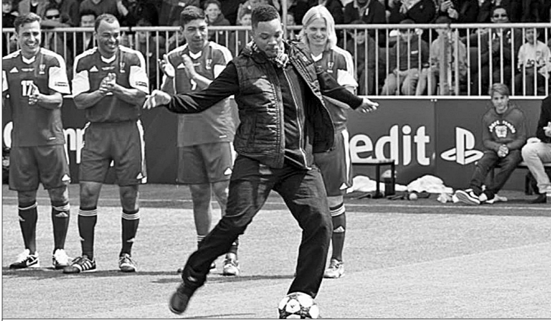
● Уилл Смит — большой поклонник футбола.