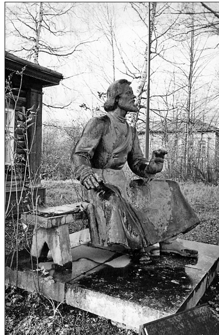
● Памятник поэту перед музеем на его могиле. Скульптор Е.А. Антонов.

Вынужденная городская жизнь тяготила крестьянскую душу поэта. При любом удобном случае он навещает родителей в деревне, помогает им в нелёгких крестьянских заботах. В один из таких приездов он записывает в дневнике: «Брат провёл первую борозду, указал мне, как надо пахать, я взялся за рогачи и тронул лошадей. Сначала было не ладилось, а потом ничего. Мужики смотрят на меня да только смеиваются: какова, мол, мужицкая-то работа! А мне хоть бы что: в охотку-то живо вспахал две полосы. Воротившись с поля, присел я к столу и под живым впечатлением совершенной работы написал стихотворение «Первая борозда».