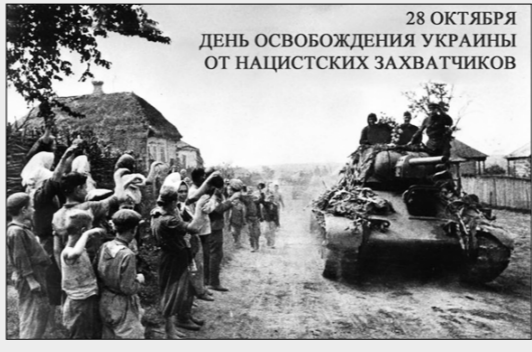
28 ОКТЯБРЯ ДЕНЬ ОСВОБОЖДЕНИЯ УКРАИНЫ ОТ НАЦИСТСКИХ ЗАХВАТЧИКОВ

В минувшее воскресенье общественность страны, прежде всего по инициативе Компартии Украины, широко отмечала 74-ю годовщину окончательного изгнания немецко-фашистских захватчиков со своей земли.