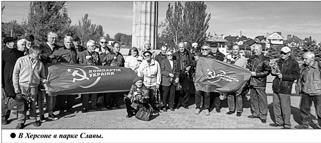
● В Херсоне в парке Славы.

ИМЕННО в последние дни октября 1944 года войска 4-го Украинского фронта под командованием генерала армии И. Е. Петрова завершили Восточно-Карпатскую наступательную операцию, которую 9 сентября начала 1-я Гвардейская армия. После освобождения от гитлеровцев городов Хуст и Мукачево, а 27 октября — Ужгорода войска Красной Армии вышли на нынешнюю границу Украины.