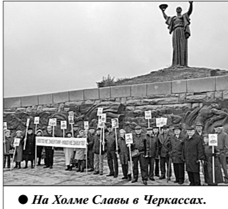
● На Холме Славы в Черкассах.

После того как в Черкассах на Холме Славы представители областного и городского комитетов КПУ отдали должное воинам Красной Армии, погибшим при освобождении города от немецко-фашистских захватчиков и их сателлитов, они выразили возмущение попыткой нынеш-