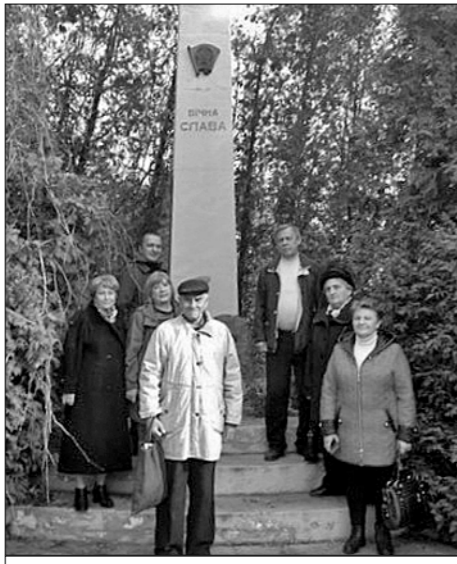
● Ветераны комсомола города Черновцы.

Отдавая должное подвигу воинов Красной Армии и не покрывшегося окупантам народа Украины, первый секретарь ЦК КПУ Пётр Симоненко напомнил, что во время Великой Отечественной войны на этой территории проходили битвы, имевшие особое важное значение, непосредственным образом повлиявшие на ход войны. Всего в 1943—1944 годах Вооружённые Силы СССР провели на территории УССР 15 наступательных операций. А в боях за освобождение республики на украинской земле было сосредоточено до половины всех советских сил.