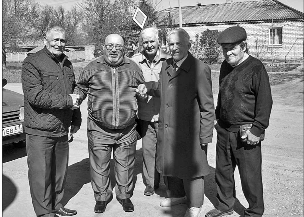
● Коммунисты уверены: проект «Донское мясо» — это пиар; больших стад теперь в Заветинском районе нет.

Алексей ХОРОШИЛОВ. (Соб. корр. «Правды».) с. Заветное, Ростовская область.