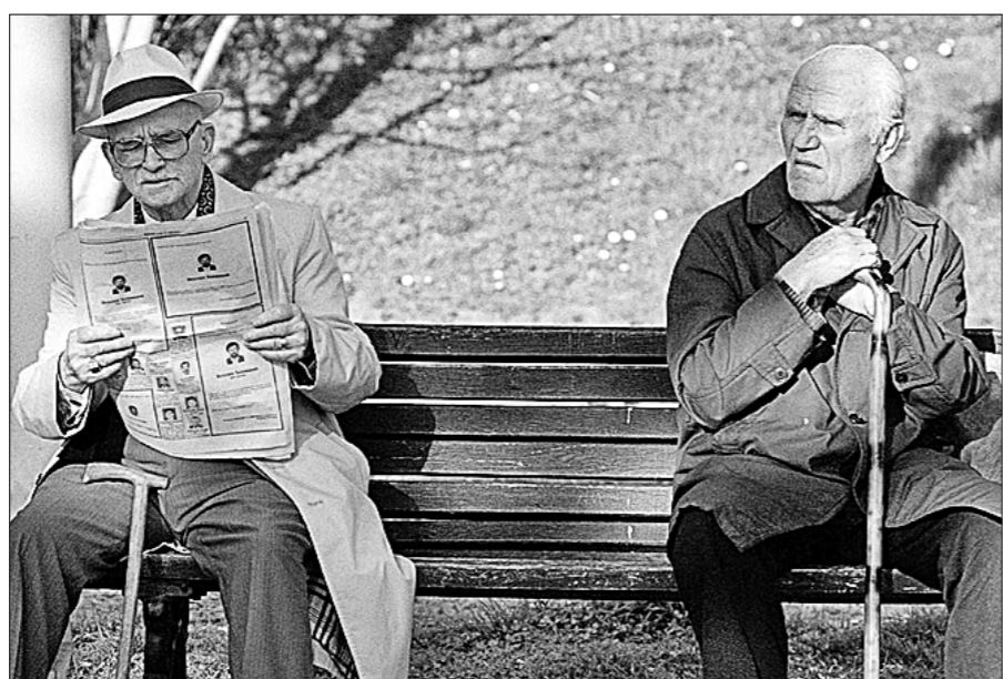
«Накопительная» не устранит риск потери пенсионных накоплений.

При зарплате 35 тысяч рублей ежемесячный взнос работника составит 2100 рублей, следовательно, за 30 лет трудового стажа накопленный пенсионный капитал составит 756 тысяч рублей. (Здесь мы считаем пенсионный капитал без учёта инвестиционного дохода; точнее, мы предполагаем, что доходность инвестирования в среднем равна величине инфляции, то есть пенсионные накопления не