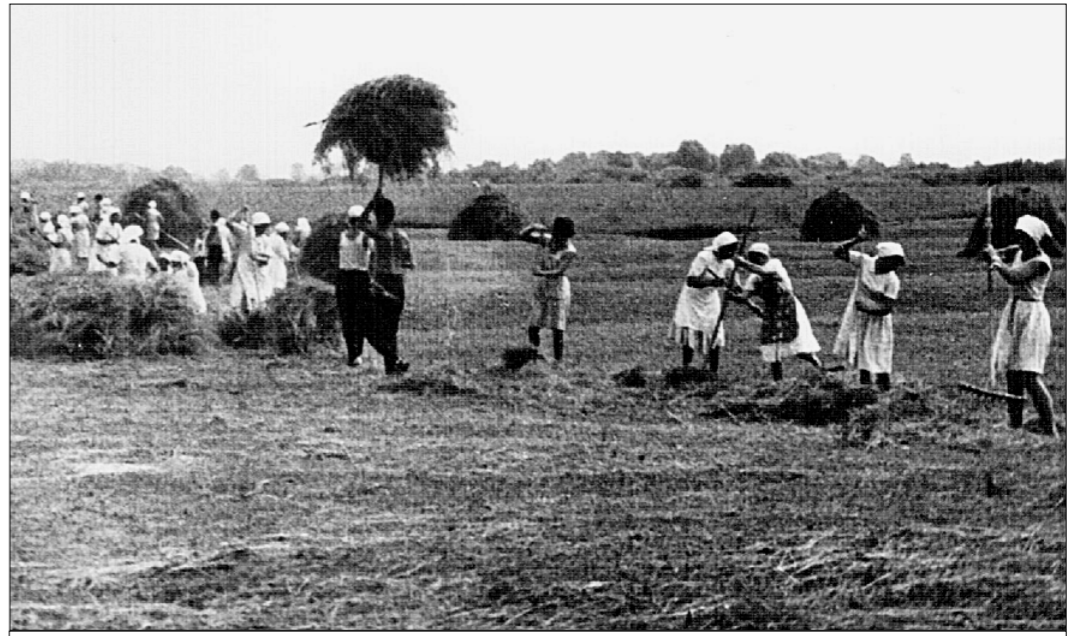
● На заготовке сена в пойме Оки. (50-е годы).

Конечно, жили в те годы нелегко и непросто, в том смысле, что надо было много трудиться. А теперь о том, как кормили колхозники не себя,