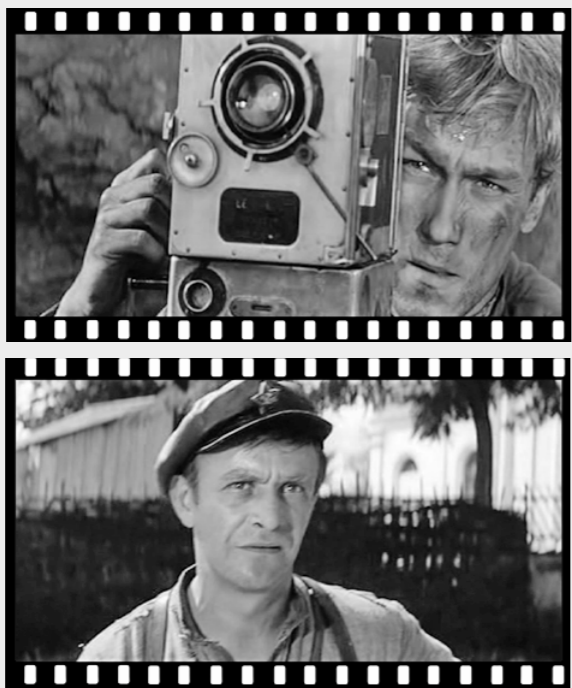
Кадры из фильма «Служили два товарища».

Крым. Гражданская война. Командир полка Красной Армии поручает бывшему фотографу Некрасову провести аэросъёмку сил противника с помощью трофейного киноаппарата. Вручая герою камеру, командир говорит: «Кино — это большое дело! Кино! «Женщину-вампира» видел? «Сказки любви роковой»... Сидишь и обмираешь... Но мы с тобой будем снимать совсем другое. У меня какая идея. Заснять всех наших красных героев, их революционную доблесть и славу».