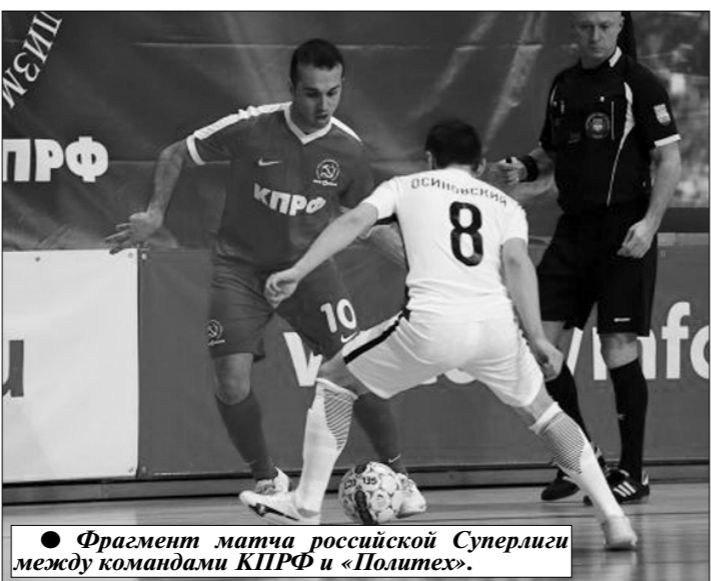
● Фрагмент матча российской Суперлиги между командами КПРФ и «Политех».

сразу двумя командами, что встречается нечасто. Более опытная команда, в которой выступают как наши лучшие молодые игроки, так и группа ветеранов, завершившая свои выступления в Суперлиге, называется КПРФ-2. Вторая команда — «Красная гвардия» — это чисто «молодёжка», составленная из перспективных ребят 17—20 лет. Важно, что оба наших коллектива выступают в Высшей лиге отечественного мини-футбола весьма успешно. Так, КПРФ-2 является действующим победителем турнира Высшей лиги, претендует на первенство и в текущем сезоне. «Красная гвардия» пусть и не столь стабильна, как старшие товарищи, но тоже выступает достойно, способна