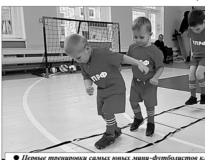
● Первые тренировки самых юных мини-футболистов клуба.

На этот финальный турнир сильнейших мини-футбольных команд КПРФ всегда приезжает Геннадий Андреевич Зюганов, участвующий в награждении победителей и призёров. Надо отметить, что он всегда с большим вниманием относится к интере-