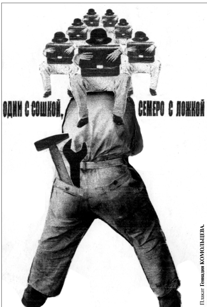
Одним с сошкой, семсеро с ложкой

Очевидно, что без национализации природных ресурсов повысить эффективность их использования и коренным образом улучшить благосостояние населения не удастся.