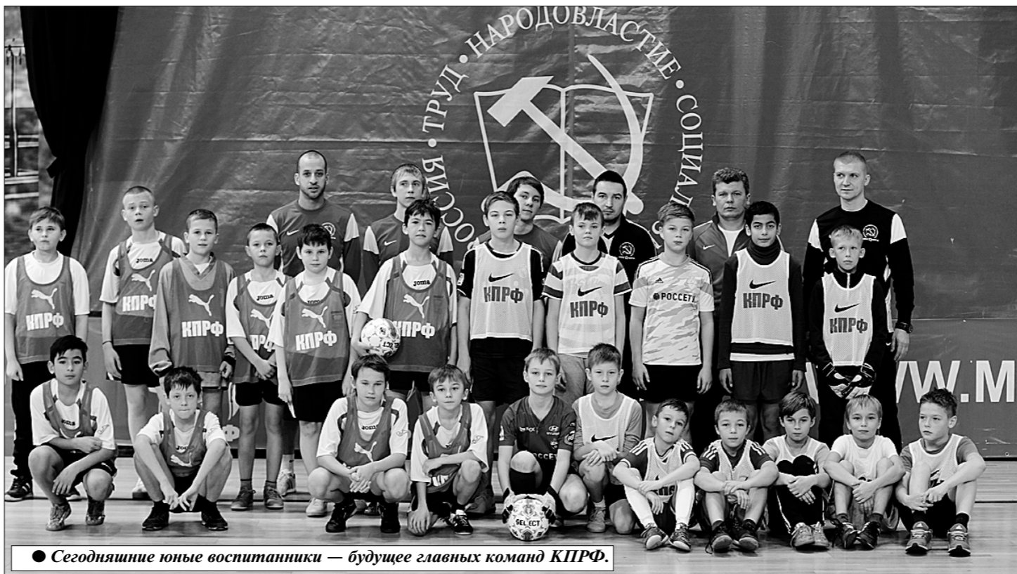
● Сегодняшние юные воспитанники — будущее главных команд КПРФ.

Первый вопрос собеседникам касался того, как выглядел клуб «мини-футбольная» вертикаль, что и стало залогом тех успехов, которые наблюдаются сегодня в этом виде спорта у клуба. В чём особенность этой работы, приведшей к столь очевидным и достаточно быстрым — всего за несколько лет — успехам?