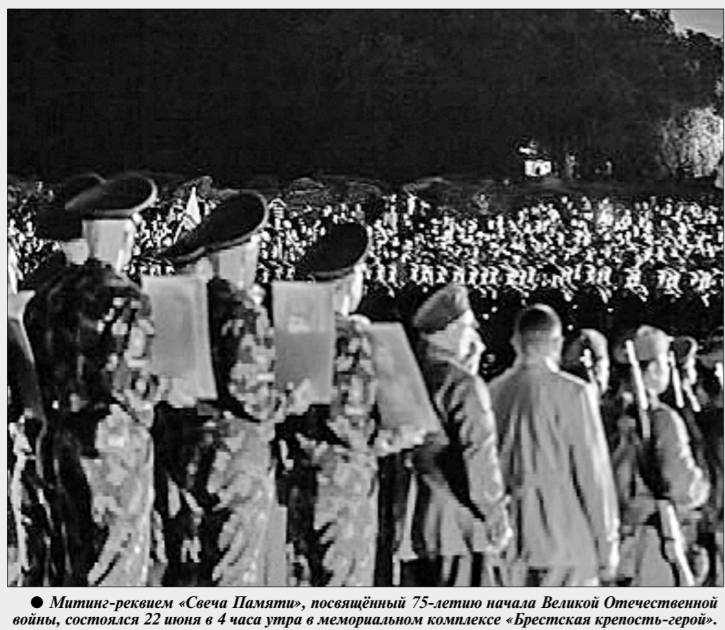
Митинг-реквием «Сеча Памяти», посвящённый 75-летию начала Великой Отечественной войны, состоялся 22 июня в 4 часа утра в мемориальном комплексе «Брестская крепость-герой».