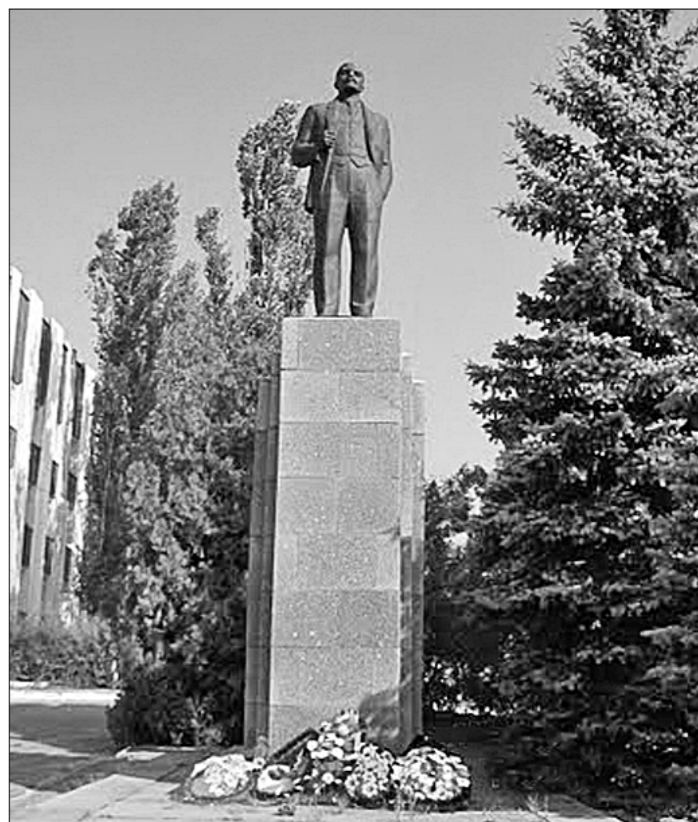
Памятник В.И. Ленину в Верхнем Мамоне.