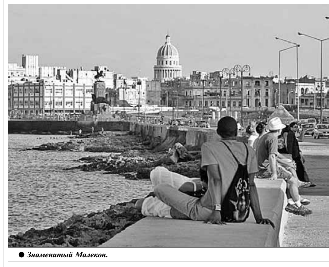
● Знаменитый Малекон.

приятия, а организуем прежде всего кооперативы, совместные предприятия с зарубежными фирмами для того, чтобы был общий контроль над средствами производства.