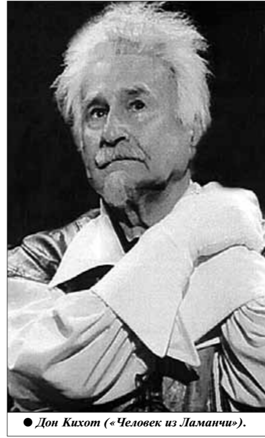
● Дон Кихот («Человек из Ламанчи»).