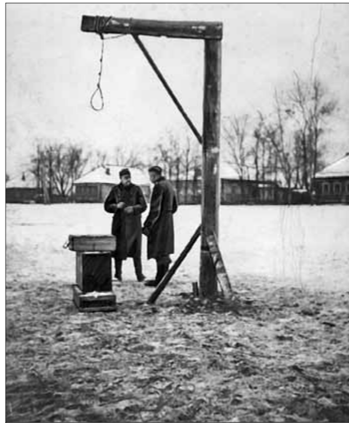
● Фашисты, старавшиеся своими фотокамерами зафиксировать казнь Зои, проявили не только садистское сладострастие, но и отменный педантизм. Снимался весь палаческий «процесс», последовательно и пунктуально — от установки виселицы до последнего момента жизни советской героини.

Так, серьёзно настораживал случай, происшедший недавно со Спрогисом, а точнее