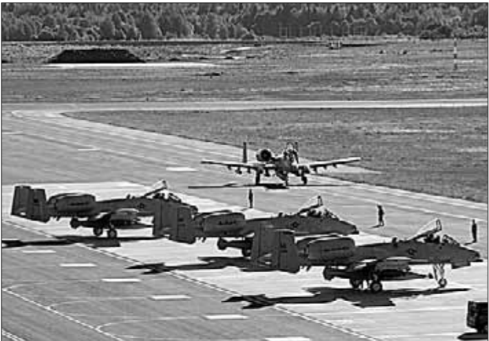
Авиабазы в Эмари.

ТАК, БЫЛ ВВЕДЁН в окончательную эксплуатацию бывший аэродром советской стратегической тяжёлой авиации в Эмари (55 км от Таллина), на котором теперь располагаются военно-воздушные подразделения стран — членов НАТО. Позднее к ним добавилось несколько подразделений тяжёлой бронетехники ВС США. Таким образом, Эстония превратилась в постоянную военную базу Пентагона, сократив благодаря аэродрому в Эмари время полёта бомбардировщиков НАТО к Санкт-Петербургу до пяти минут.