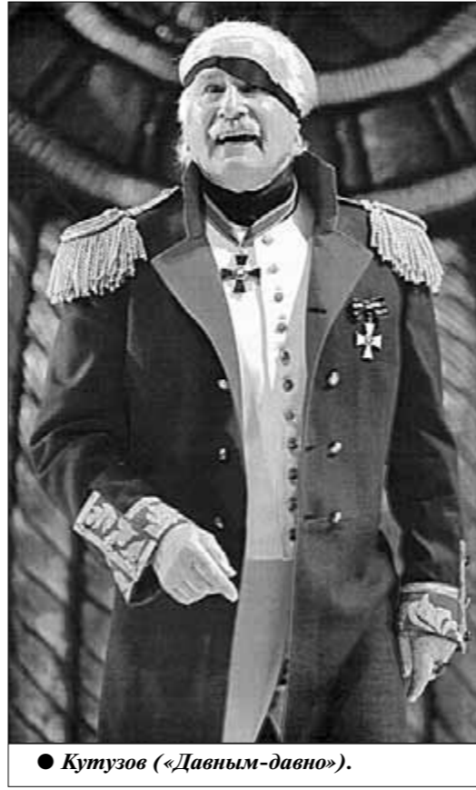
● Кутузов («Давным-давно»).