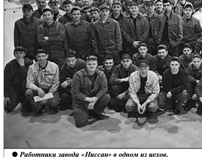
● Работники завода «Ниссан» в одном из цехов.

Государственная инспекция Санкт-Петербурга по труду оштрафовала завод «Ниссан» на 85 тысяч рублей на основании части 1 статьи 5.27 Кодекса об административных правонарушениях, предусматривающей ответственность за нарушение законодательства об охране труда. В свою очередь,