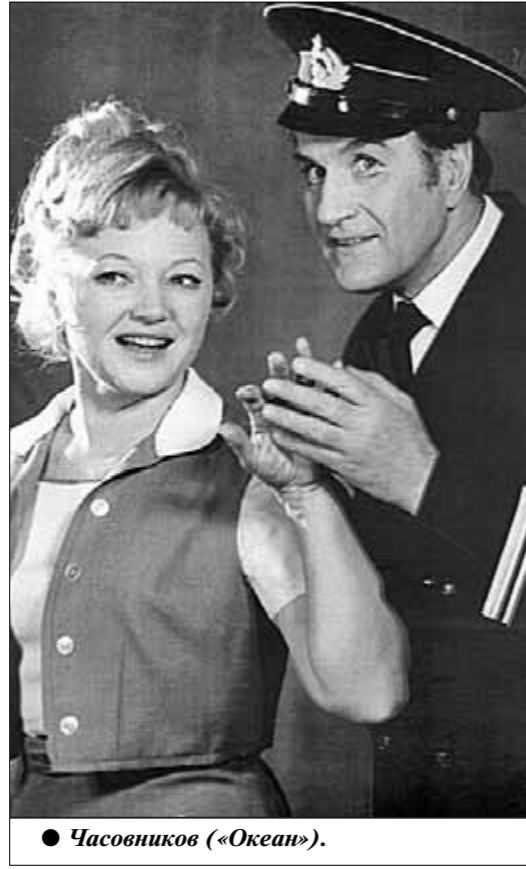
● Часовников («Океан»).