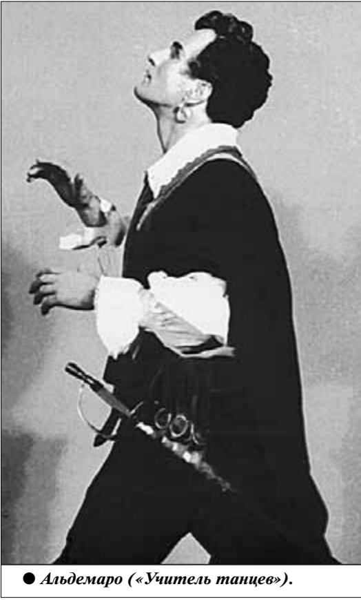
● Альдемаро («Учитель танцев»).