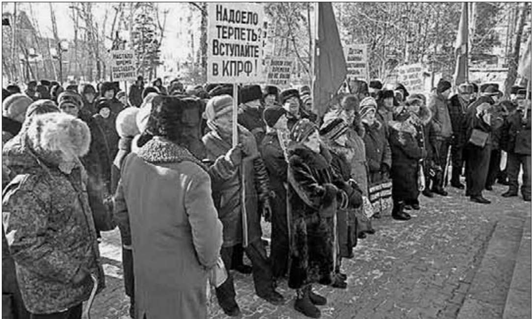
Жители города Белогорска Амурской области собрались на организационный коммунистами митинг, где выступили против социально-экономической политики российского правительства и новыхборов в ЖКХ.

РЕЗОЛЮЦИИ МИТИНГА говорится: «Мы, жители города Белогорска и Белогорского района, выражаем протест против действий правительства России в главе с Д. Медведевым. Считаем, что они имеют ярко выраженный антинародный характер, что подтверждается попытками защитить доходы олигархов и сэкономить на детях, пенсионерах и инвалидах, поколении «детей войны».